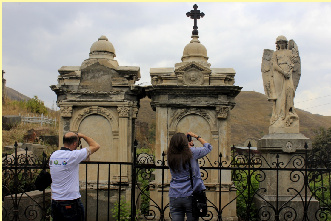
Մրցույթի մասնակիցները Վանաձորի Սուրբ Կարապետ եկեղեցու գերեզմանատանը: