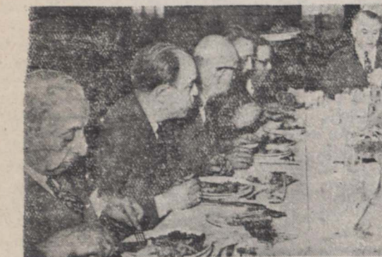
آقایان وزیران روزهای دوشنبه معمولاً نهار را با حضور تیمسار سپید زاهدی نخست وزیر در باشگاه افسران صرف میکنند و پس از آن جلسه هیئت دولت در تالار میاورسان نهار خوری تشکیل میشود. این عکس دیروز در باشگاه افسران از آقای نخست وزیر و آقایان وزیران هنگام صرف نهار برداشته شده است. بطوریکه در این عکس ملاحظه میشود دیروز آقای نخست وزیر لباس سیویل در برداشته.

وزارت امور خارجه انگلیس به افتخار کاردار سفارت ایران در لندن ضیافتی ترتیب داد کاردار سفارت ایران در لندن با استیونس آشنا گشت لندن - خبر کوزاری فرانسه - دیروز از طرف سلوین لویوید که در ضیافت آنتونی این وزیر امور خارجه انگلیس فالت و وزارت امور خارجه را چیده دار ضیافت ناهاری با افتخار آقای افشار قاسلو کاردار سفارت ایران در لندن داده شد. در این ضیافت همه اراجال و اعضاء عالی رتبه وزارت امور خارجه انگلیس از جمله لرد دینیک سخنگوی وزارت امور خارجه انگلیس در مجلس لردها حضور داشتند. در این ضیافت آقای افشار قاسلو با سر ارج استیونس سفر کیر چای انگلیس در ایران آشنا و مدتی با وی مذاکره پرداخت