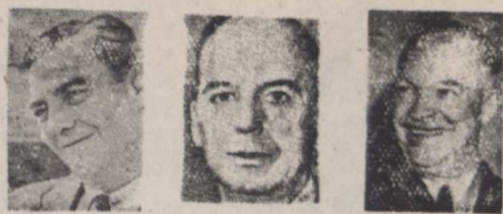
رئیس جمهوری آمریکا دستان کل ایاز هور کارناسیوت

این قانون اولین مرتبه در سال ۱۹۲۱ درباره کیانی بزرگ و رتک سازی آمریکا موسوم به «دو پیوندولوس» که توسعه عیبی یافته و موفق شده بود چندین کیانی دیگر را در خود متسلط نموده و بازار رتک آمریکا با انحصار خود