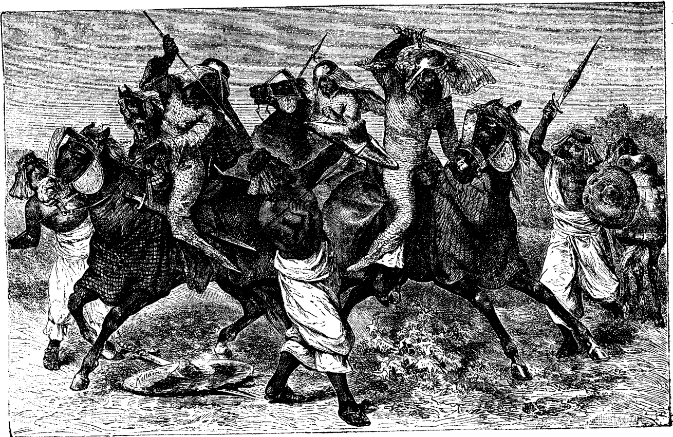
O LUPTĂ ÎN RESĂRIT.

Cele trei surori ale lui Ionel, — Catia, Sonia și Mașa, — cea mai mare era de unsprezece ani, — sedeau la masă și nu-și luau ochii dela prietenul lui Ionel. Ceapoff era de aceeaș vârstă și tot așa de nalt