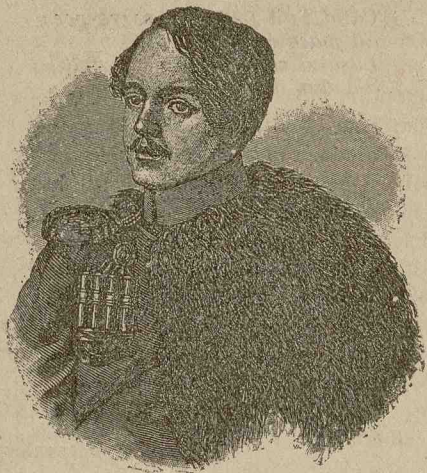
MICHAÏ JURJEWITCI LERMONTOFF

Se crede că minunatul poet rus ar fi descinzând dintr'o familie scoțiană, și că unul din strămoșii săi ar fi chiar bardul Thomas Learmouth, pe care Walter Scott îl cântă în «Thomas the Rimer».