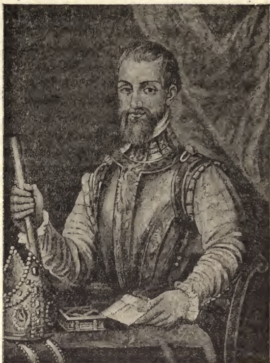
El Licenciado D. Pedro de la Gasca, según retrato existente en Valladolid.

dad (1). “No quiero—dijo—suelo ni recompensa de ninguna especie; con mis hábitos y mi breviario espero llevar á cabo la empresa que se me confía.” (2). Parece ser que los individuos del Consejo no se creyeron autorizados para conceder los extensos poderes que solicitaba La Gasca; pero el Emperador, a una carta del antiguo colegio de San Bartolomé de Salamanca, contestó (16 febrero 1546) confiéndole absoluta autoridad. Sería La Gasca nombrado presidente de la Real Audiencia, se le autorizaba para hacer nuevos repartimientos y confirmar los ya hechos, declarar la guerra y levantar tropas, nombrar y separar todos los empleados. Podía ejercer la regia prerrogativa de perdonar los delitos y conceder amnistía a todos los complicados en la rebe-