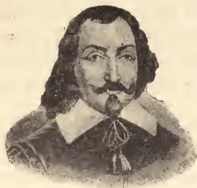
Samuel de Champlain.

puerto y comarca de Annapolis, que él llamó de Port-Royal , Champlain, habiendo explorado la bahía de Fundy, entró en un río en cuya desembocadura halló pequeña isla; al río le denominó de Saint-Jhon . (San Juan) y a la isla Sainte-Croix (Santa Cruz). En la isla y en pobres viviendas protegidas por un fuerte se instaló Champlain con 80 hombres, siendo de notar que fué el único lugar habitado por la raza blanca des-