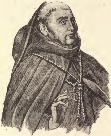
Fray Juan de Zumárraga, Arzobispo de México.

compuesta de un presidente (Nuño Beltrán de Guzmán) y de cuatro oidores (Diego Delgadillo, Juan Ortiz de Matienzo, Alonso de Parada y Francisco Maldonado). El obispo Zumárraga y oidores llegaron a