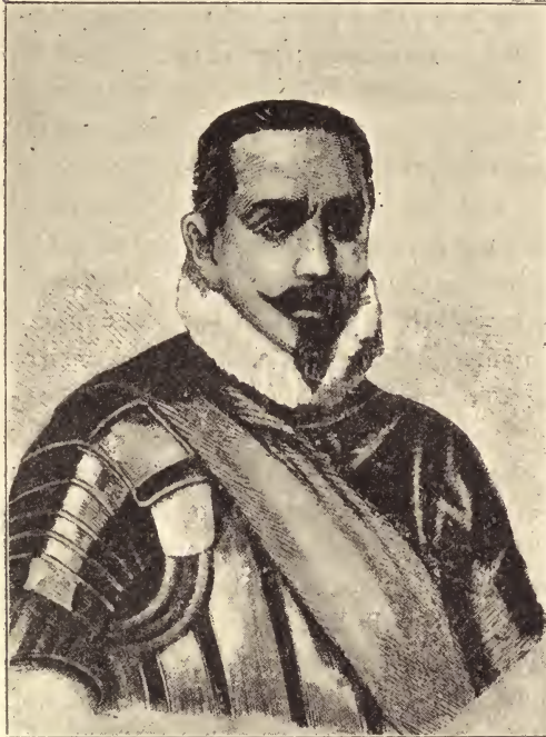
Pedro de Valdivia.

niendo también que sostener no pocas luchas con los indios. No huelga decir que Panllu continuaba, si bien a disgusto suyo, al lado de los españoles. Salieron de Arequipa a mediados de marzo de 1537 en dirección al Cuzco, encontrándose enfrente de los parciales de Pizarro. Las luchas que se originaron y la muerte de Almagro (8 agosto 1538), se trataron con la suficiente extensión en la historia del Perú; ahora sólo