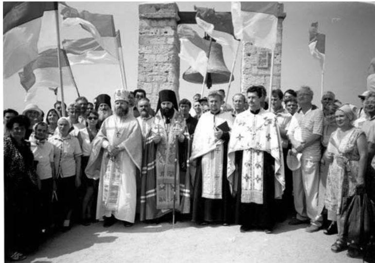
Святкування Дня незалежності України в Херсонесі, м. Севастополь, 2000 р.

У січні 2000 р. просвітня Керчі посприяли зняттю у вестибюлі міської ради барельєфа Леніна; 10 вересня на фронті будівлі