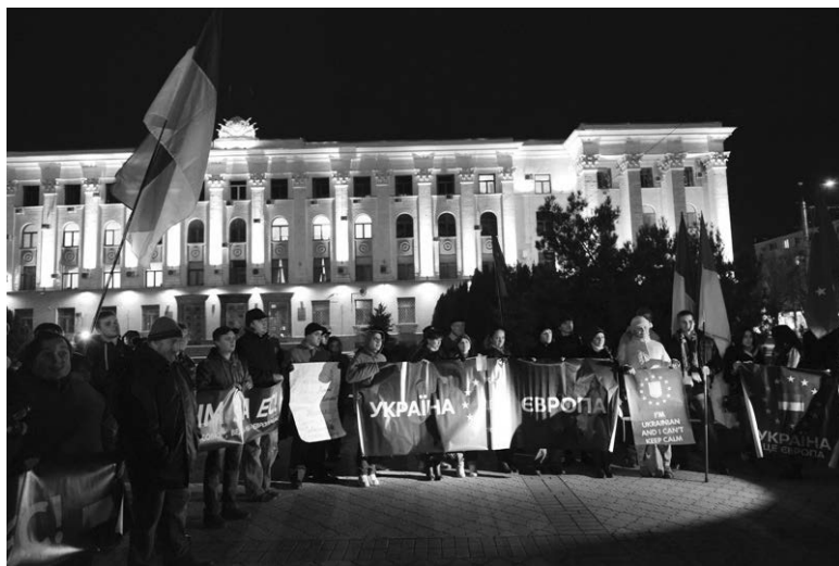
Акція руху «Євромайдан-Крим» під стінами Ради міністрів Криму, м. Сімферополь, 27.11.2013 р.

Того ж дня в Севастополі прихильники євроінтеграційного курсу України висловили свою солідарність з учасниками Євромайдану. В місті міліціанти та бійці спецпідрозділів живим щитом відокремлювали ідейних проросійських маргіналів від громадян, які прийшли заявити про свою позицію незгоди з діями уряду України, що відступив від проголошеного курсу на євроінтеграцію і розвернув вектор зовнішньої політики держави на 180 градусів.