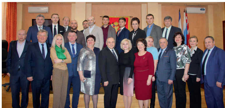
Учасники підписання «декларації про створення асоціації міст античної спадщини Північного Причорномор'я». Керч, 6 лютого 2020 р.

Євпаторія – музей старовини північно-західного Криму «Кара-Тобе», краєзнавчий музей; Сімферополь – фортеця «Неаполь Скіфський», Центральний музей Тавриди.