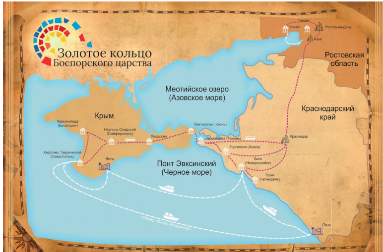
Географія проекту «Золоте кільце Боспорського царства»

До турів тривалістю від двох днів до тижня було включено відвідування близько 30 пам'яток античності та сучасних об'єктів, пов'язаних з історією Боспору. Зокрема, в Криму туристів ознайомлюють із такими об'єктами: Севастополь – Херсонес Таврійський, мис Фіолент, Свято-Георгіївський чоловічий монастир; Керч – Царський і Мелек-Чесменський кургани, «Золота скарбниця», Лапідарій, античні городища Пантікапей, Німфей, Тірітака, Мірмекій та ін.; Феодосія – музей старовини, музей грошей, музей підводної археології; Ялта – археологічний комплекс «Фортеця Харакс»; Чорноморське – музей-заповідник «Калос-Лімен»;