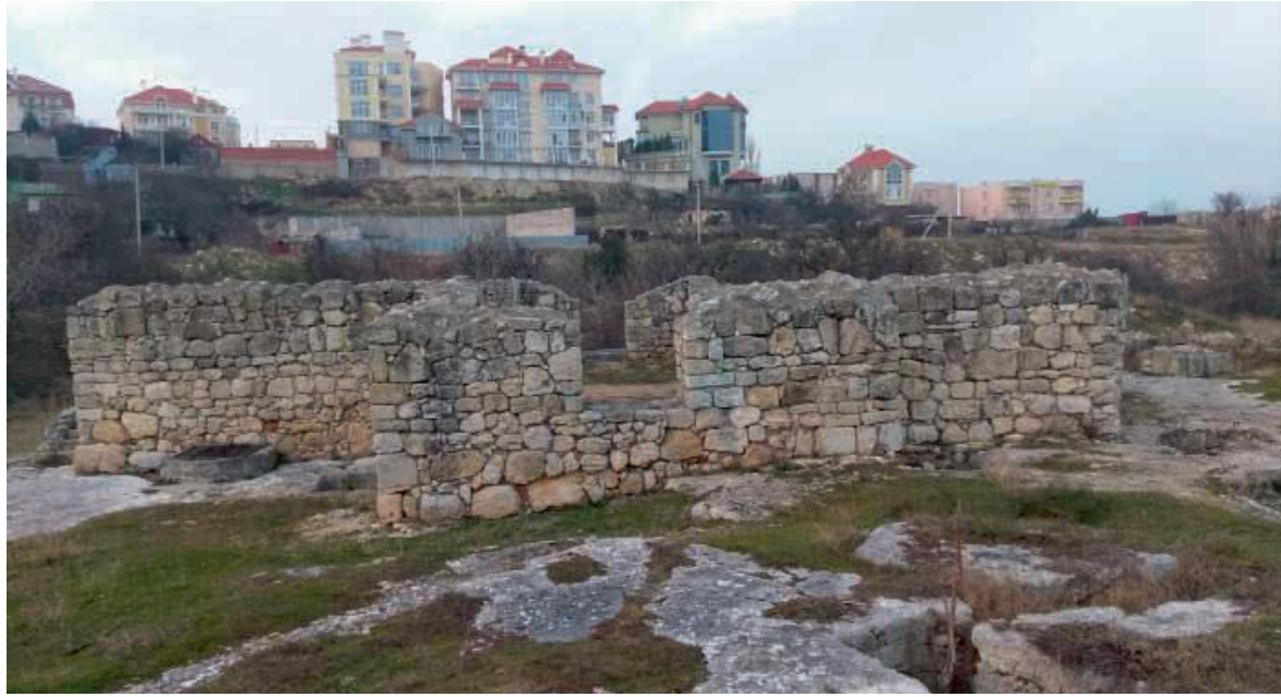
Храм Богородиці Влахернської в Карантинній балці.

Крим є невід'ємною частиною території України, а його окупація Російською Федерацією згідно з міжнародним гуманітарним правом (надалі – МГП) кваліфікується як міжнародний збройний конфлікт. З огляду на це доцільно аналізувати процес по-