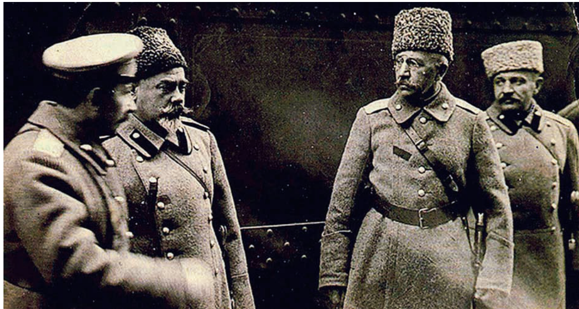
Генерал Денікін і командування Добровольчої армії

26 червня В. Татищев скликав нараду представників земських управ та міського самоврядування 6 . Однак 29 червня Денікін розпустив усі міські думи та земства. Було проголошено, що до встановлення в Росії «загальнонародної влади» буде і-