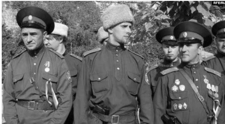
Російські «казаци» з пістолетами у Севастополі.