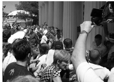
Напад на українських моряків, 5 липня 2008 р..

з ініціативи міської організації ВУТ «Просвіта» замість радянської символіки було встановлено державний герб України.