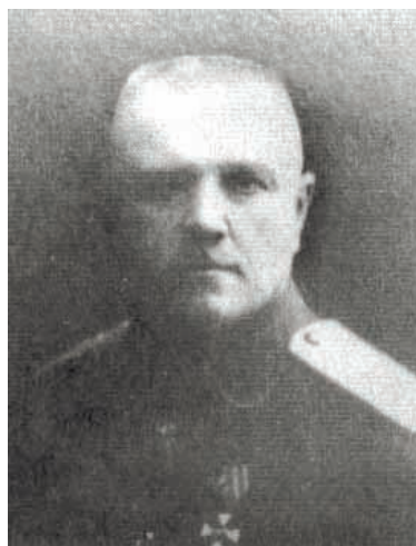
Генерал-лейтенант М. Шиллінг

увати тільки «влада верховного правителя Росії і верховного головнокомандувача Російської армії адмірала Колчака та його представника на Півдні Росії, керівника Добровольчої армії Денікіна» 7 . Щодо органів місцевого самоврядування Денікін зазначив, що незабаром будуть проведені нові вибори. За новою інструкцією передбачалося підвищення вікового цензу виборців до 25 років. Запроваджувався дворічний ценз осілості 8 .