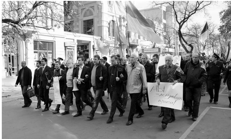
Перша акція руху «Євромайдан-Крим», м. Сімферополь, 24.11.2013 р.

24 листопада в Сімферополі під час першої великої акції прихильників євроінтеграції під назвою «Я обираю ЄС» було оголошено про створення громадського руху «Євромайдан-Крим». На противагу цим заходам відбувся провладний мітинг під назвою «За стабільність і процвітання».