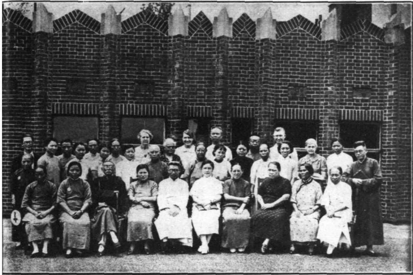
蘇申錫浸會服務難民同工合照

自戰事發生以來，蘇申錫浸會教友，自動踴躍參加難民所，難民醫院，難民兒童義校，傷兵醫院等處服務，並宣傳福音，成績甚佳。上圖，不過是同工中四份一的人數，合照留為紀念。