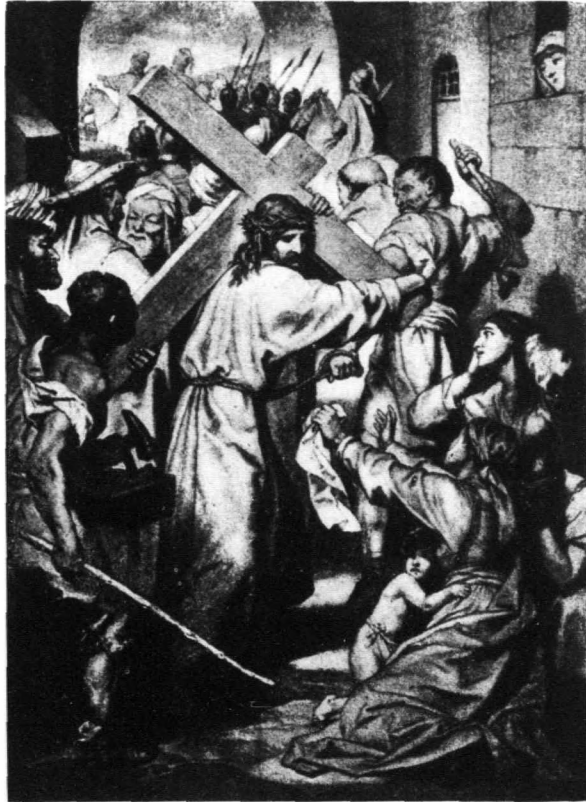
耶穌背十字架赴各各他