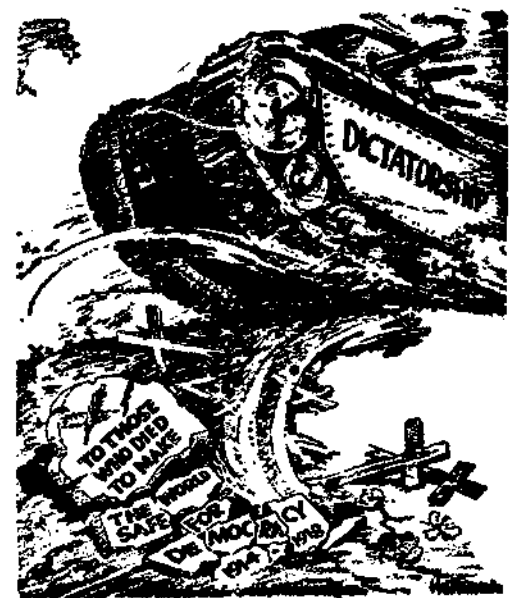
世界的安全與和平，在法西斯巨輪下毀滅了。

日本平沼內閣，因歐局的變化而犧牲，阿部新內閣登台後，對於歐局遂不得不採取謹慎的態度。外相一職原來內定日駐英大使重光葵擔任，暫由阿部兼攝，但因日本外交屢遭失敗，對於歐洲各國不敢作左右袒，甚至放棄從前所內定的計劃，以免被人猜測日本外交的未來色彩，所以重光葵或其他駐歐各國大使均未能坐上 當野村尚未就職以前，日本方面已大吹大擂，設野村之登台，旨在改善日美關係。例如「讀賣新聞」謂：「自中國事件發生以還，日美關係日臻惡劣，近因美國片面廢止對日商約，緊張愈甚。兩國前途關係殊堪隱憂，當此之時，首相阿部以外相一職昇諸野村，實有特殊意義在焉。」這幾句話不啻已把日本的隱衷及其外交的動向，和盤托出。爲什麼野村能有調整日美邦交的「特殊才幹」呢？據日人自己所說，祇因野村曾數度赴美，最初肆業於美國海軍學校，當羅斯福總統任海軍部次長時，野村曾任駐美大使館海軍武官，後又出席華盛頓會議，爲日本代表。故在美國交頗多。日人實以「美國通」視野村，且故意用「知交頗多」四字，來點破野村的「特殊才幹」。大概日人希望野村能利用私誼，以轉移美人對日的態度吧？可是，其實如果野村祇憑這一點所關