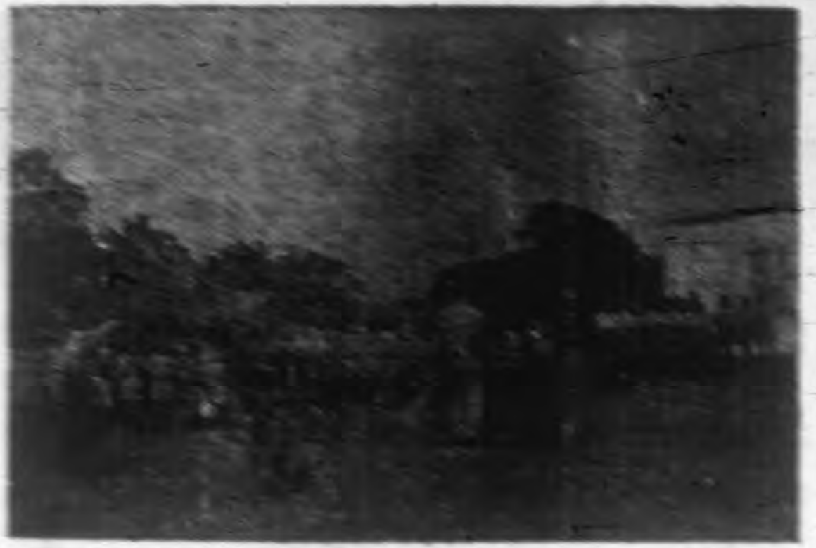
「校保六、四十醫學小心中」 集會