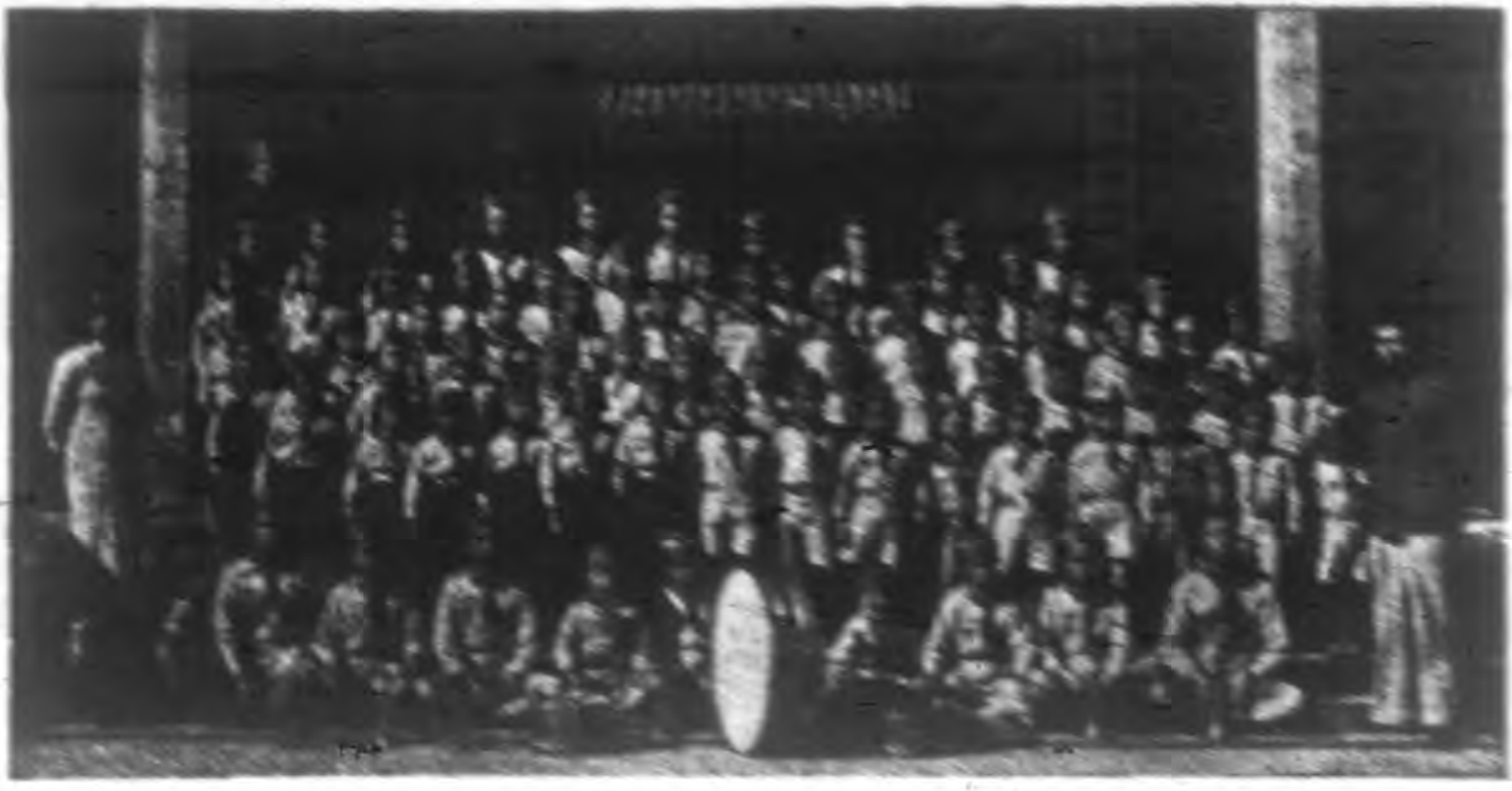
照合體全校學民國保口浦教夏