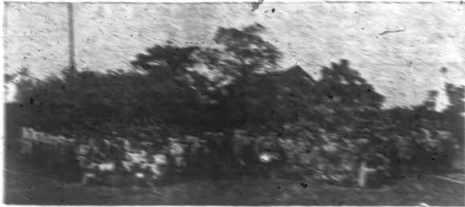
廣東省立第一師範學校園林一角