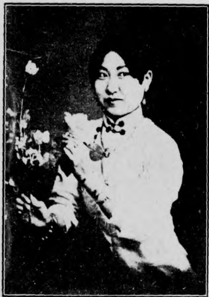
紅 桂 月