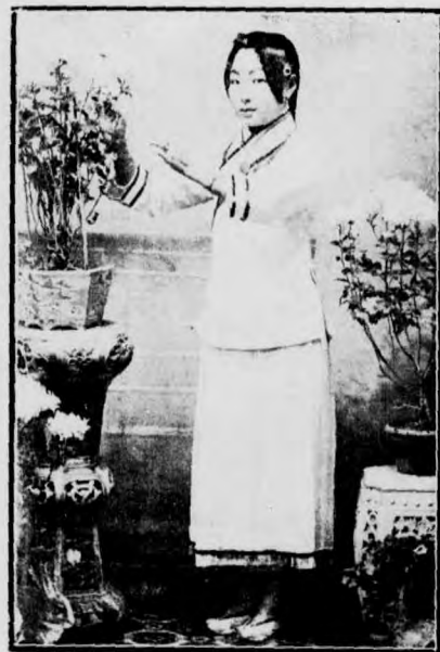
紅 裏 月