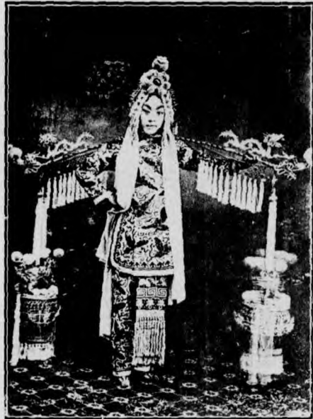
小 金 鈴