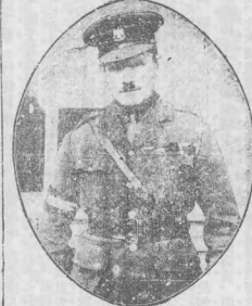
來電之安皇特使赴日大使出諾特親王