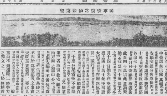
望遠頭頂之復恢軍閩