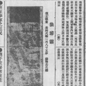
津浦鐵路即由南越渡