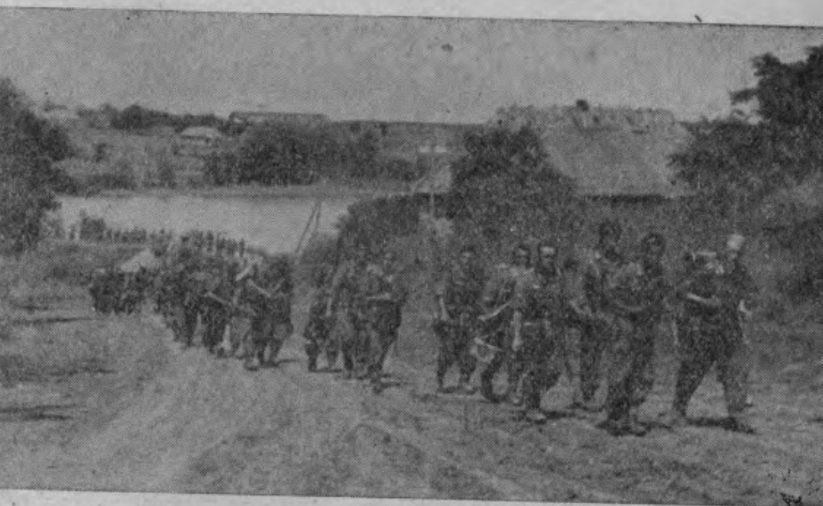
步兵佔領敵村後繼續搜索前進