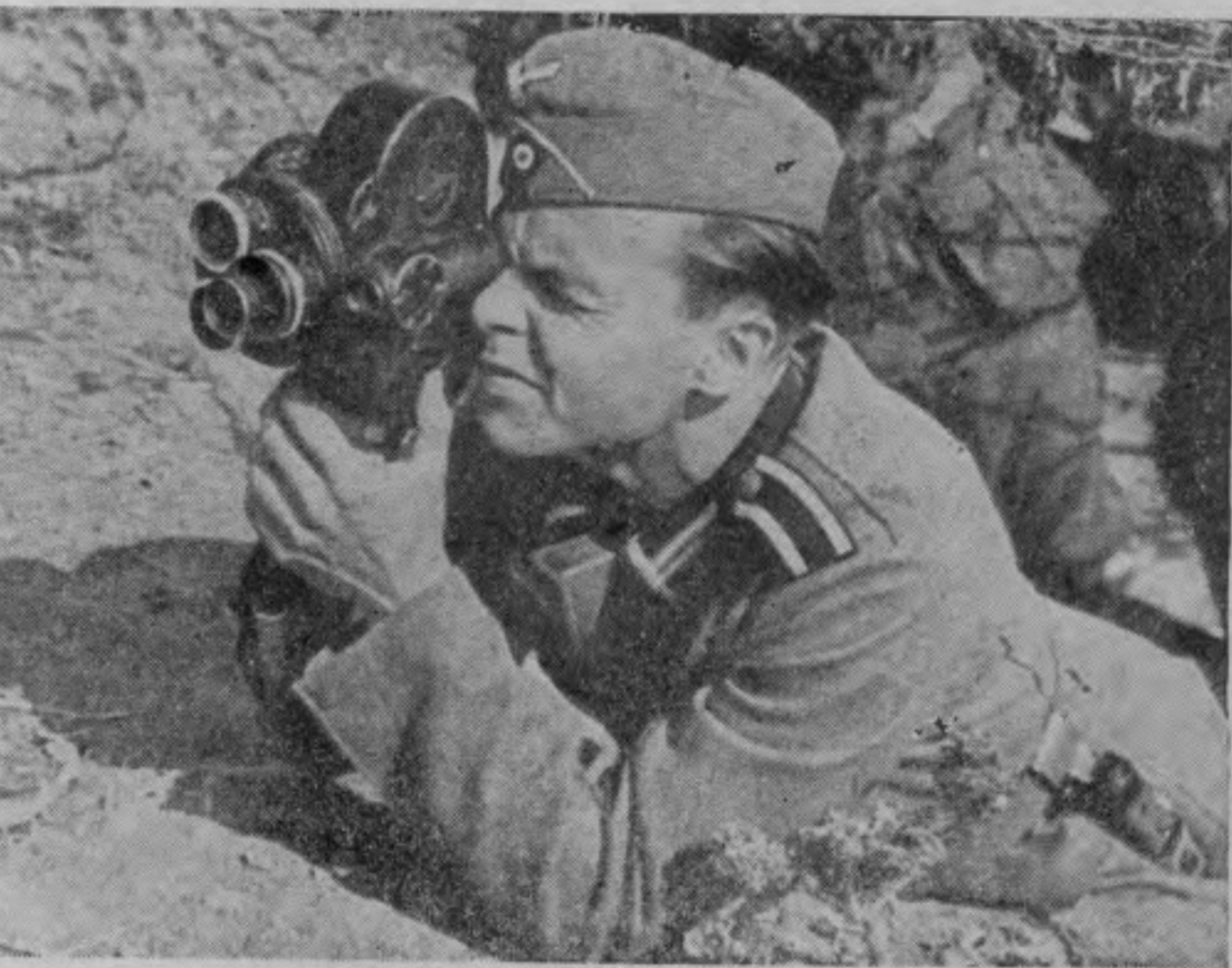
影電事戰攝在員道報地戰