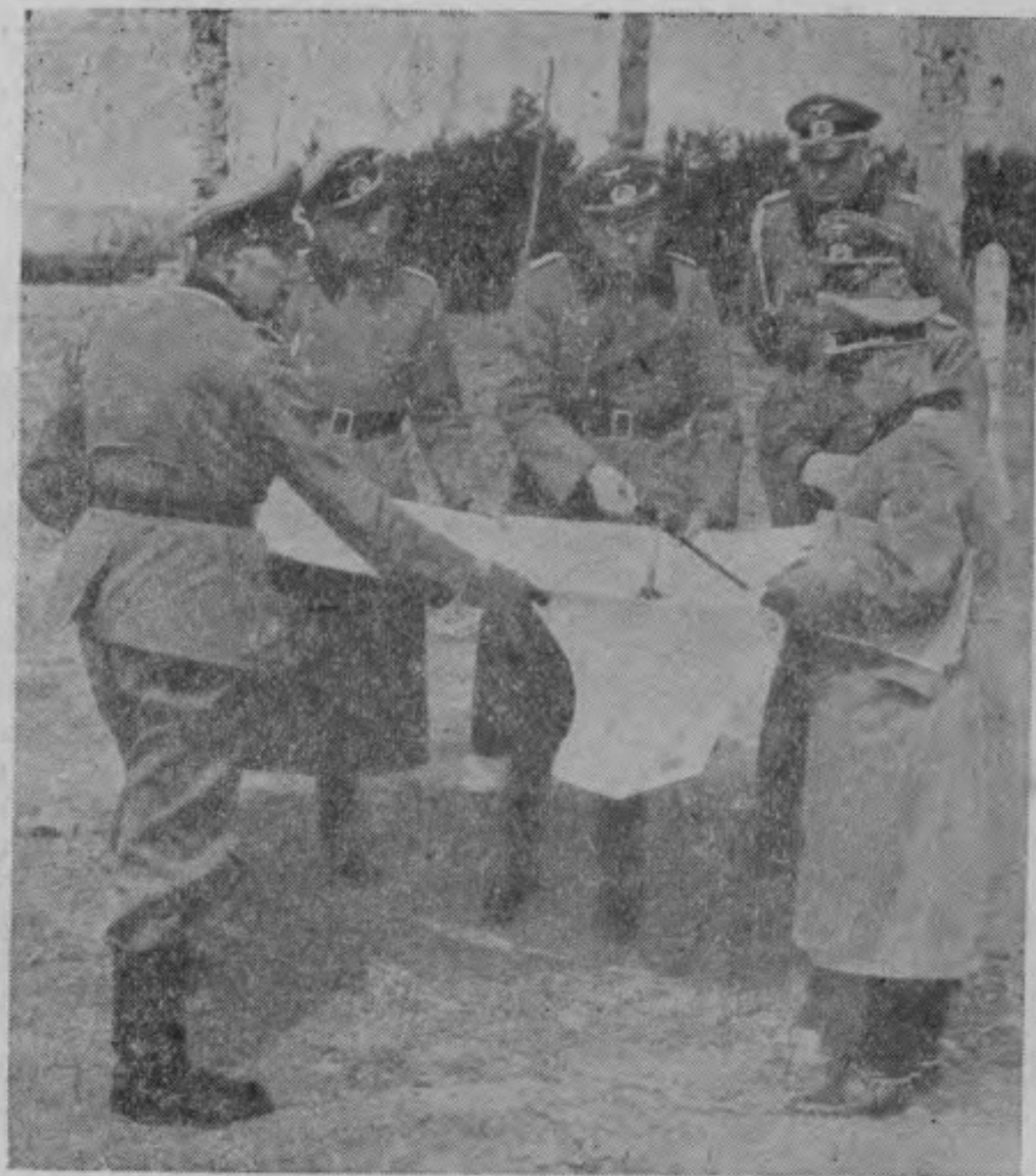
前敵司令參與謀人討論戰情