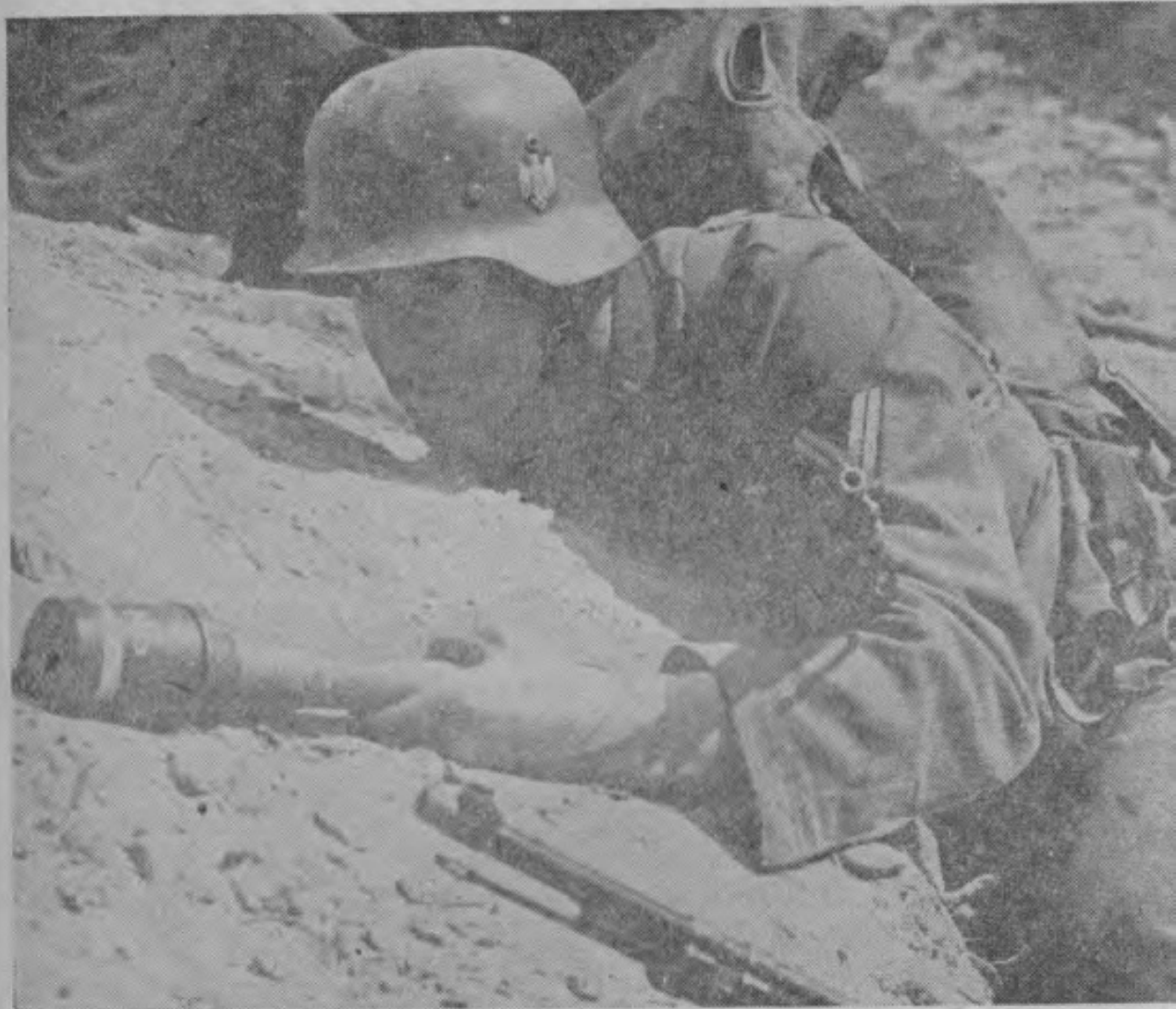
動而機待溝壕於隱彈榴手握緊