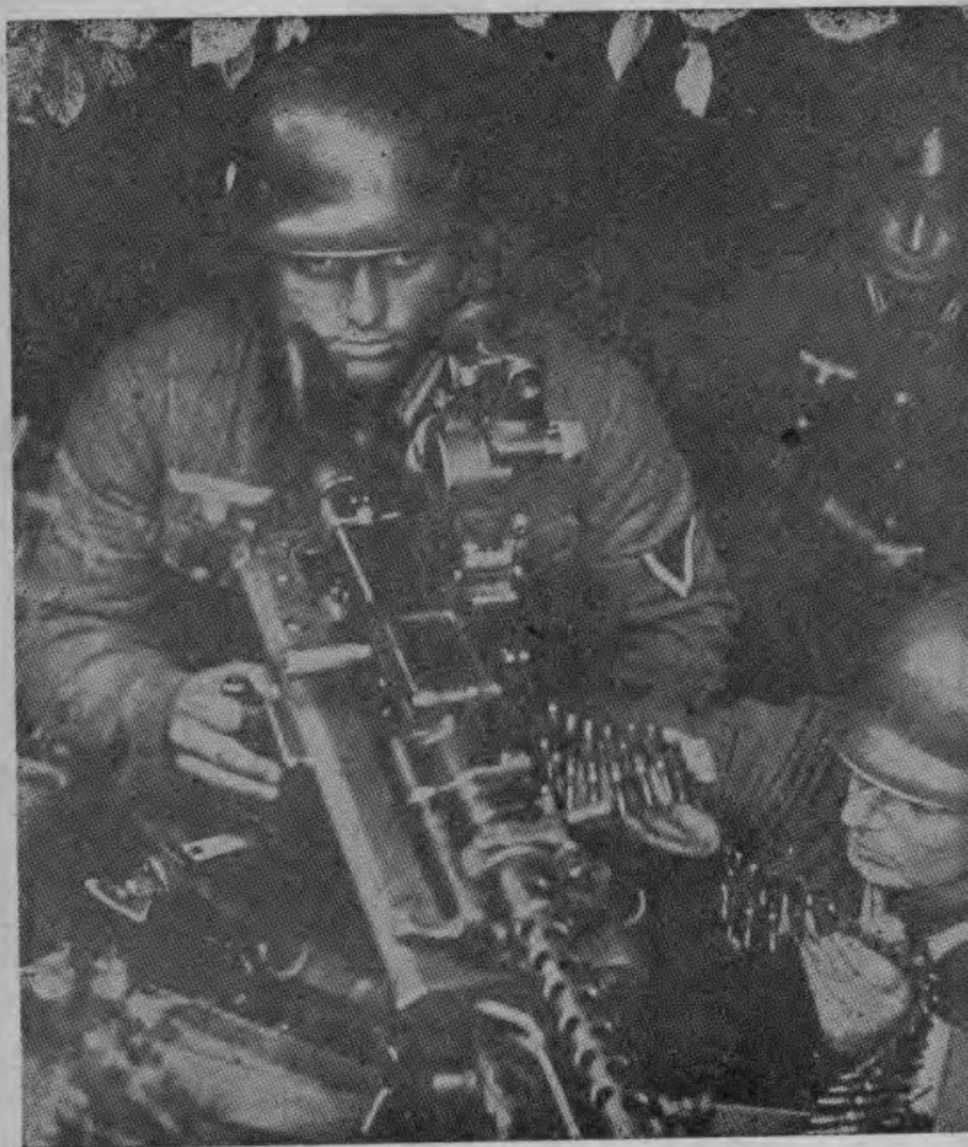
手槍關機的一切蔽掩在藏隱