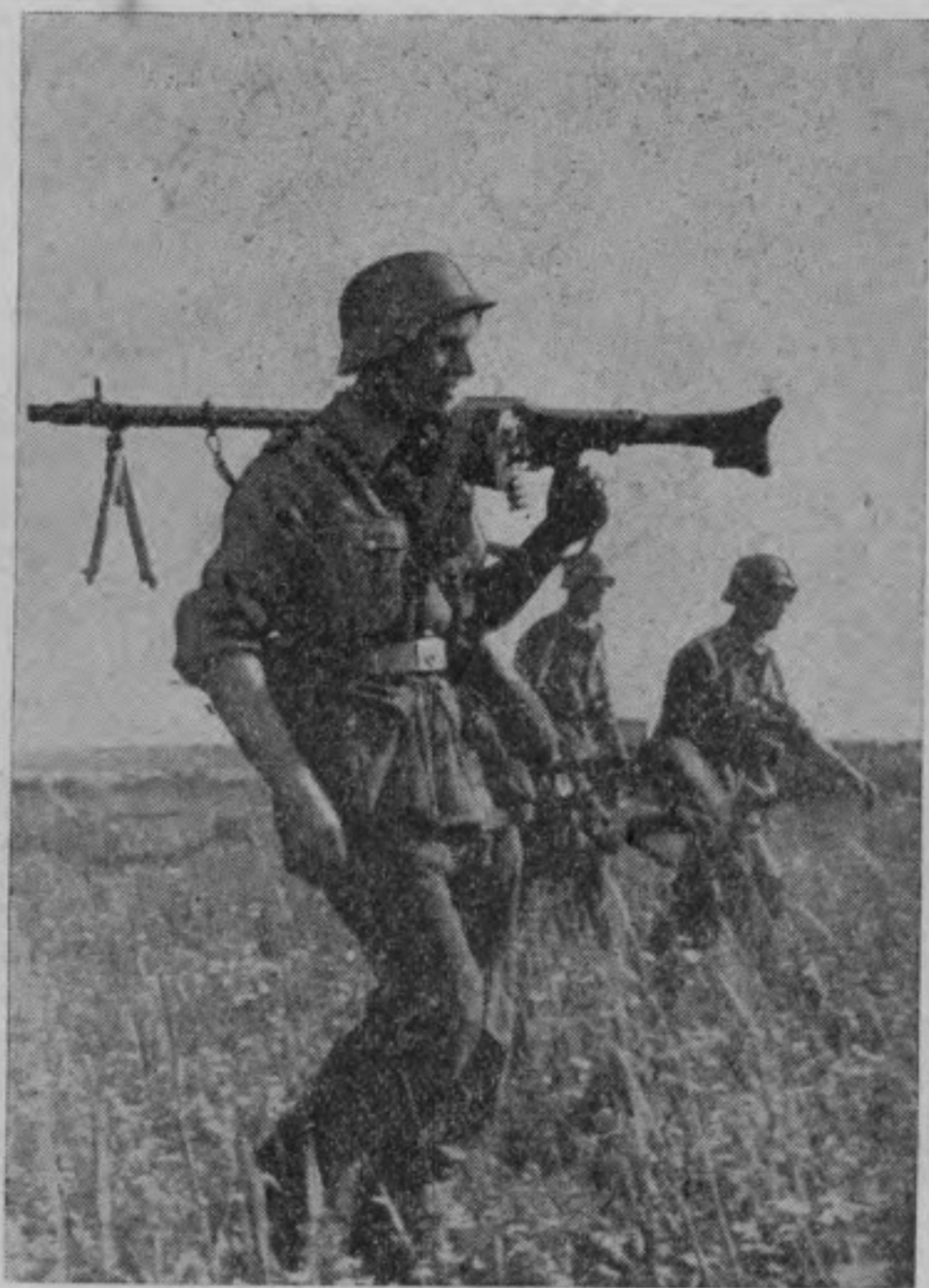
進挺前向槍關機輕或槍步帶携卒士