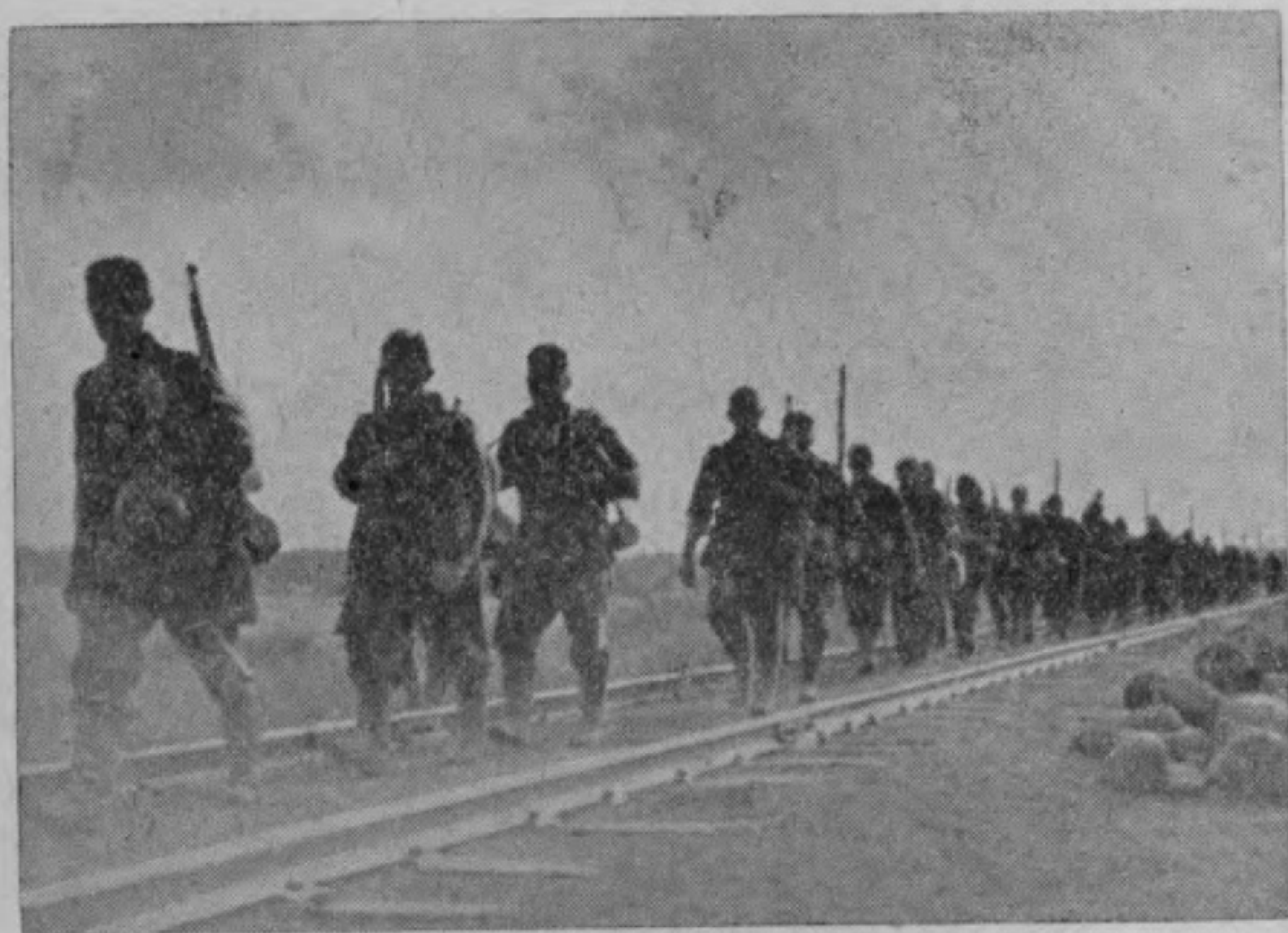
通 交 道 鐵 護 防 事 從