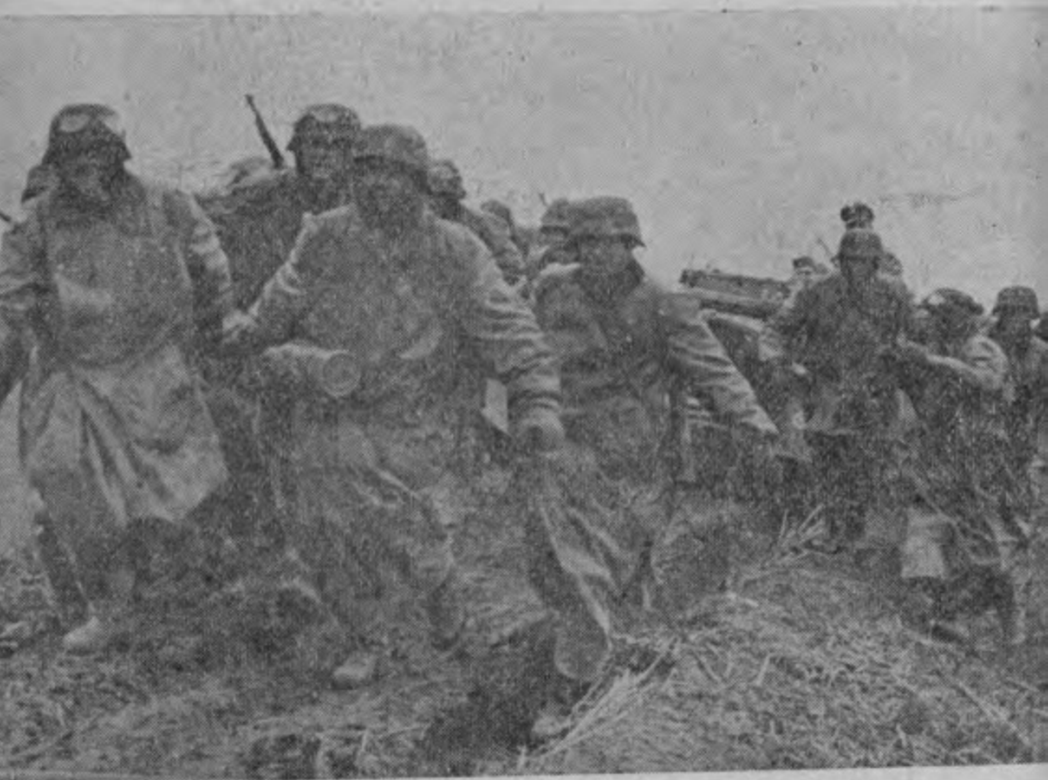
進前斷不中濘泥雨大在隊軍