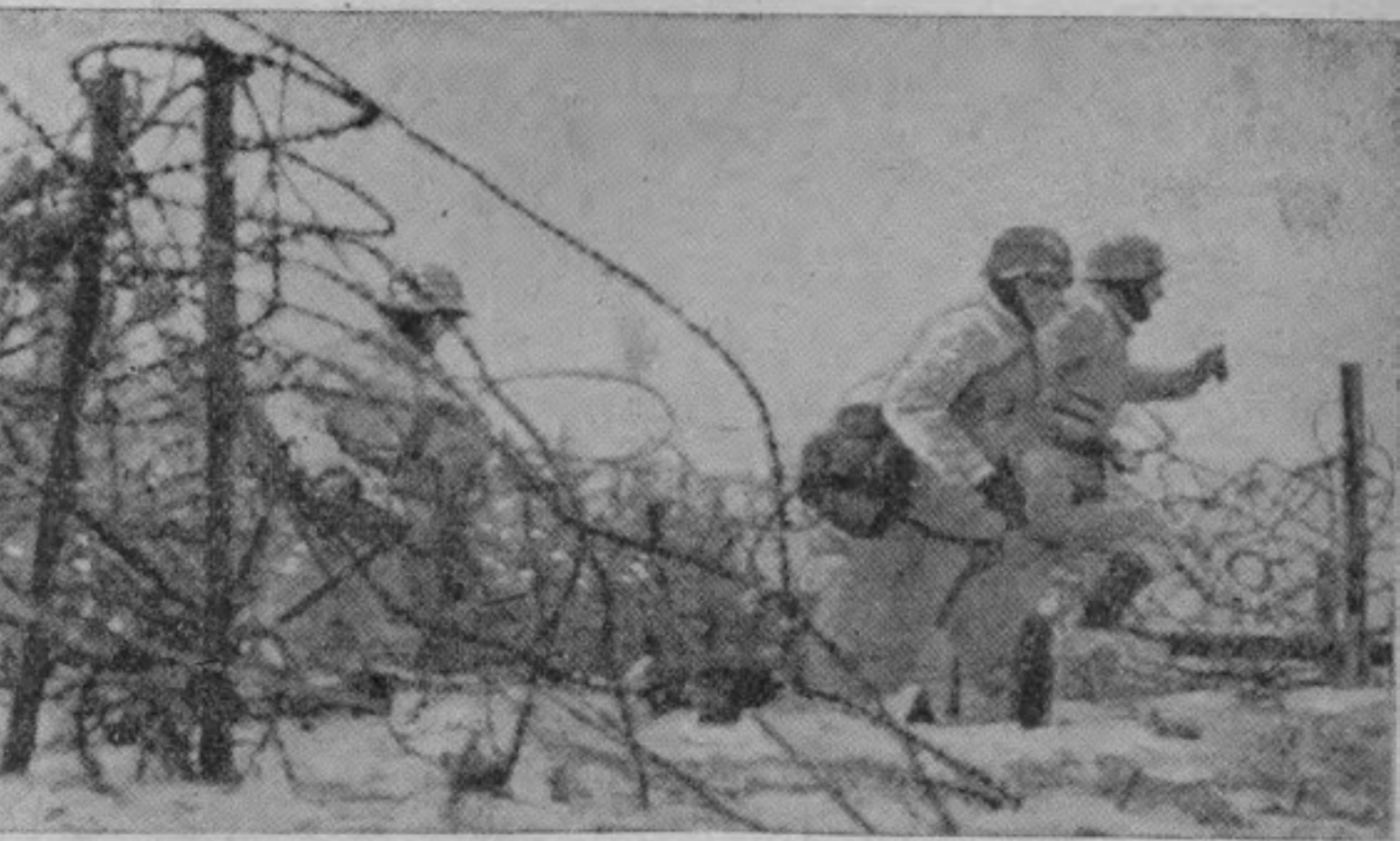
越過鐵絲網向敵方前進