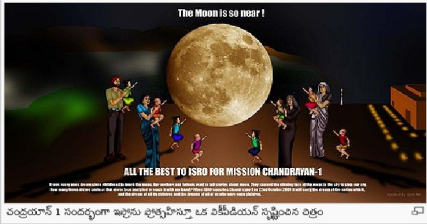
చంద్రయాన్ 1 సందర్భంగా ఇస్రోను ప్రోత్సహిస్తూ ఒక వికీసిద్ధియాన్ సృష్టించిన చిత్రం

చంద్రయాన్ 1 Chandrayaan I (శబ్దాలు-1), భారతీయ అంతరిక్ష పరిశోధనా సంస్థ (ఇస్రో) చేపట్టిన మానవ రహిత చంద్రయాన కార్యక్రమము. ఈ మిషన్ లో, లూనార్ ఆర్బిటర్ మరియు ఇంపాక్టర్ పున్నాయి. పోలార్ శాటిలైట్ లాంఛ్ వెహికల్ చే, ఈ నౌక ప్రయోగించబడింది.