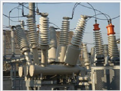
ఎలెక్ట్రికల్ ఇంజనీర్లు సంక్లిష్టమైన విద్యుత్ వ్యవస్థలతో పనిచేస్తారు

ఎలక్ట్రికల్ ఇంజనీరింగ్ ఎలెక్ట్రీసిటీ, ఎలెక్ట్రానిక్స్ మరియు ఎలెక్ట్రోమాగ్నెటిజమ్ విషయాలకు సంబంధించిన అధ్యయనమే ఎలెక్ట్రికల్ ఇంజనీరింగ్ . పందొమ్మిదవ శతాబ్దం చివరి దశలో ఎలెక్ట్రికల్ టెలిగ్రాఫ్ మరియు విద్యుత్ శక్తి సరఫరా వాణిజ్యపరంగా ప్రారంభంతో ఇది ప్రత్యేక వృత్తిగా గుర్తింపు పొందింది. దీనిలో పవర్, ఎలెక్ట్రానిక్స్, కంట్రోల్ సిస్టమ్స్, సిగ్నల్ ఫ్రాసిసింగ్ మరియు