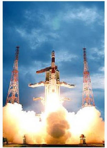
Chandrayaan-1 lifts off on the PSLV-C11