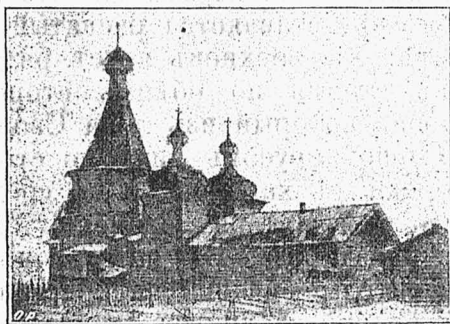
Благовѣщенскій Храмъ. въ с. Турчасовъ Онежскаго у., Архангельской губ.

Преображенскій храмъ трехъ престольный: главный въ честь Преображенія Господня (празднов. 6 августа). а придѣльные: 1) въ честь Усѣкновенія Главы Іоанна Предтечи (праздн. 29 авг.) и 2) во имя св. Николая Чудотв. (праздн. 9 мая и 6 декабря). Означенный храмъ построенъ, какъ видно изъ описанія 1848 г. крестообразно; высота его 22 сажен., длина 11 сажен. ширина тоже 11 сажен. Церковная стопа увѣнчана куполомъ и пятью главами, изъ коихъ на четырехъ осмиконечныя кресты, а на пятой четвероконечный; по четыремъ крыламъ ея поставлены также четыре небольшихъ купола, съ главами и крестами, изъ коихъ надъ алтарный куполь совмѣщаетъ въ себѣ три сердца, или правильнѣе славянскую двойную букву: Отъ .