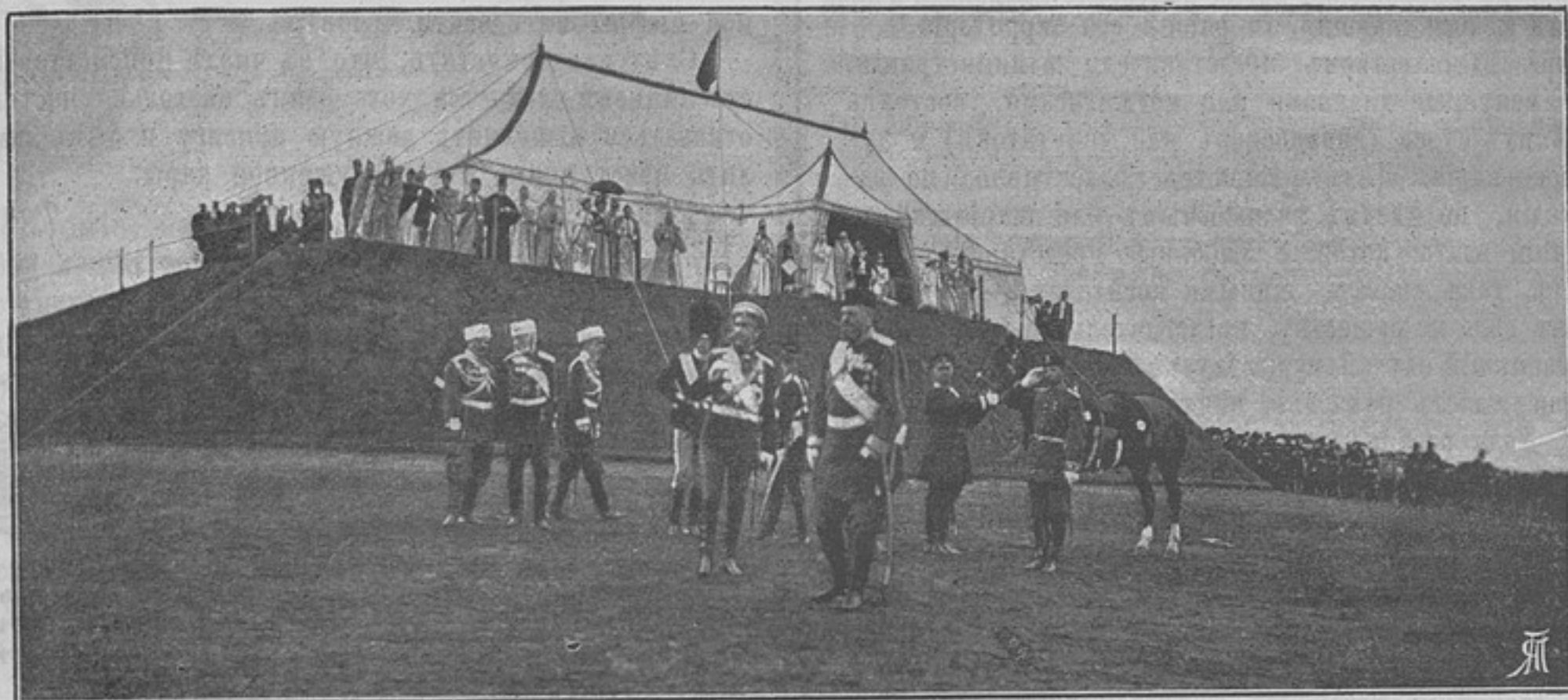
Его Императорское Величество, по окончаніи парада, сходить съ коня.

— Довольны вы рѣшеніемъ?—спросилъ предсѣдатель и, получивъ утвердительный отвѣтъ, отпустилъ стороны.—Слѣдующихъ,—произнесъ онъ, раскрывая очередное дѣло.