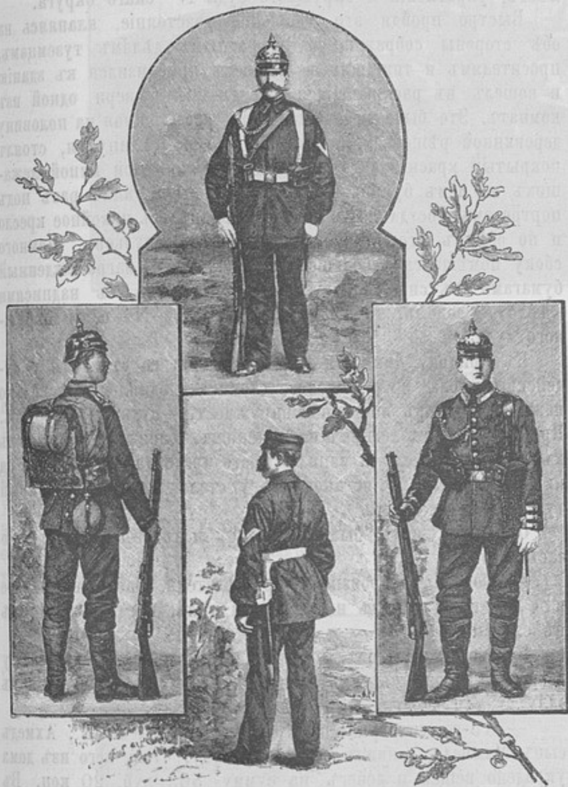
Новое обмундированіе нѣмецкой пѣхоты.

На прилагаемомъ рисункѣ показано выданное уже на испытаніе въ нѣкоторыя пѣхотныя части новое обмундированіе. Боковыя фигуры изображаютъ унтеръ-офицера гренадерскаго, имени Императора Александра, полка въ Берлинѣ. Покрой мундира остается прежній, и существенно измѣненъ только воротникъ, который, вмѣсто стоячаго, замѣненъ отложнымъ, одинаковаго съ мундиромъ сукна. Сверху воротника нашиты бѣлые шерстяные, гвардейскіе клапаны и, кромѣ того, золотой унтеръ-офицерскій галузъ. Въ дурную погоду, морозъ