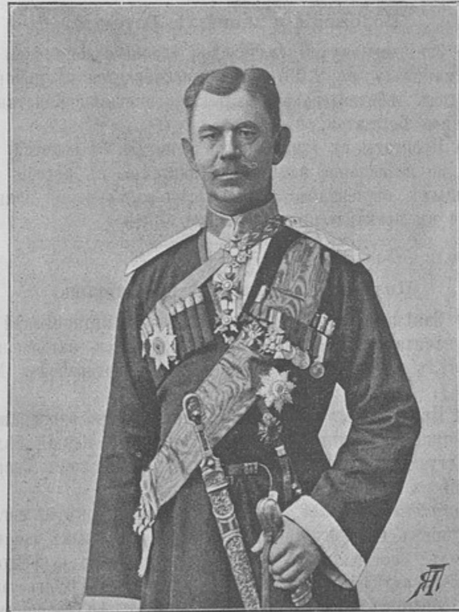
Командиръ Терской казачьей бригады, генералъ-маіоръ Сергѣй Николаевичъ ПАНИНЪ. Родился въ 1834 г. Воспитывался въ Ярославской губерни-