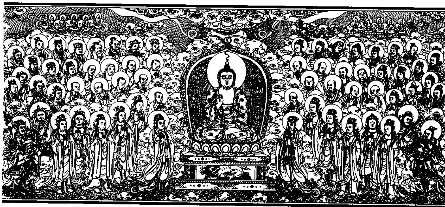
清刻龍藏佛說法變相圖