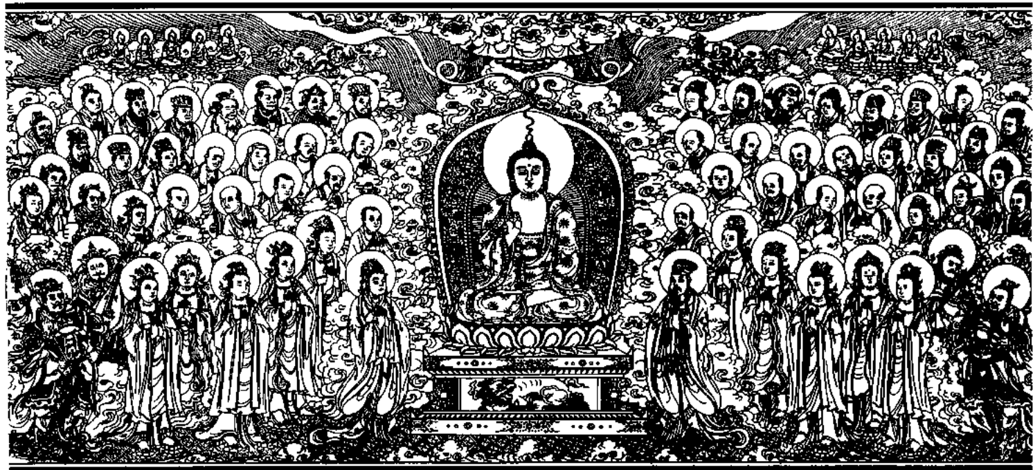
清刻龍藏佛說法變相圖