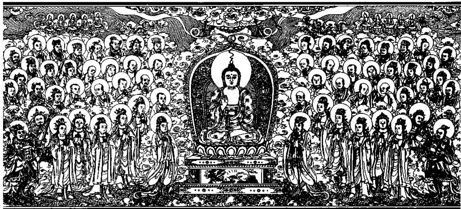
清刻龍藏佛說法變相圖