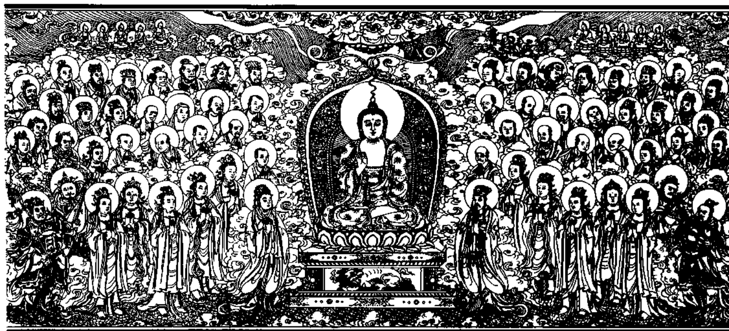
清刻龍藏佛說法變相圖