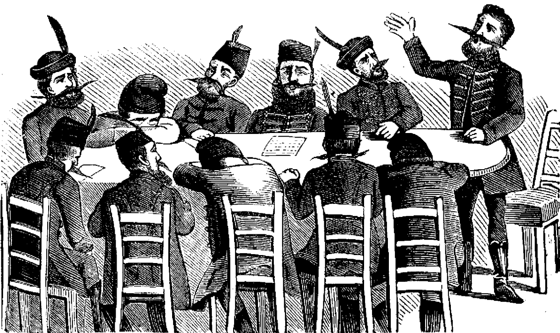
In adunarea comitatensă.

Proprietariu, redactoru respunditoriu si editoru: Iosifu Vulcauu.