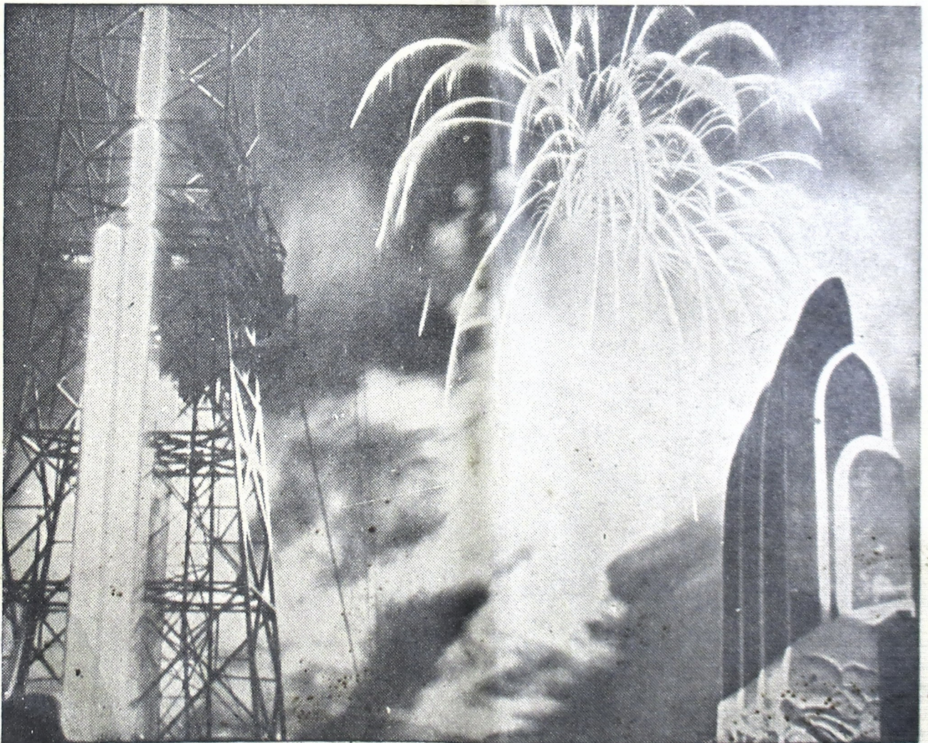
ပုံစံ ၅၇ ဇွဲ ဗျာဗျာ စာပေတိုက်မှ ဖြန့်ချိ Chicago