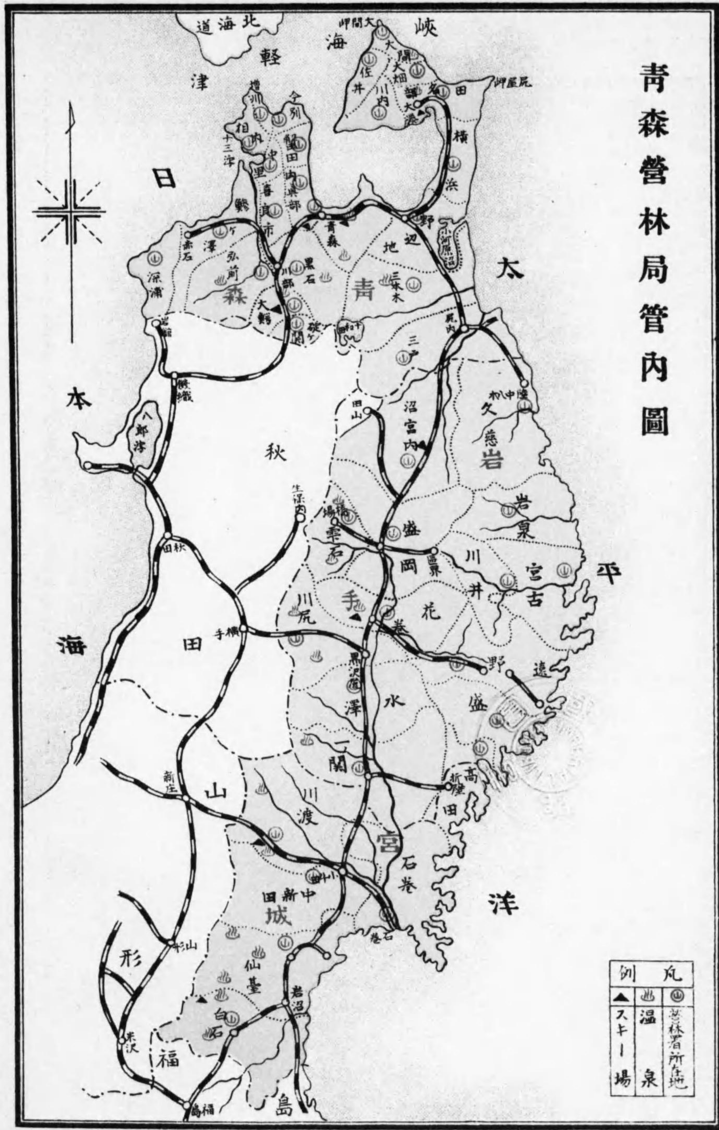
青森營林局管內圖