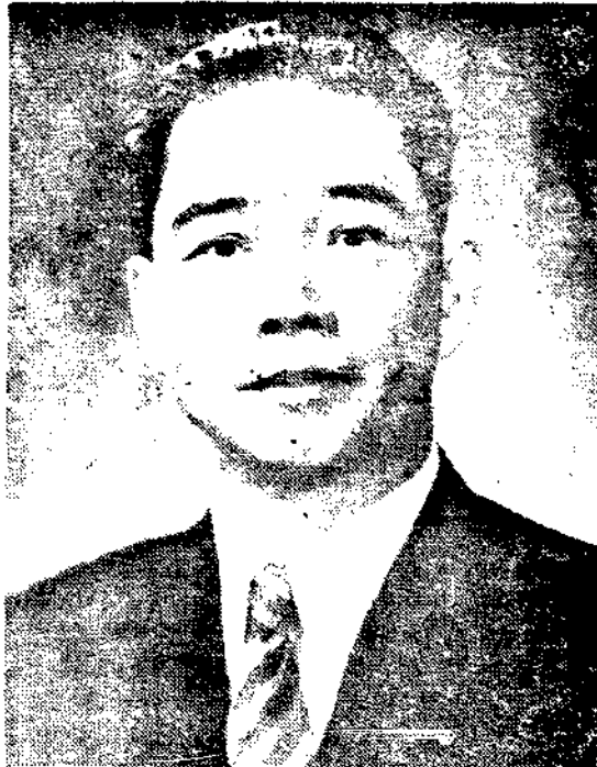
汪 主 席

第三、我們為什麼不能實行民生主義呢？因為我們忽略了發達國家資本，我們如能着重於此點，則國家資本發達，私人資本自然歸於節制，共匪則無所藉口以故吹階級鬥爭，英美之經濟侵略，亦無所施其技，何致演成共匪與英美侵略互相呼應的著重點。