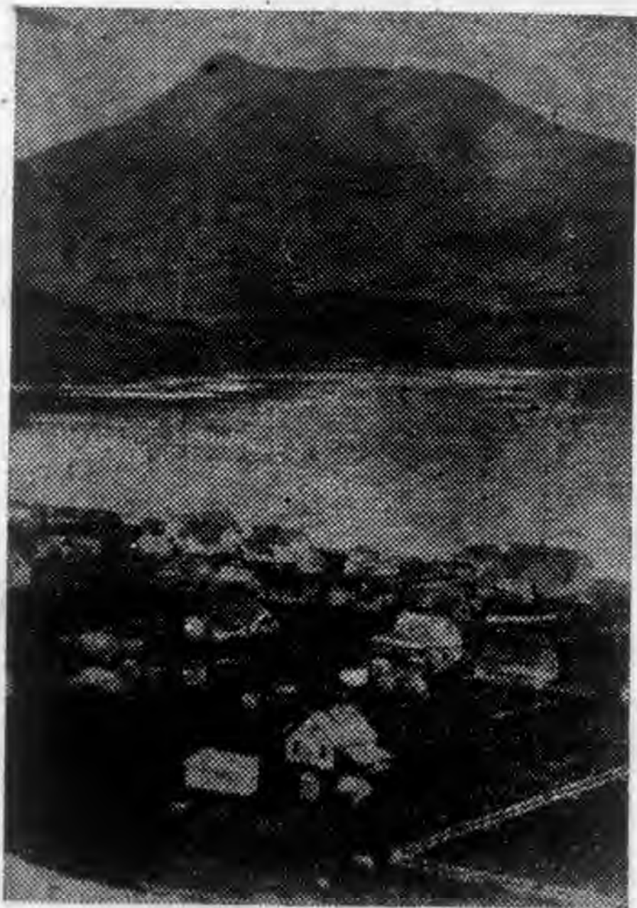
日軍急襲之下荷蘭港