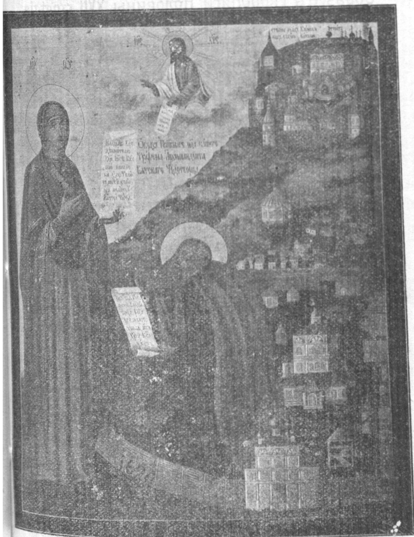
Преп. Трифонъ на молитвѣ за свой монастырь и градъ Хлыновъ.

Фотографическій снимокъ съ иконы, находящейся въ Вятскомъ женскомъ Преображенскомъ монастырѣ, а эта по- слѣдняя представляетъ копию съ древней иконы (XVII в.) на- ходящейся въ Вятскомъ Трифоновомъ монастырѣ, уже реста- вированной въ 1905 г.