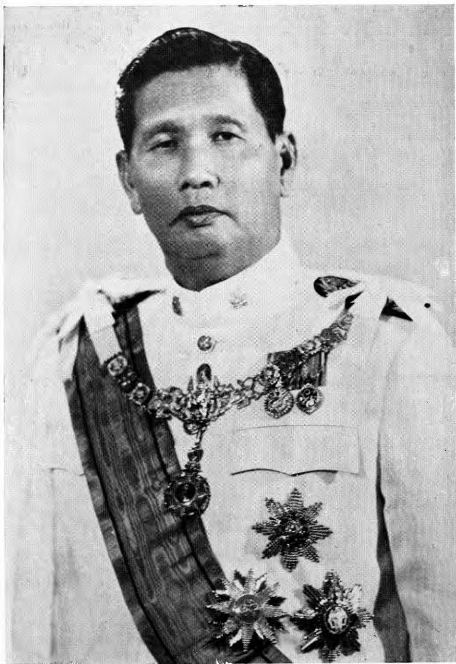
จอมพล สฤษดิ์ ธนะรัชต์ นายกรัฐมนตรี