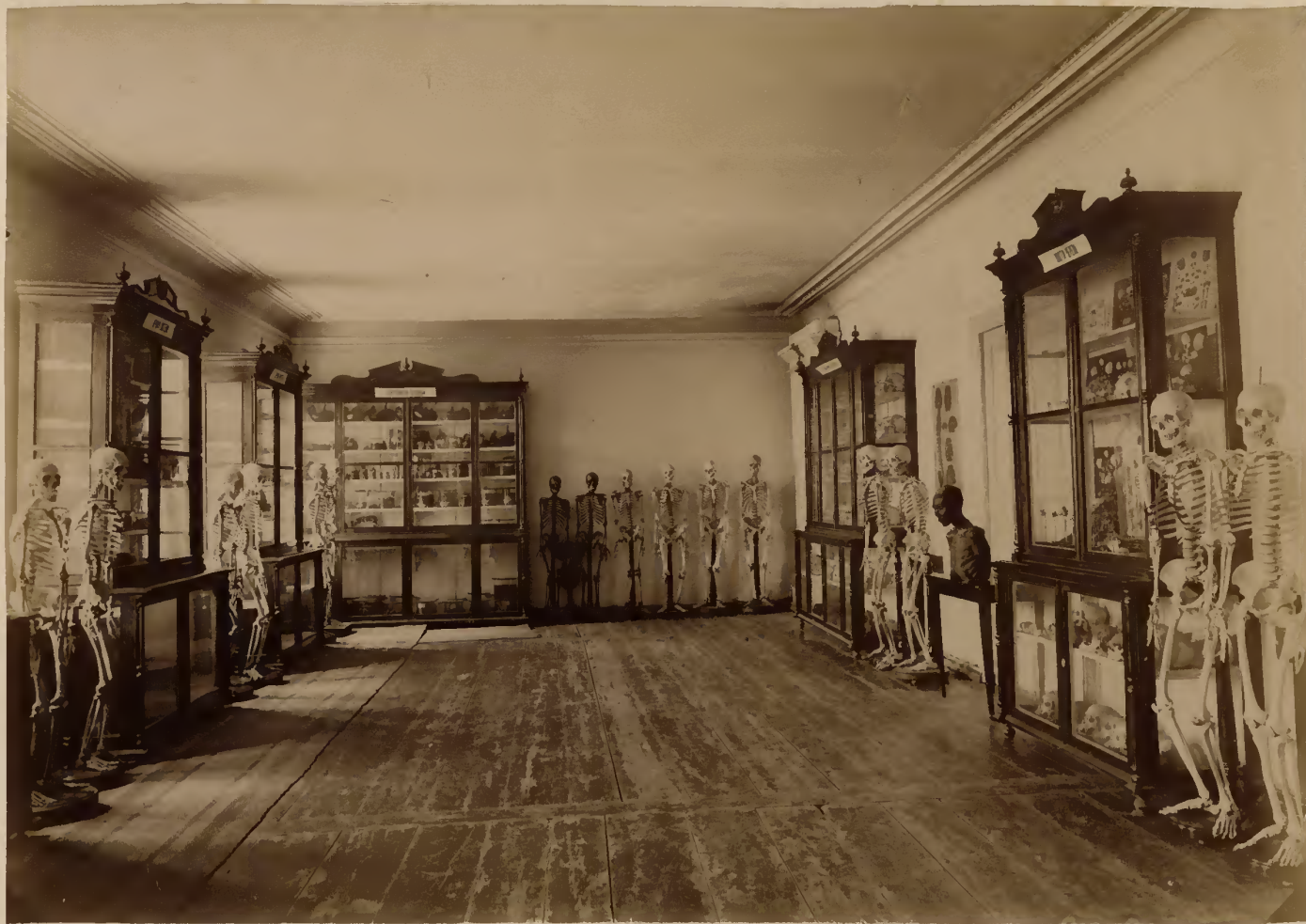
а) Часть анатомического музея.