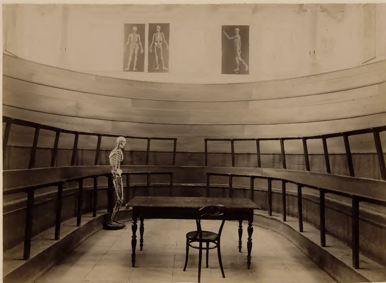
б) Часть амфитеатра двухсвѣтной анатомической аудитории.