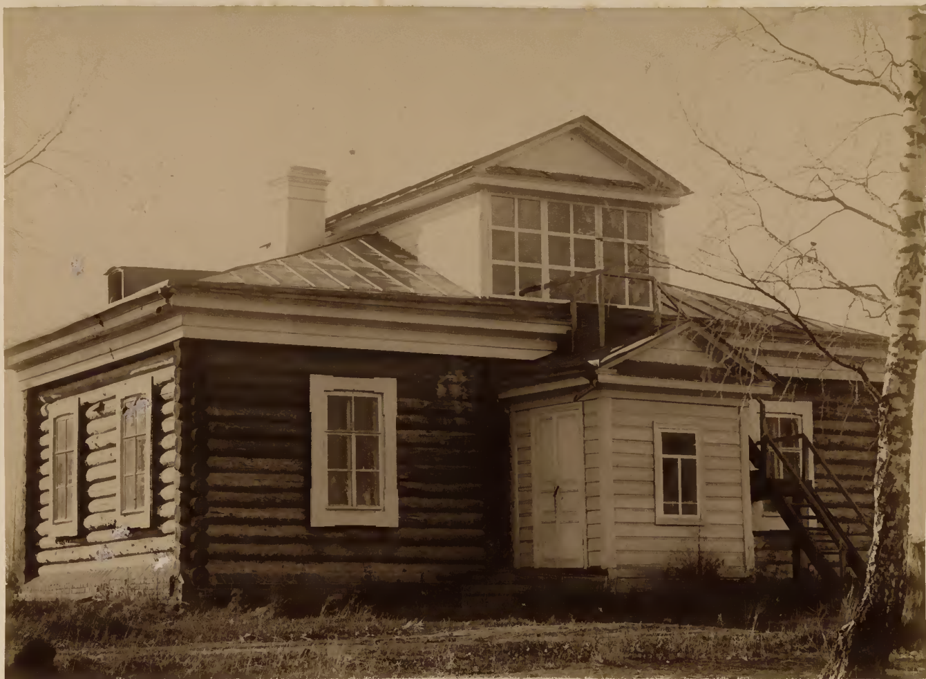
а) Домъ для черныхъ анатомическихъ работъ и мацераций.