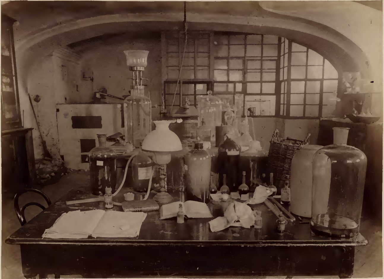
а) Химическая лабораторія.