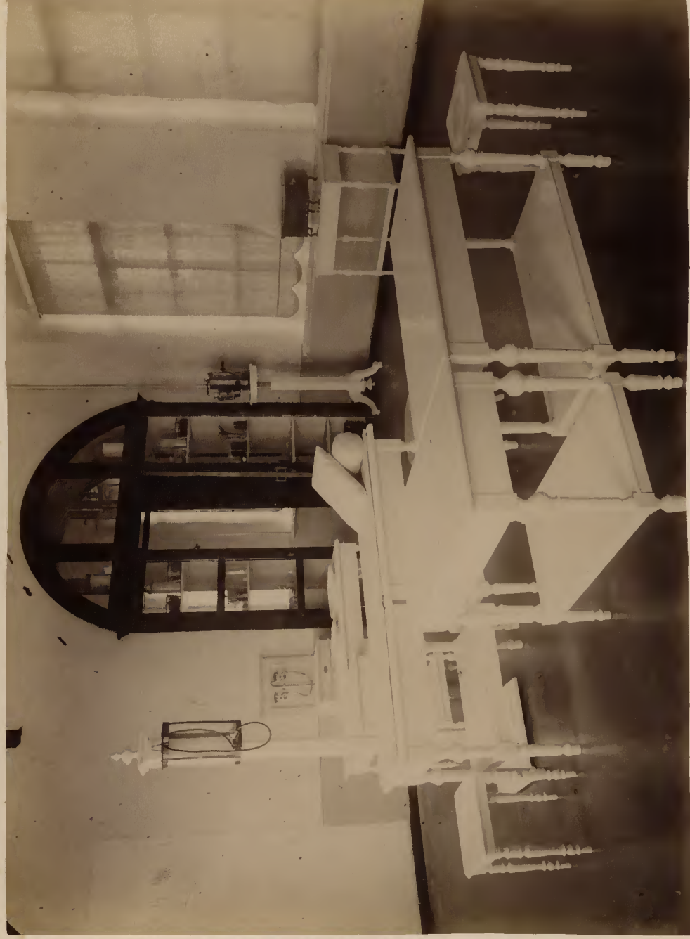
а) Операціонний залъ гинекологической клиники.