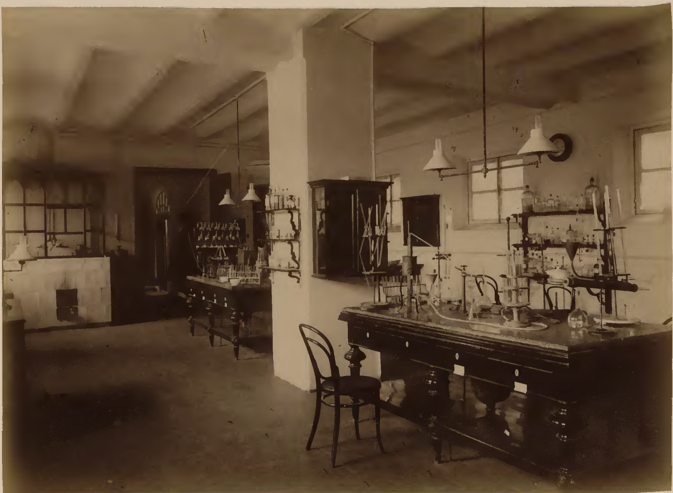
б) Диагностическая лаборатория.