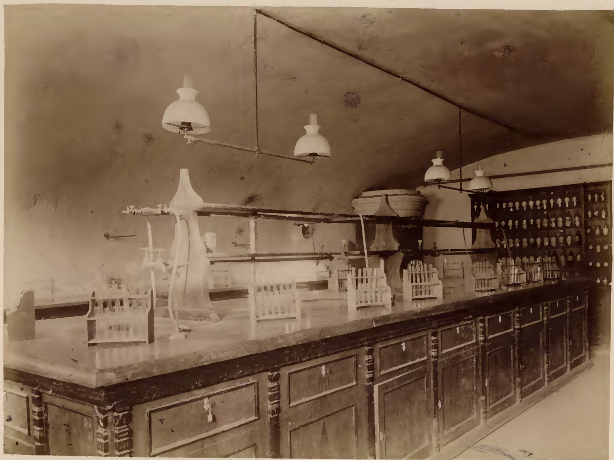
б) Часть химической лабораторіи.