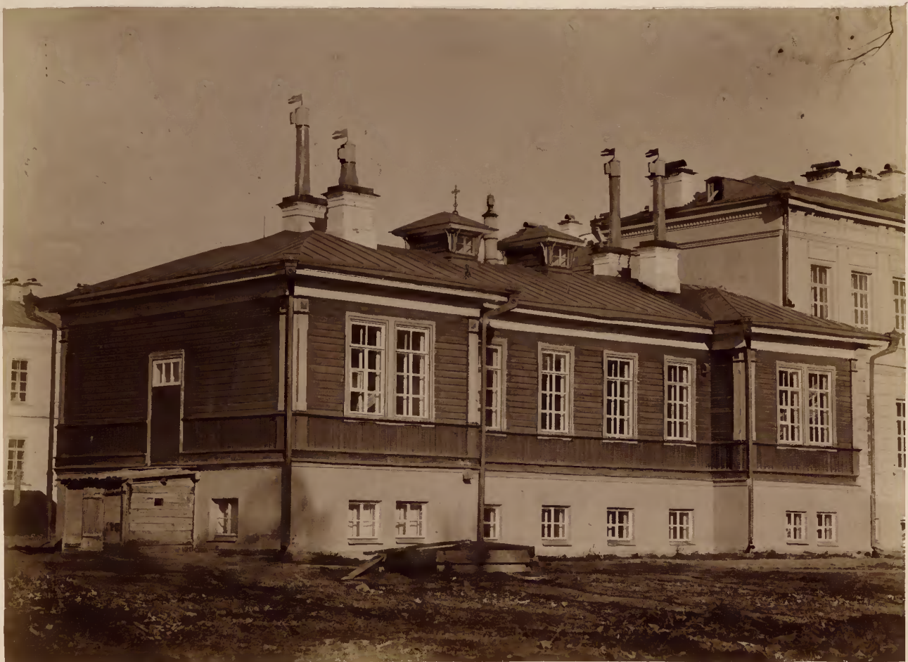
б) Акушерскій павильонъ.