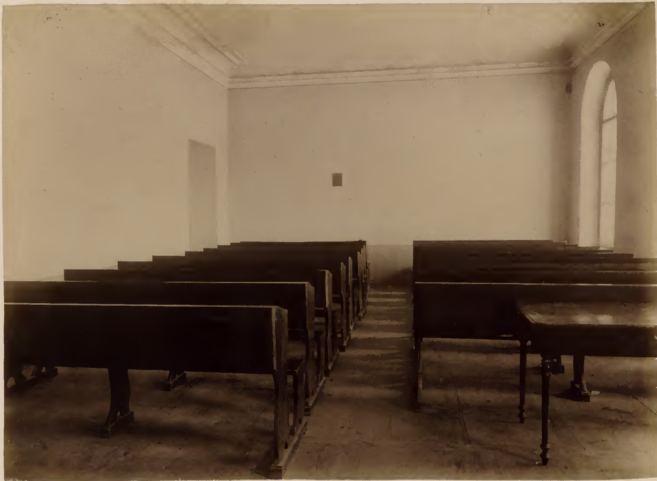
а) Третья аудиторія въ главномъ университетскомъ корпусѣ.