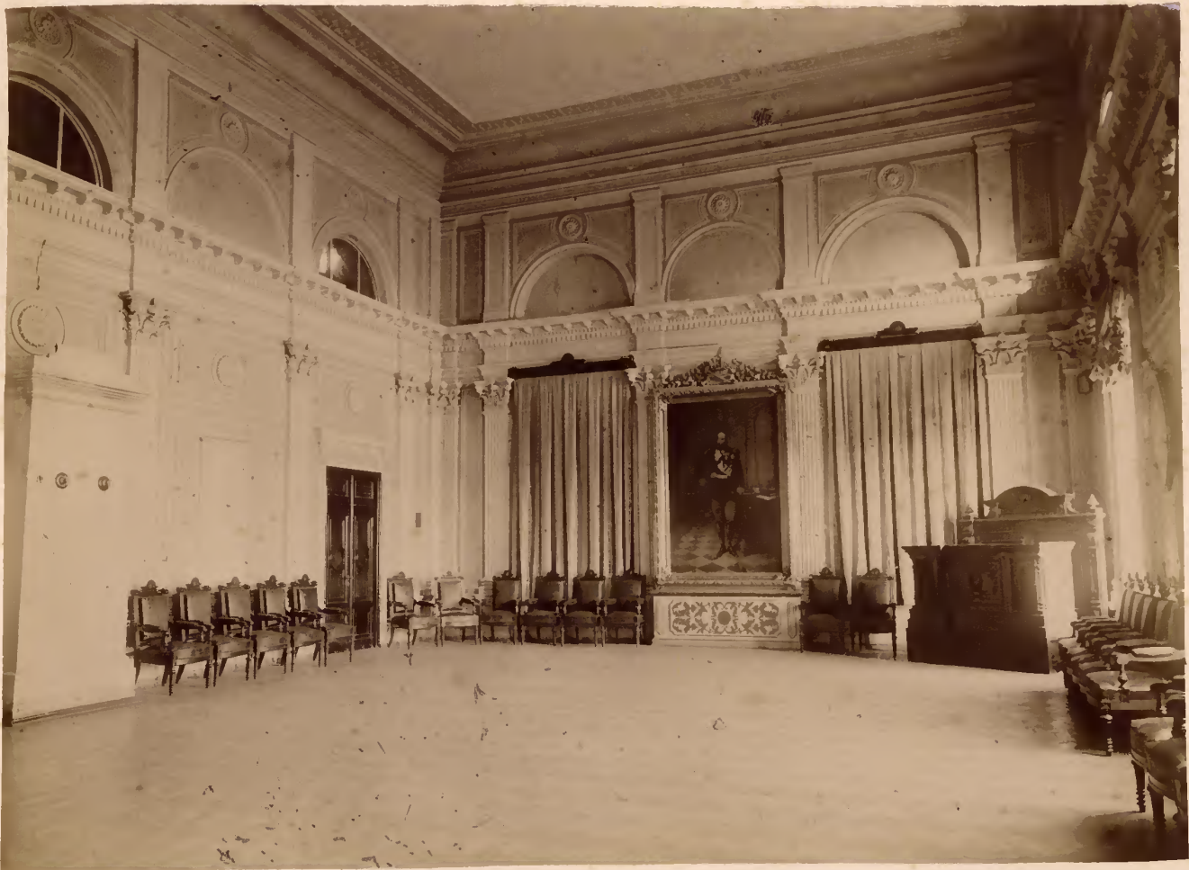
б) Северная часть актового зала.