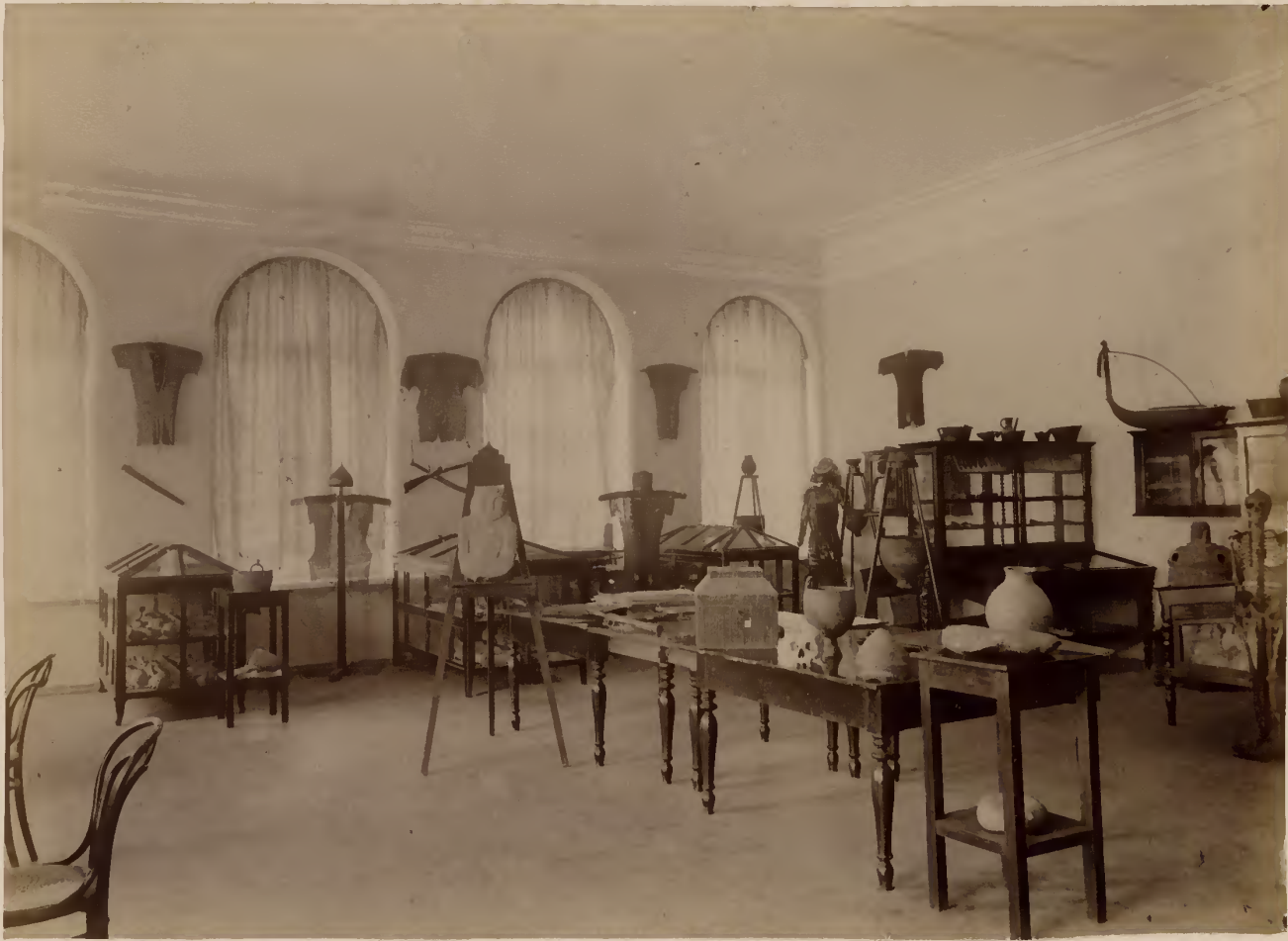
а) Часть археологического музея.