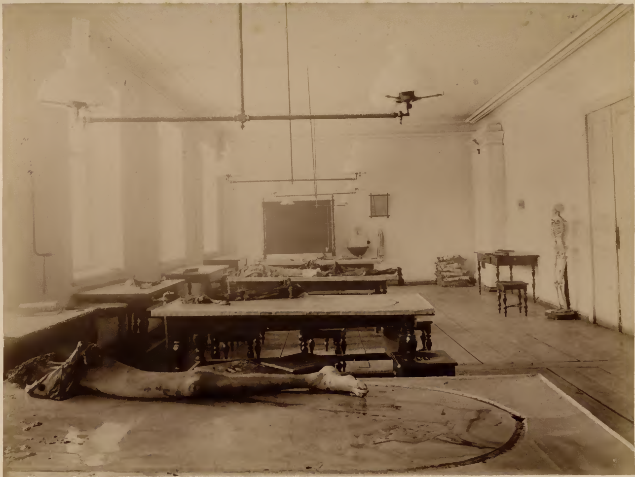
а) Секционный зал анатомического корпуса.