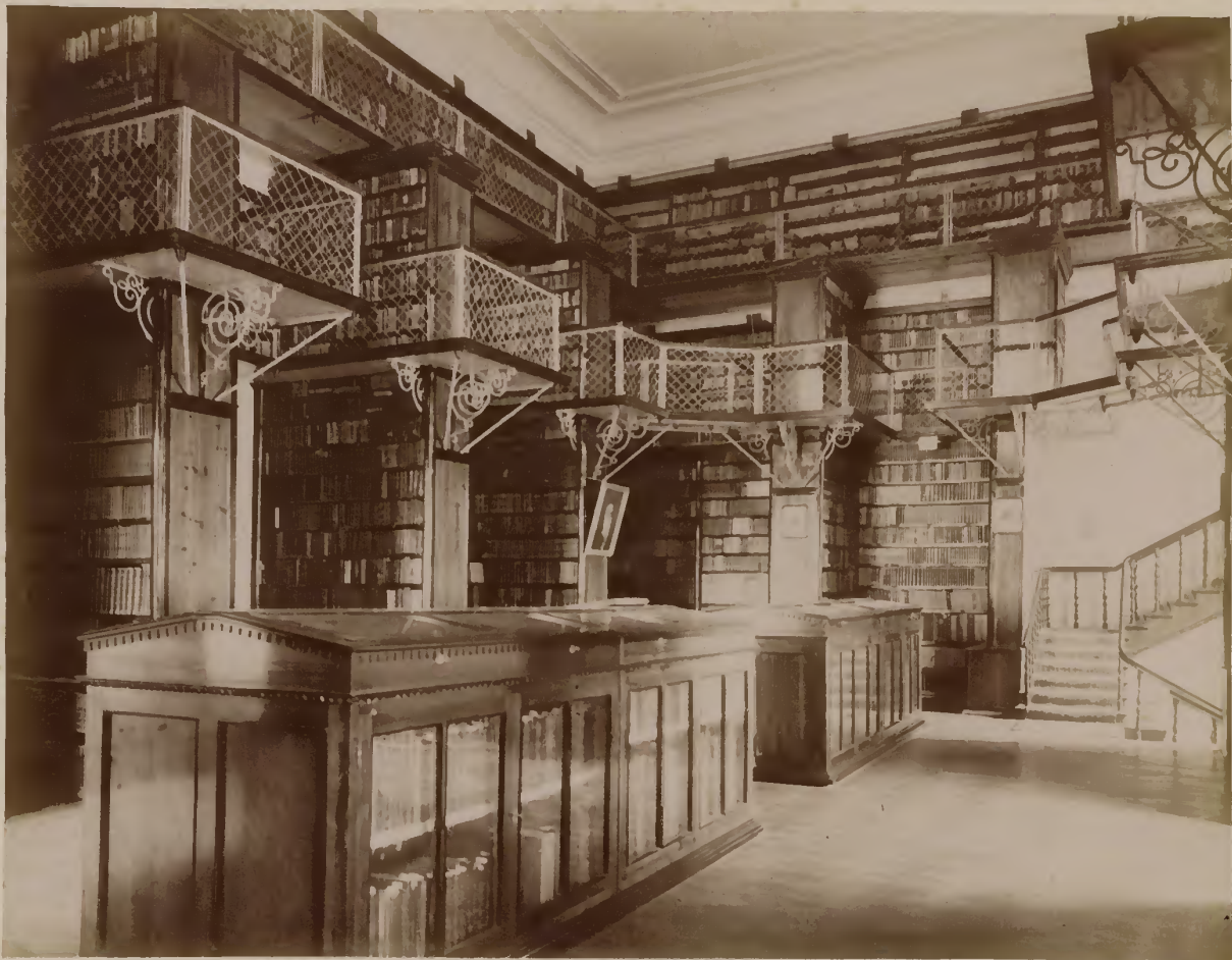
а) Сѣверо-восточная часть главнаго зала университетской библіотеки, съ двумя ярусами галлерей.