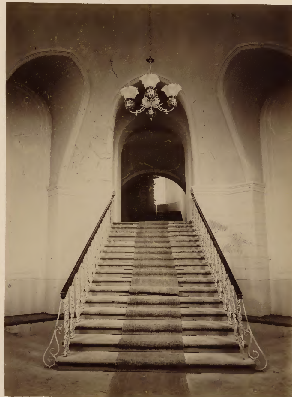
б) Часть парадной клинической лѣстницы.