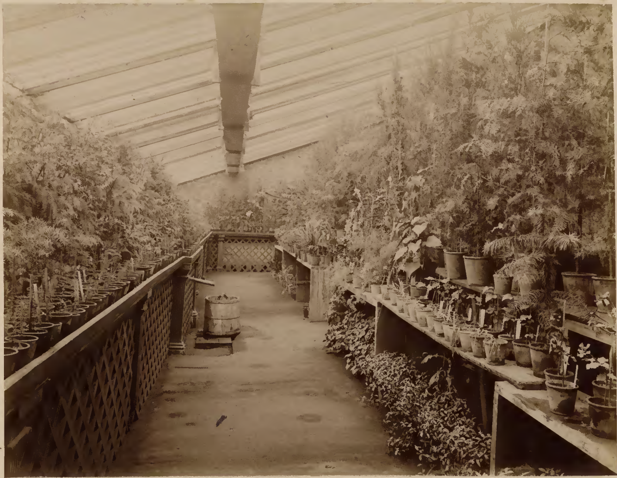
Внутренний вид оранжерей: б) Хвойное отделение.