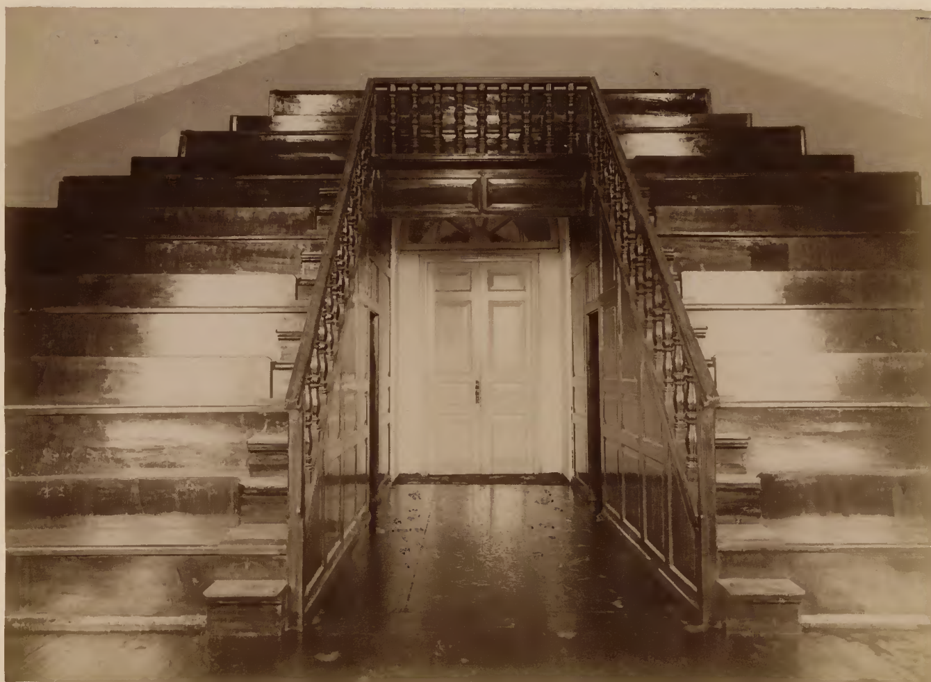
б) Амфитеатр большой клинической аудитории.