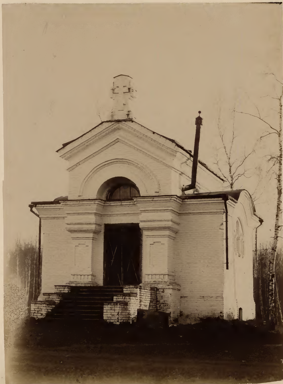
б) Часовня при анатомическомъ институтѣ.