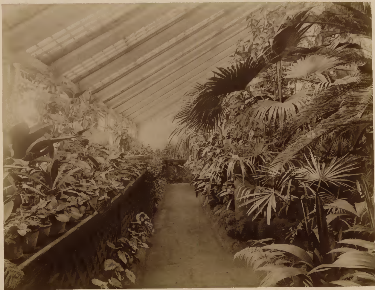
Внутренний вид оранжерей: а) Тропическое отделение.