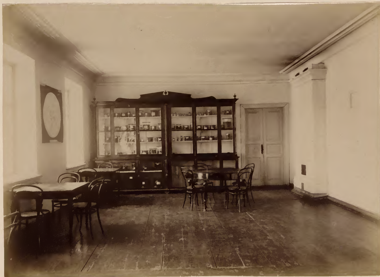
б) Кабинетъ патологической анатоміи.