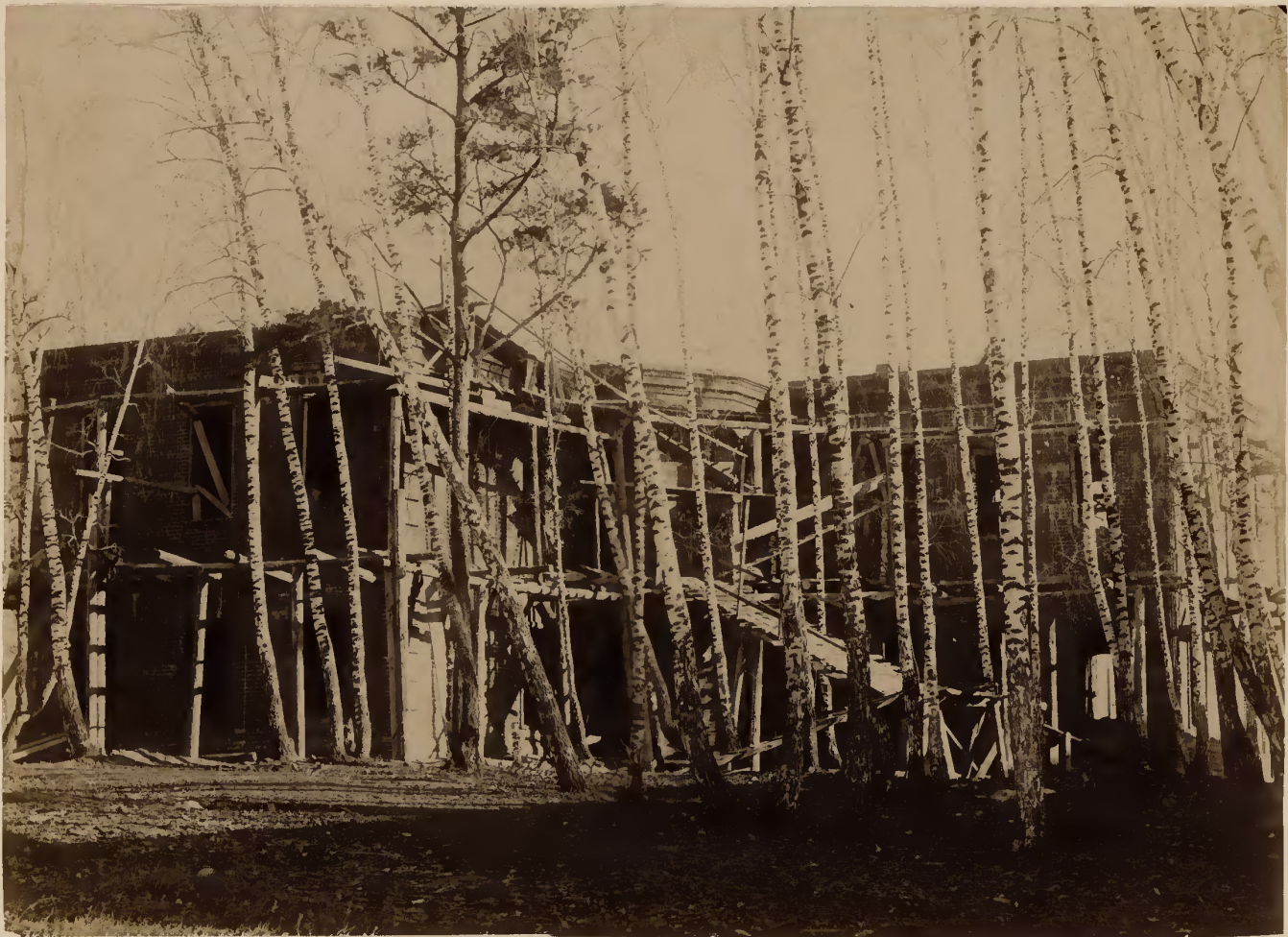
б) Онъ же съ задняго фасада.