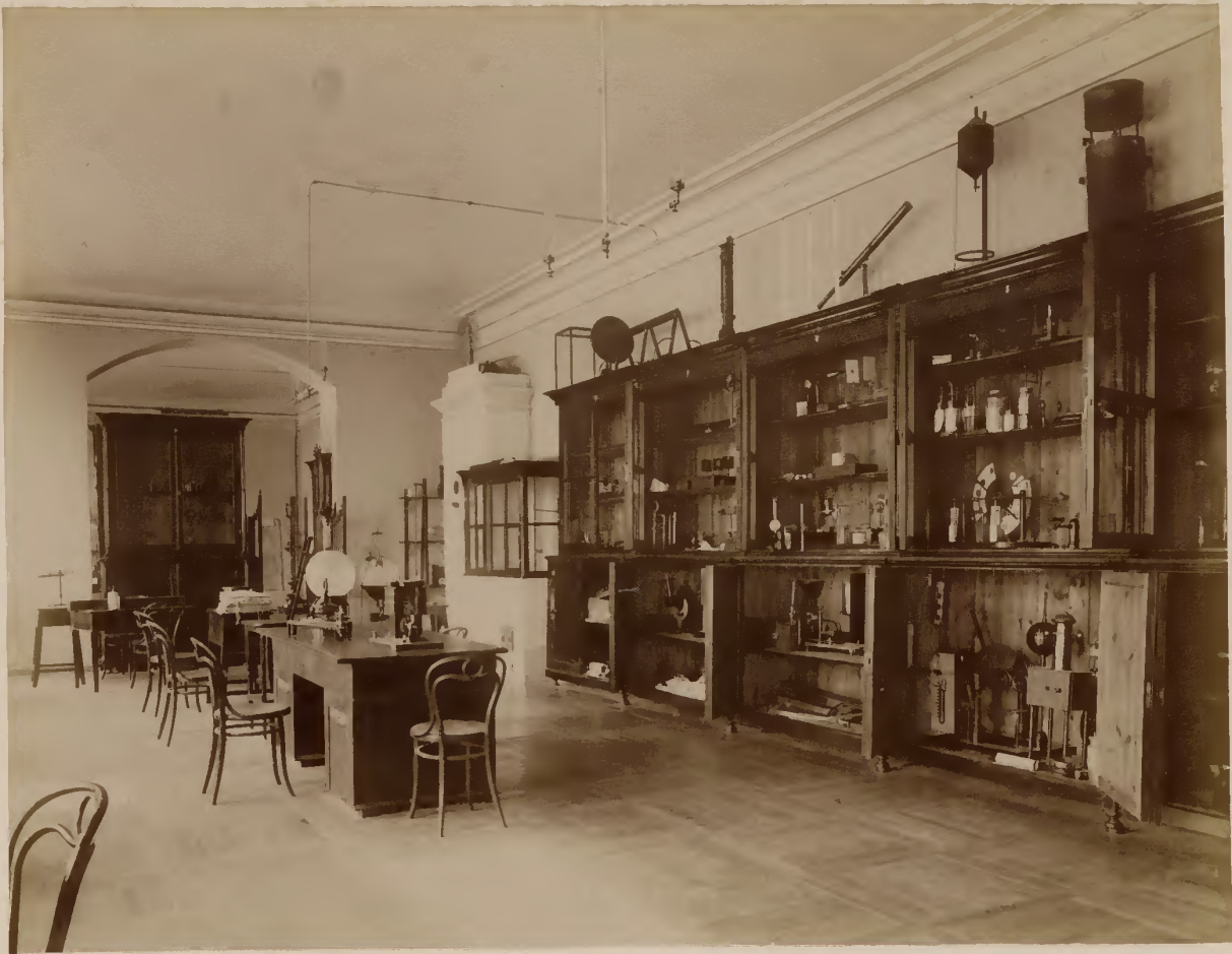
а) Физический кабинетъ.