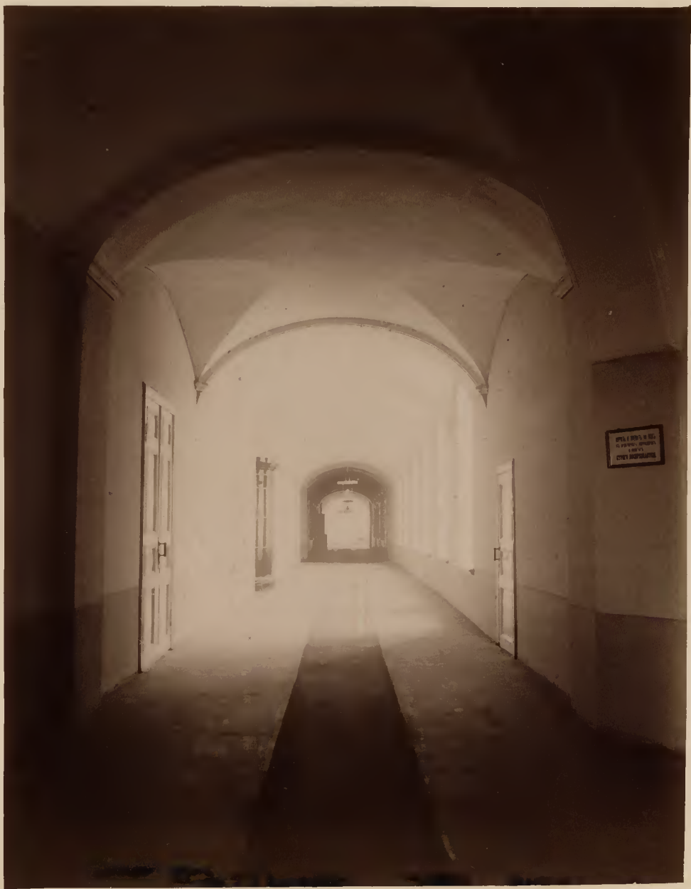
б) Корридоръ клиникъ.