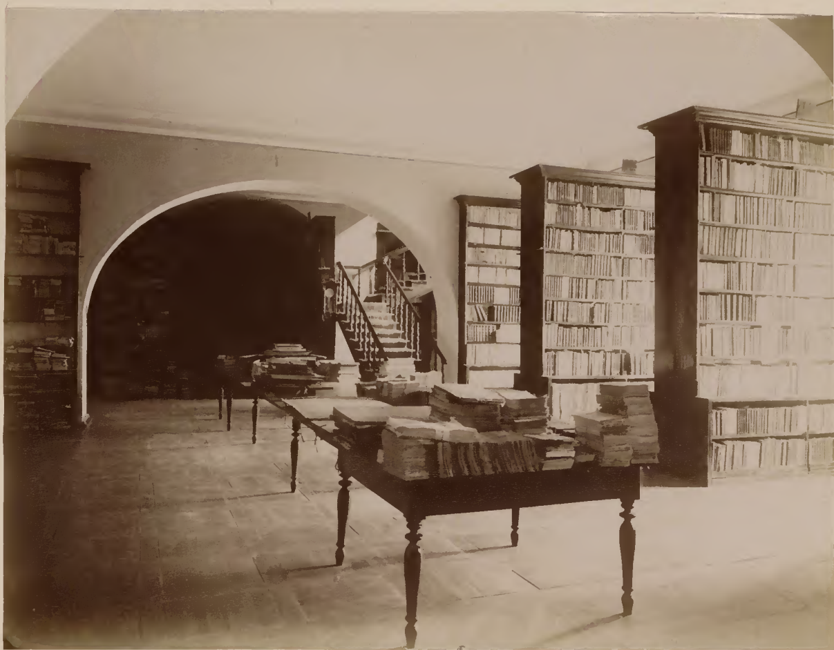
б) Сѣверо-восточный уголъ рускаго отдѣла библіотеки (въ первомъ этажѣ).