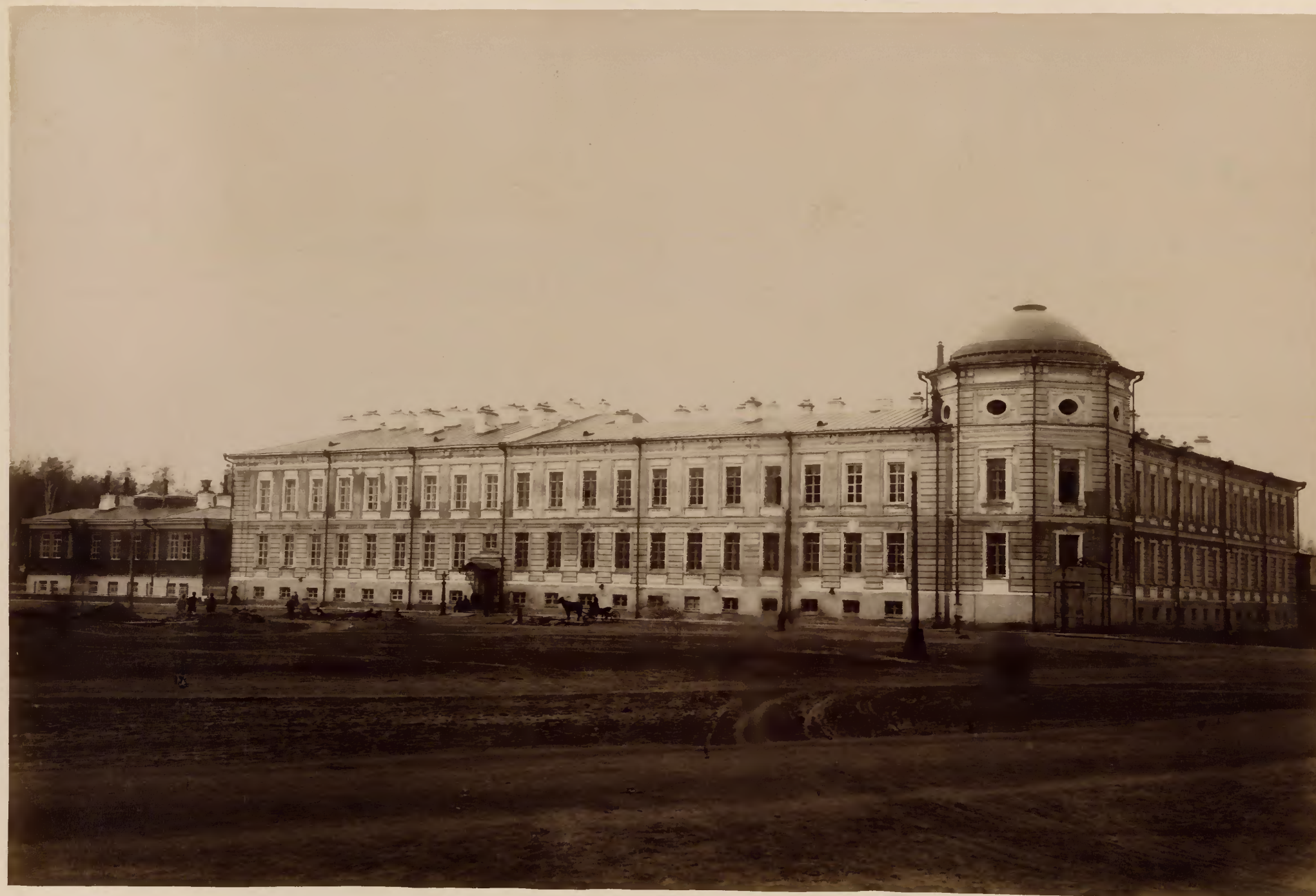
Передній фасадъ факультетскихъ клиникъ.