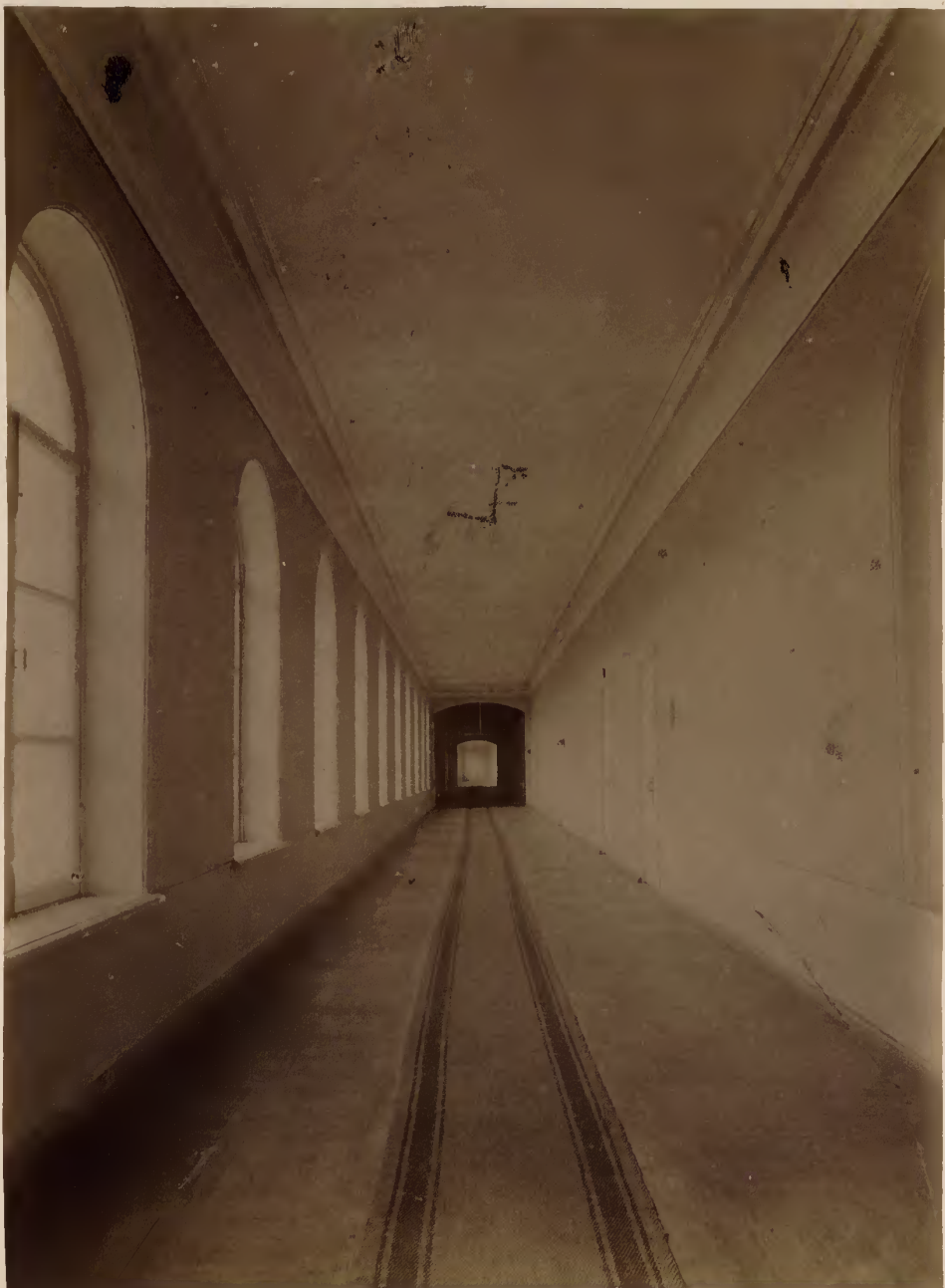
б) Корridorъ главного университетскаго корпуса.