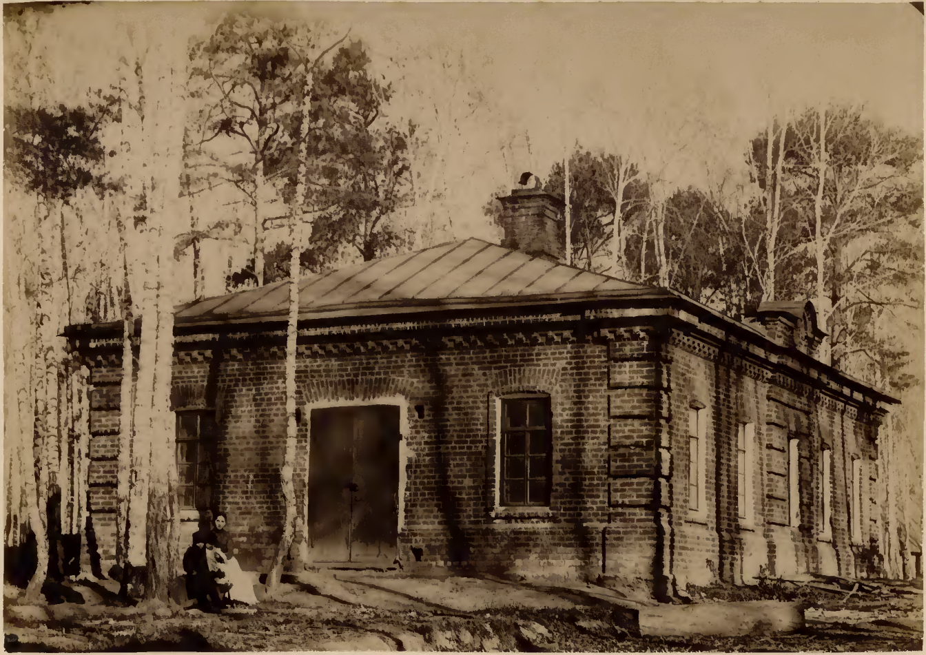
а) Домъ для содержанія экспериментируемыхъ животныхъ.