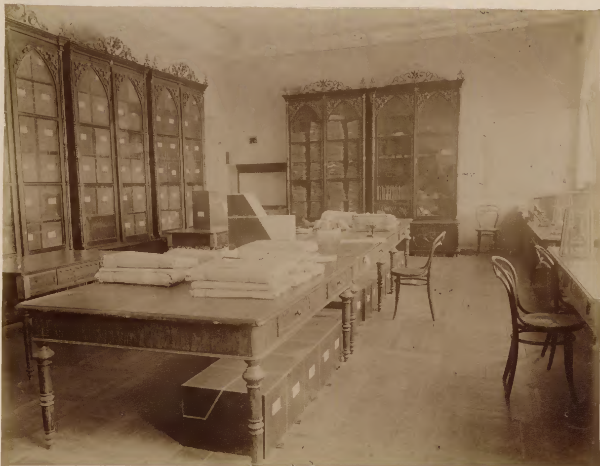
б) Ботаническій музей.