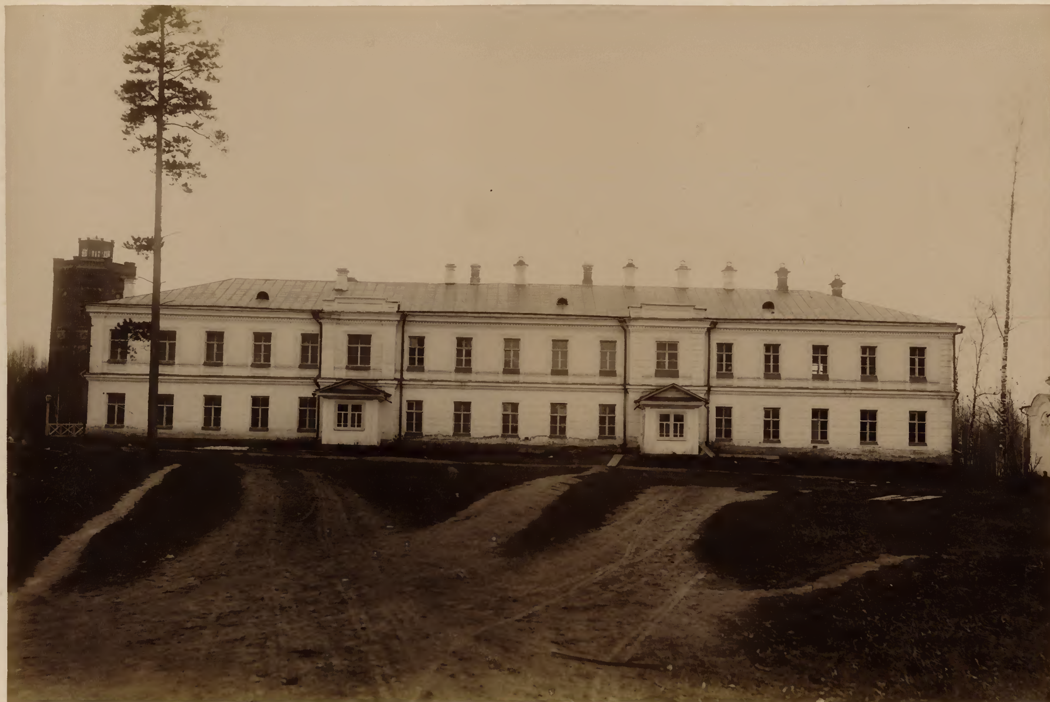
а) Анатомический корпусъ.