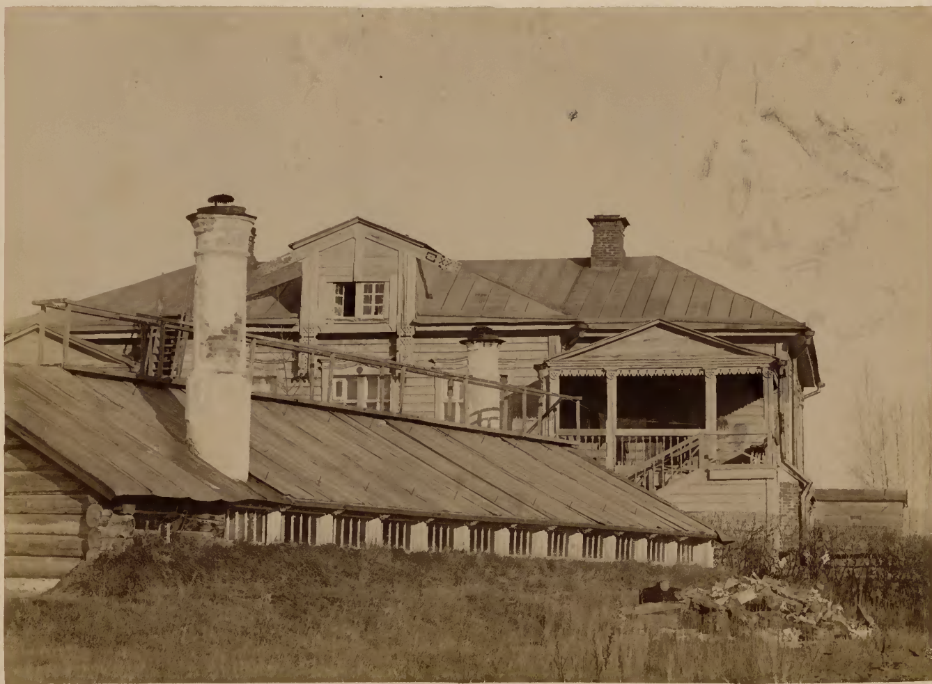
б) Теплицы и задній фасадъ ботаническаго дома.