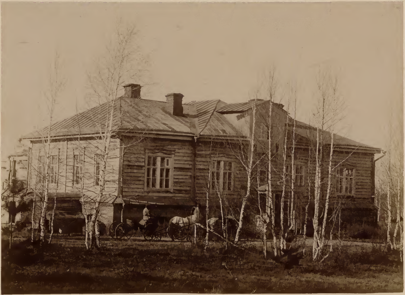
б) Лицевой фасадъ ботаническаго дома.