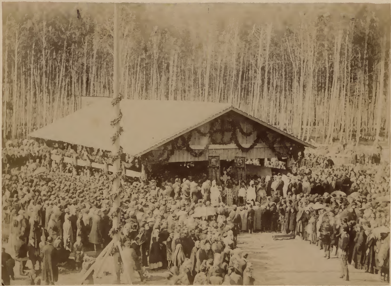
Закладка Императорскаго Томскаго университета 26 августа 1880 года.