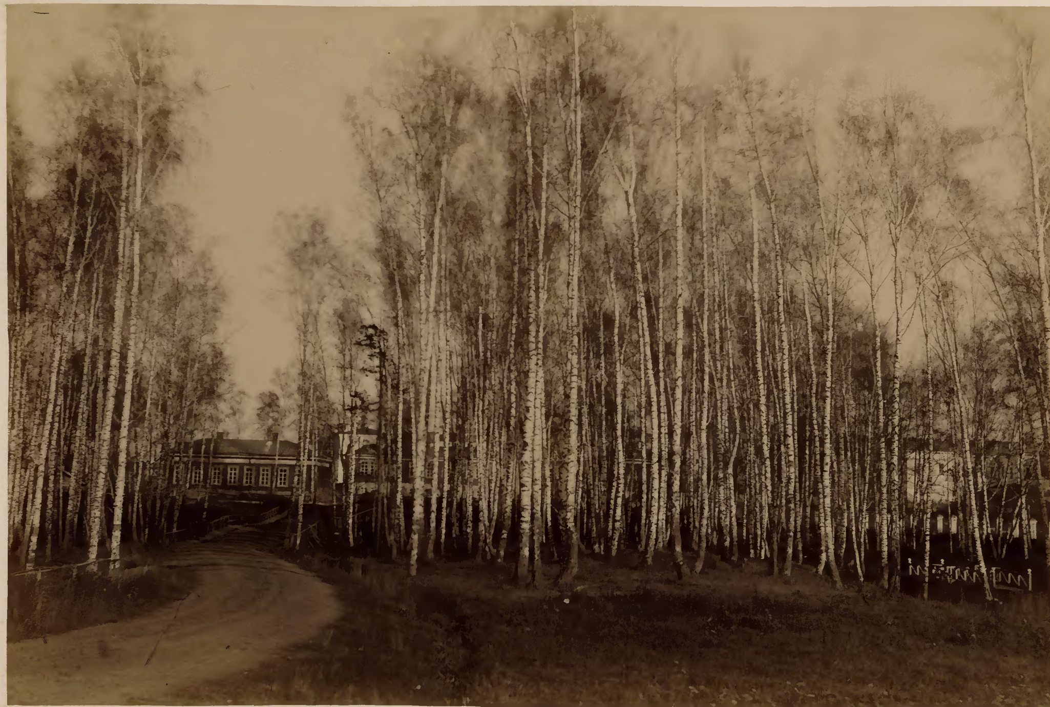
Общій видъ на клинической участокъ со стороны главнаго университетскаго корпуса.