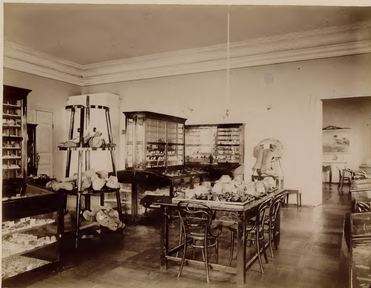
а) Часть геологического музея.