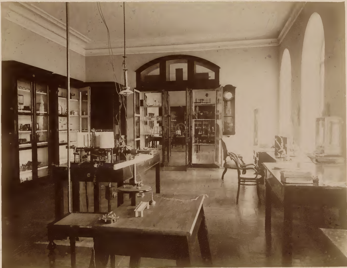
б) Физиологический кабинетъ.