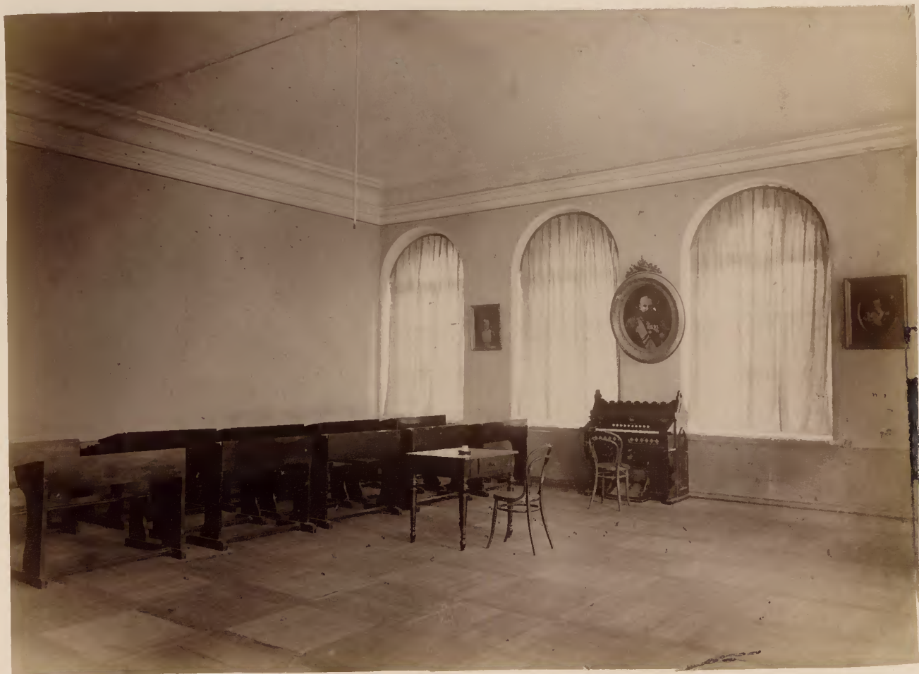
б) Заль педагогическаго совѣта гимназіи.