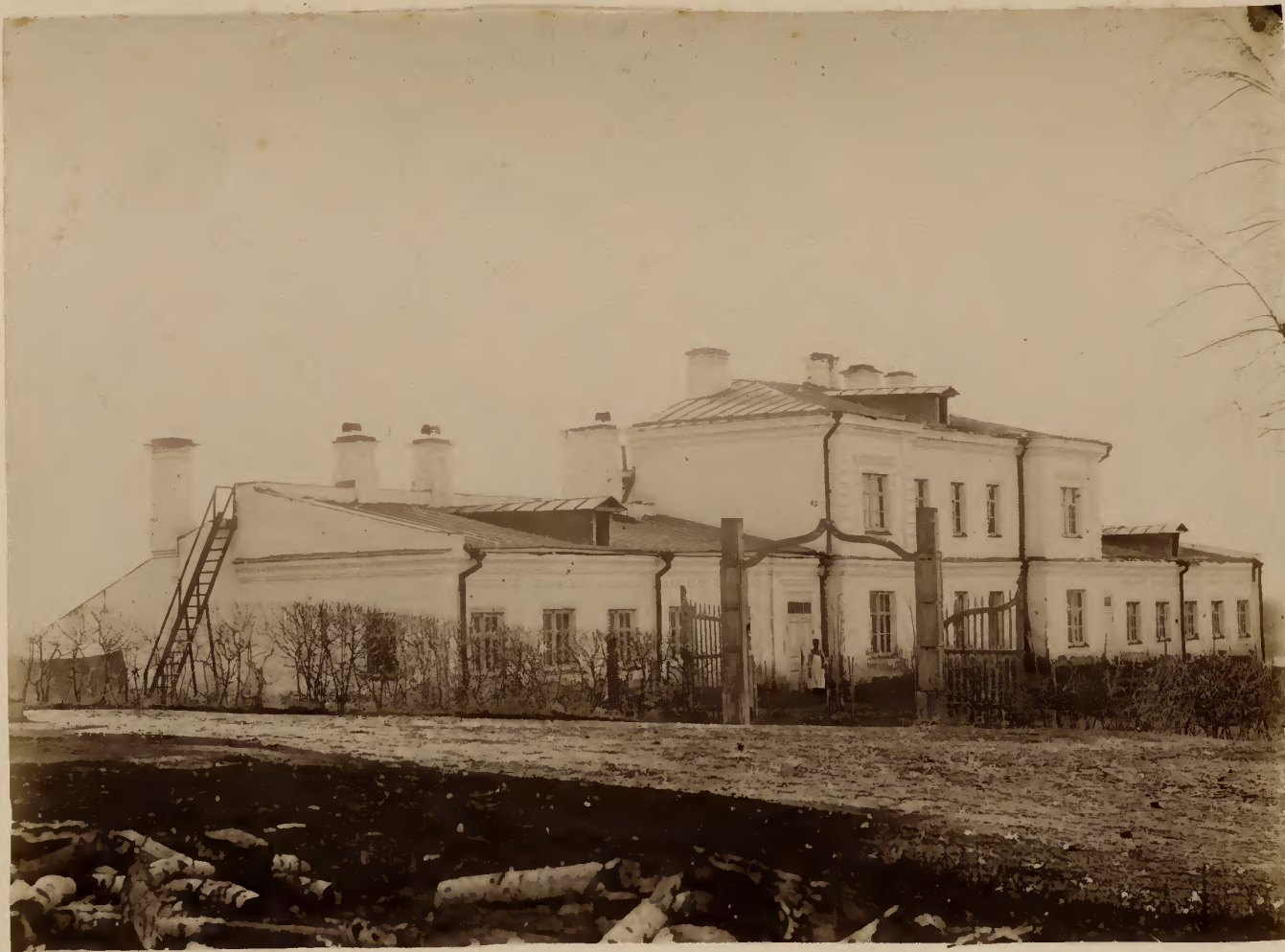
а) Видъ зданія оранжерей съ сѣверной стороны.