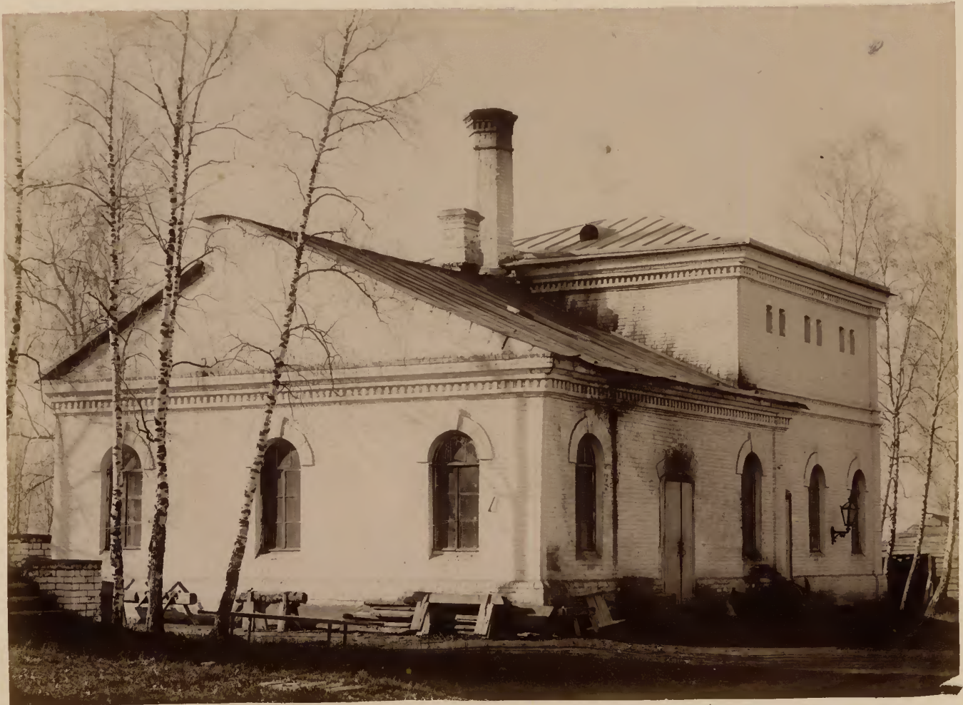
б) Газовый заводъ.