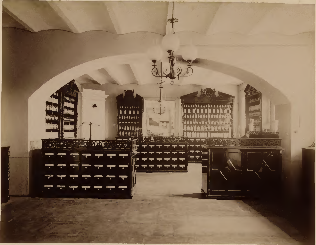
а) Клиническая аптека.