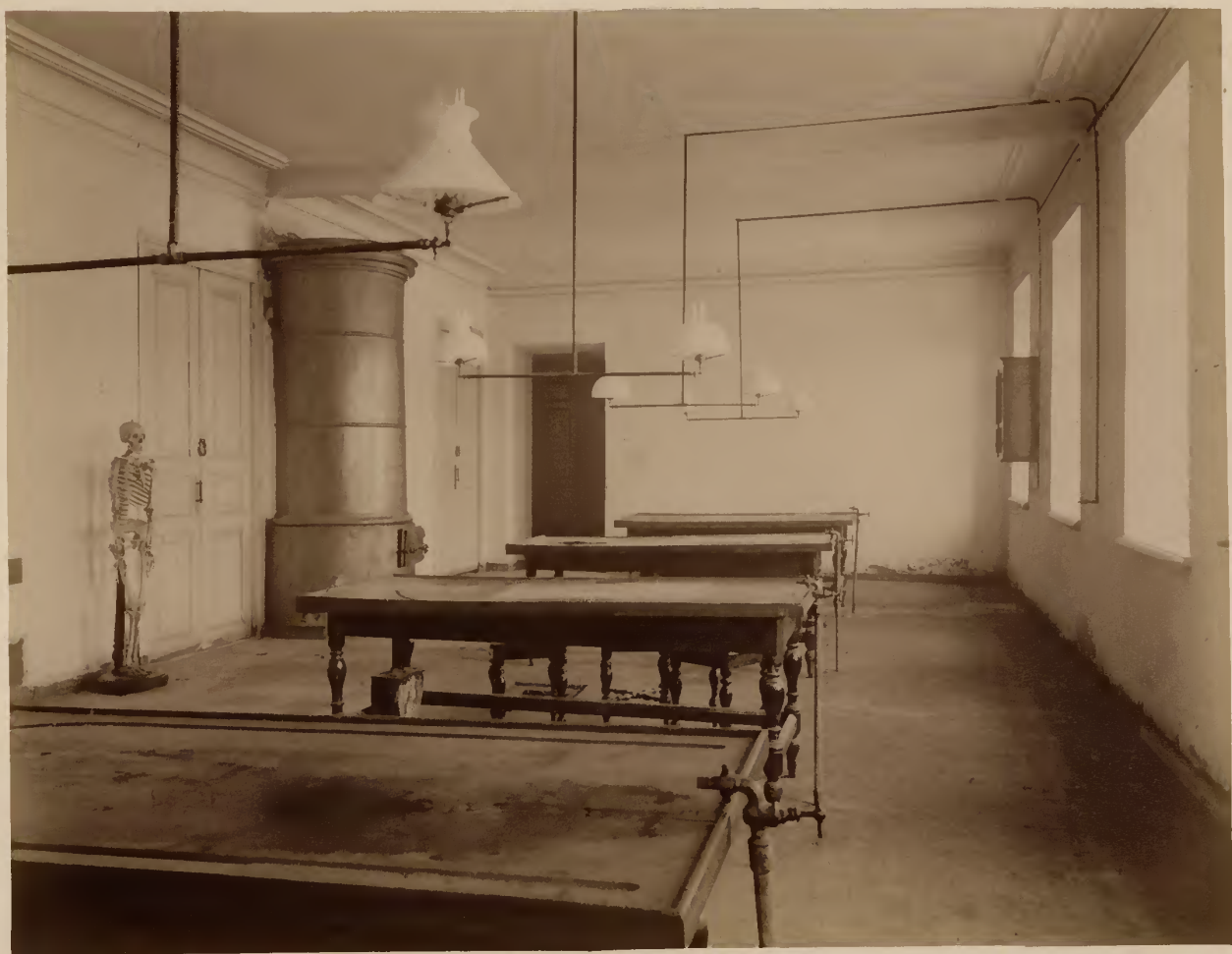
б) Секционный зал для патолого-анатомических и судебно-медицинских вскрытий.