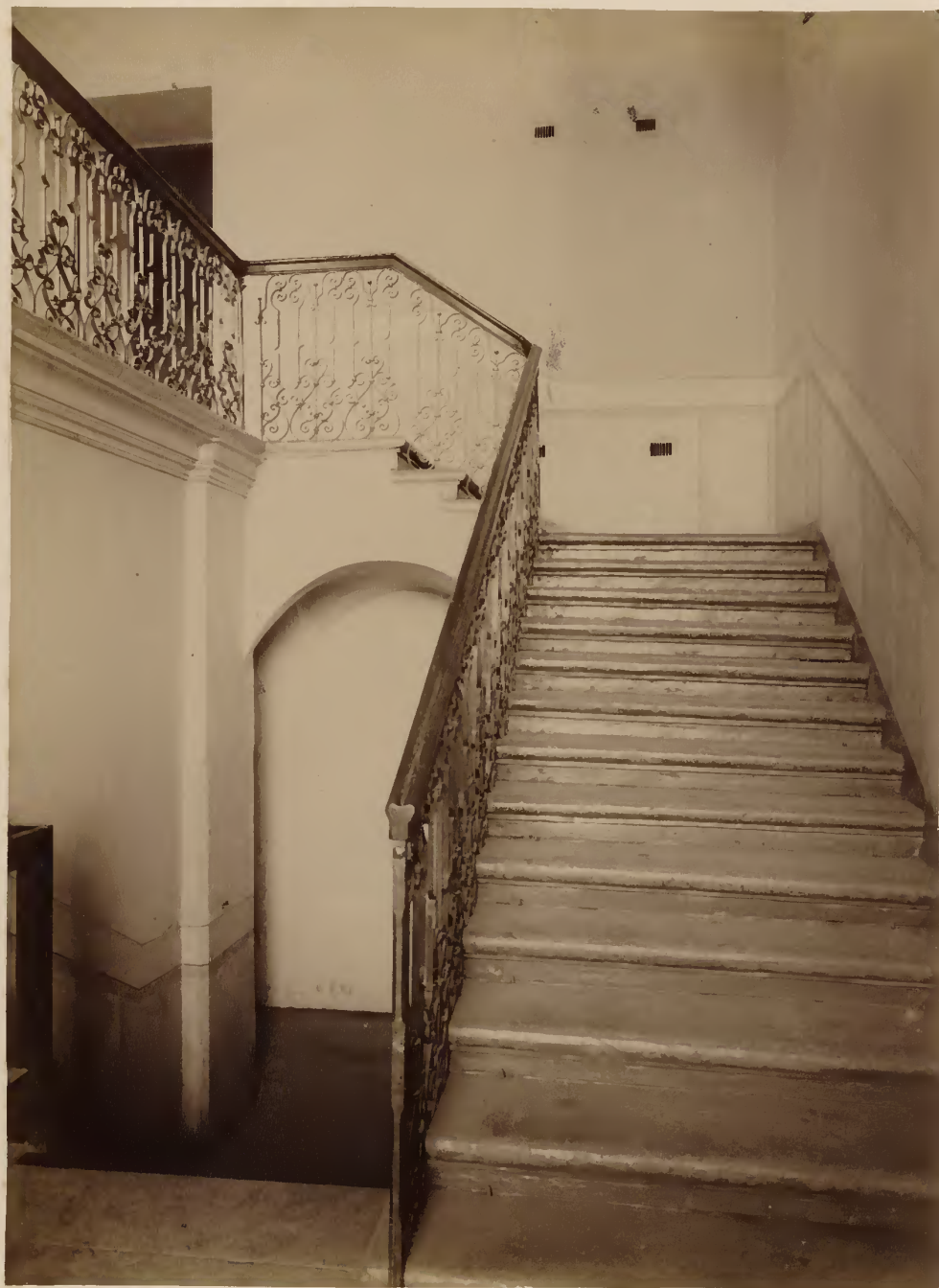
а) Лѣстница малаго клиническаго подъѣзда.