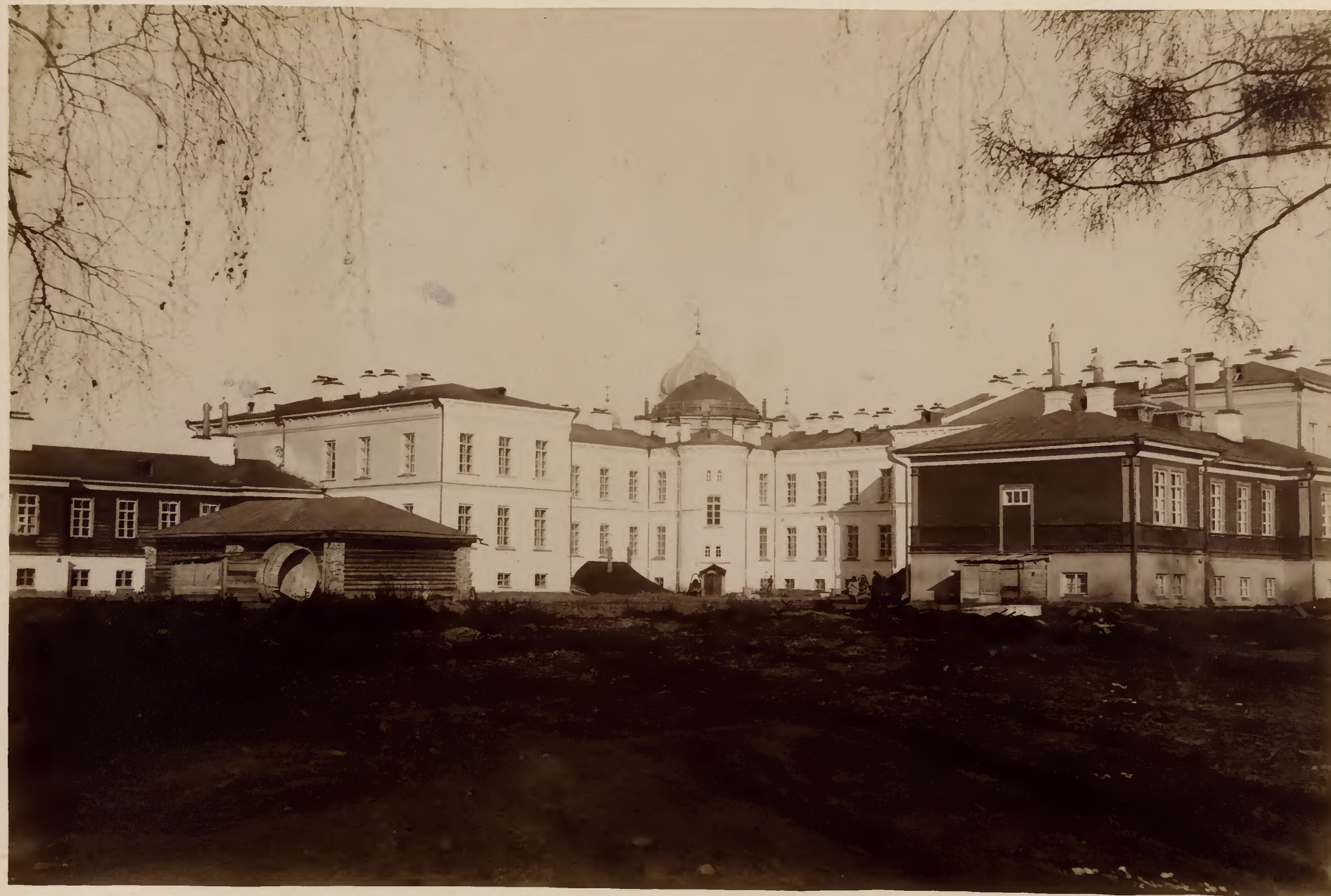
Задній фасадъ клиникъ, со стороны двора.