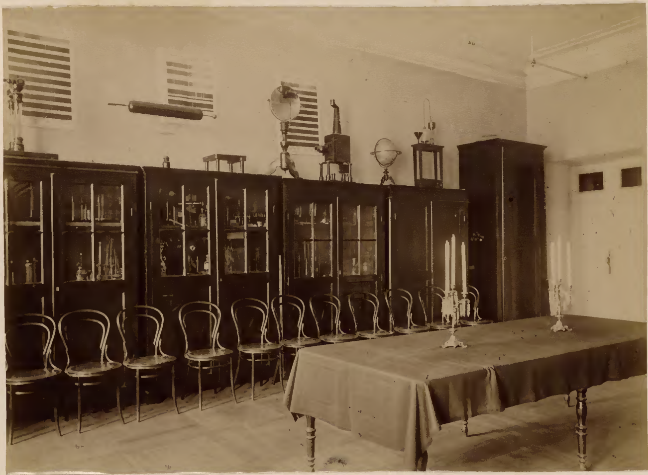
а) Физическій кабинетъ гимназіи.