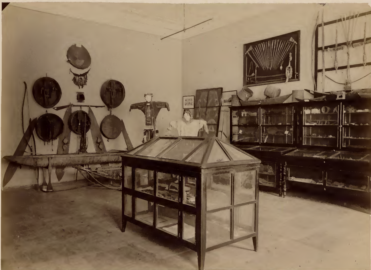
б) Этнографическое отделение музея.