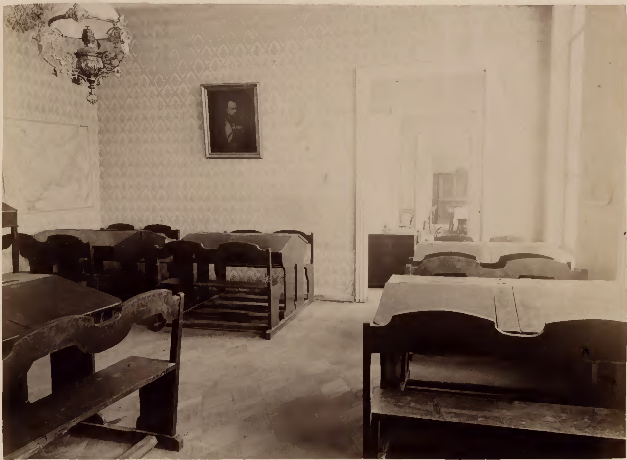
Помѣщенія гимназическаго цансіона.