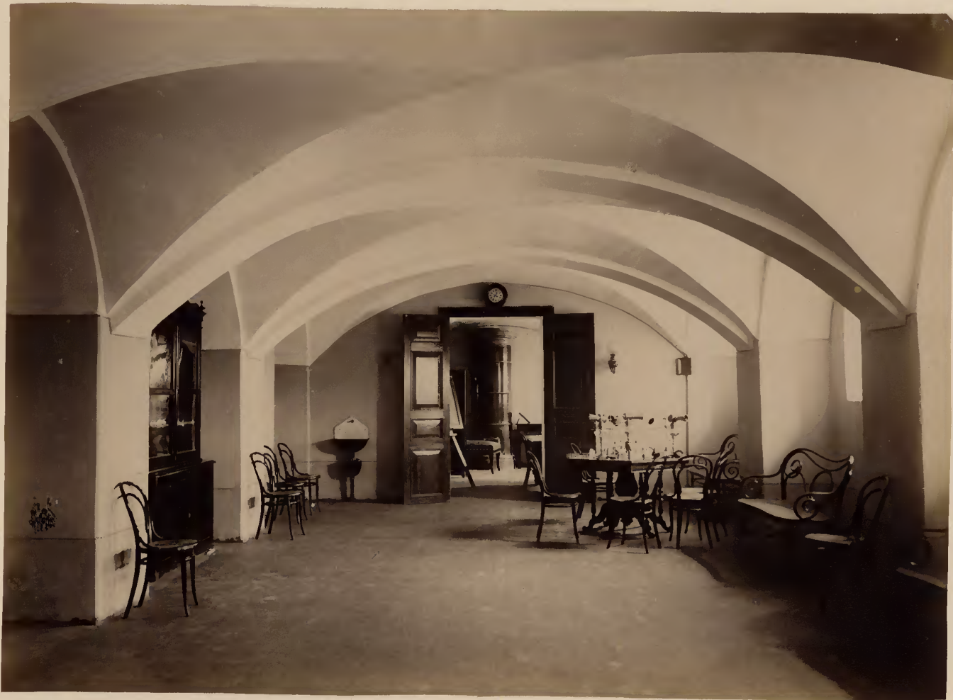
б) Амбулаторія для больныхъ внутренними болѣзнями (въ подвальномъ этажѣ).