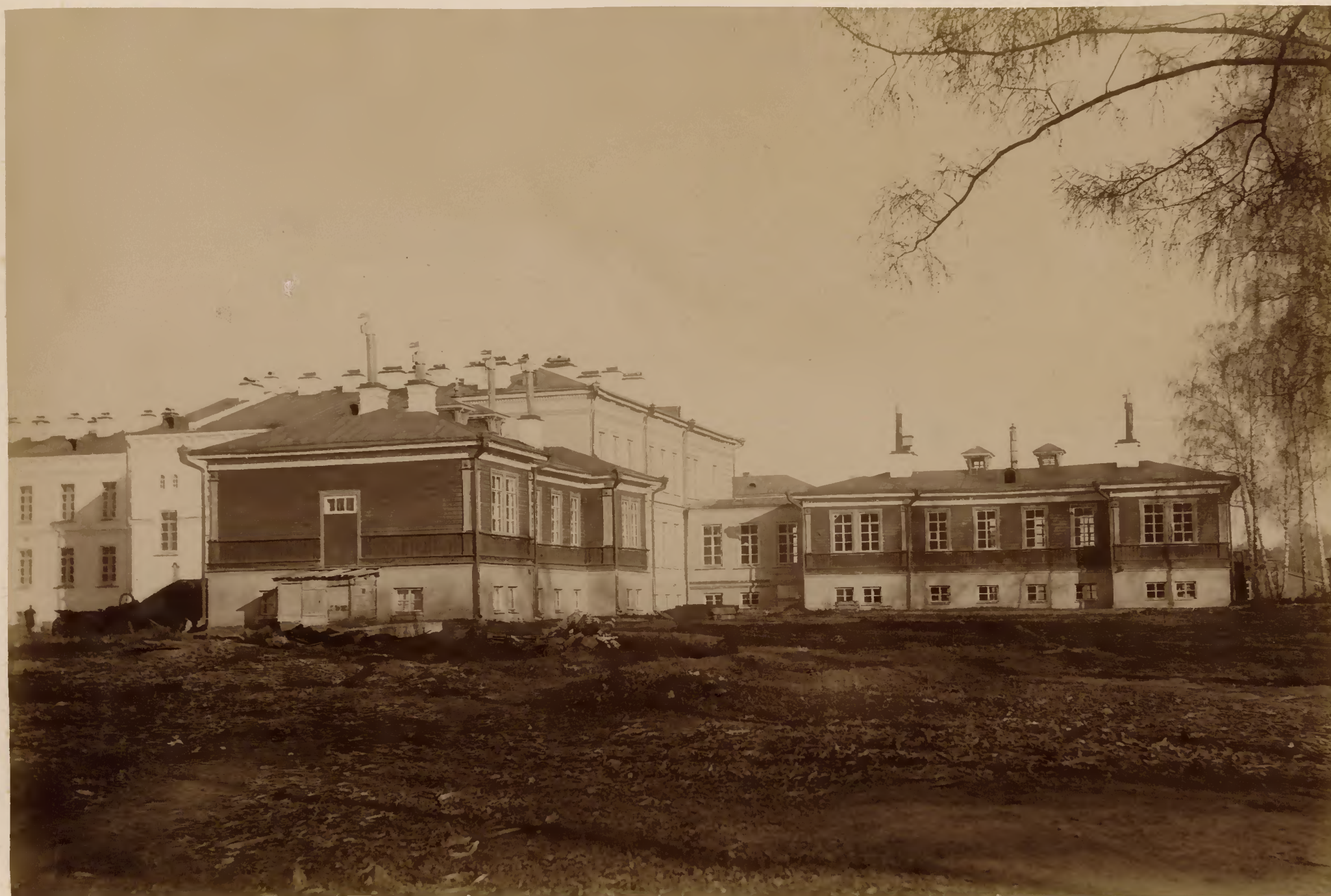
Видъ клиникъ съ юго-западной стороны (терапевтической и акушерской павильоны).