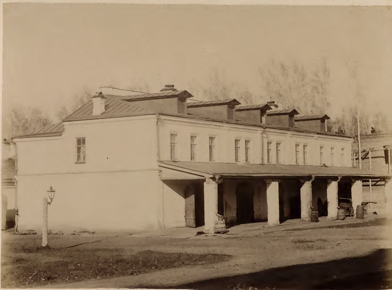
а) Службы съ передняго фасада.