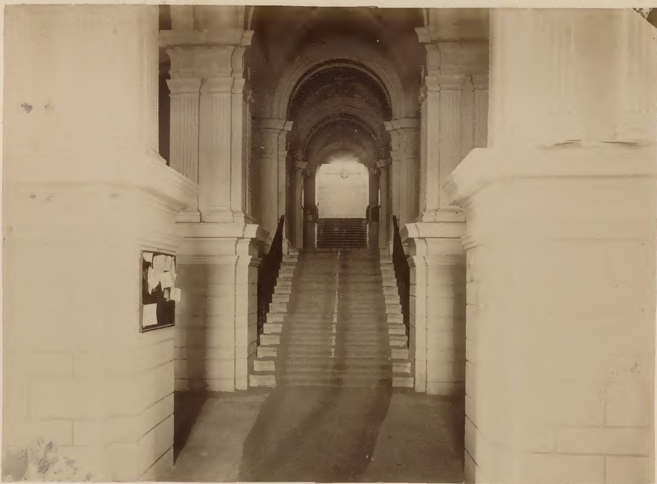
а) Часть вестибюля и парадной лестницы.