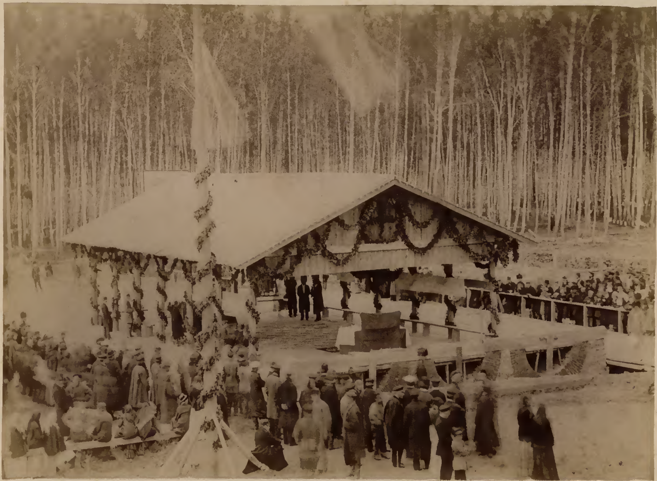
Закладка Императорскаго Томскаго университета 26 августа 1880 года.