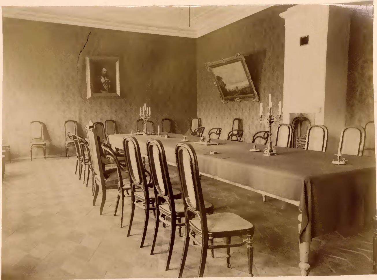
а) Залъ Совѣта.