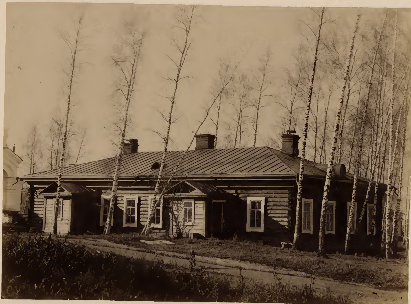
б) Казарма для служителей.