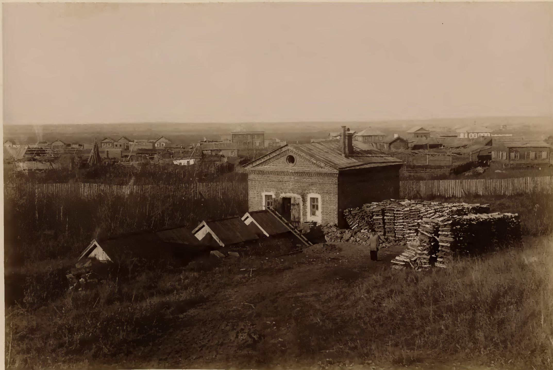
Здание паровой водокачки и сборные колодцы университетского водопровода.