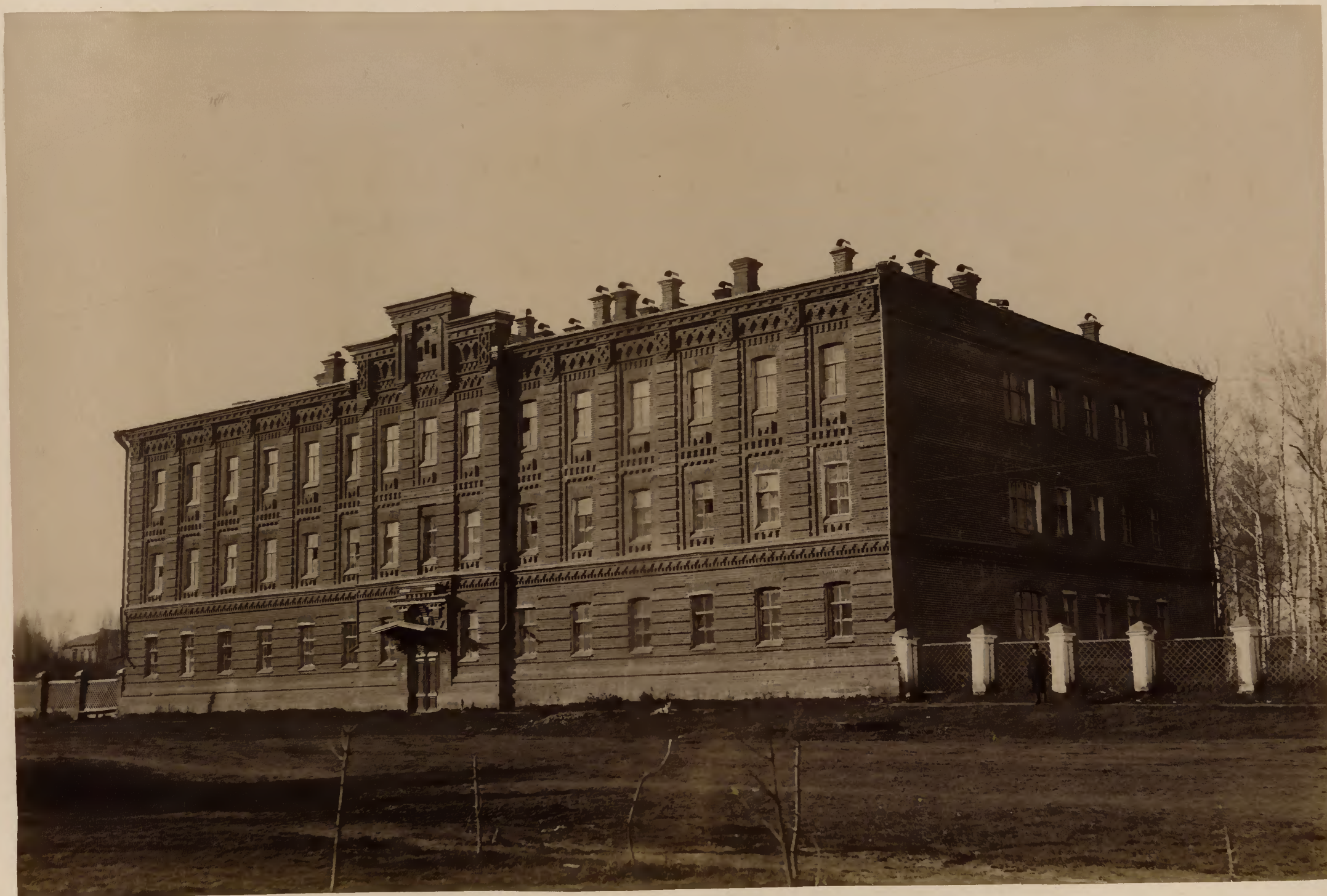
а) Домъ общежитія студентовъ.