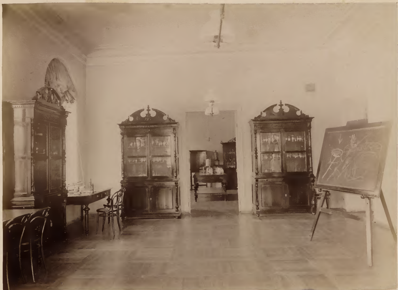
а) Гистологический кабинет.