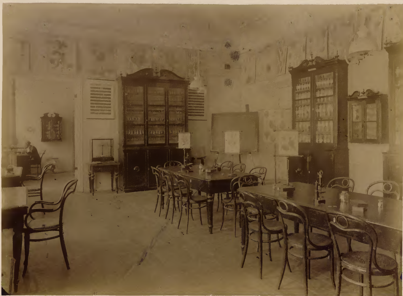
б) Фармацевтический кабинетъ.