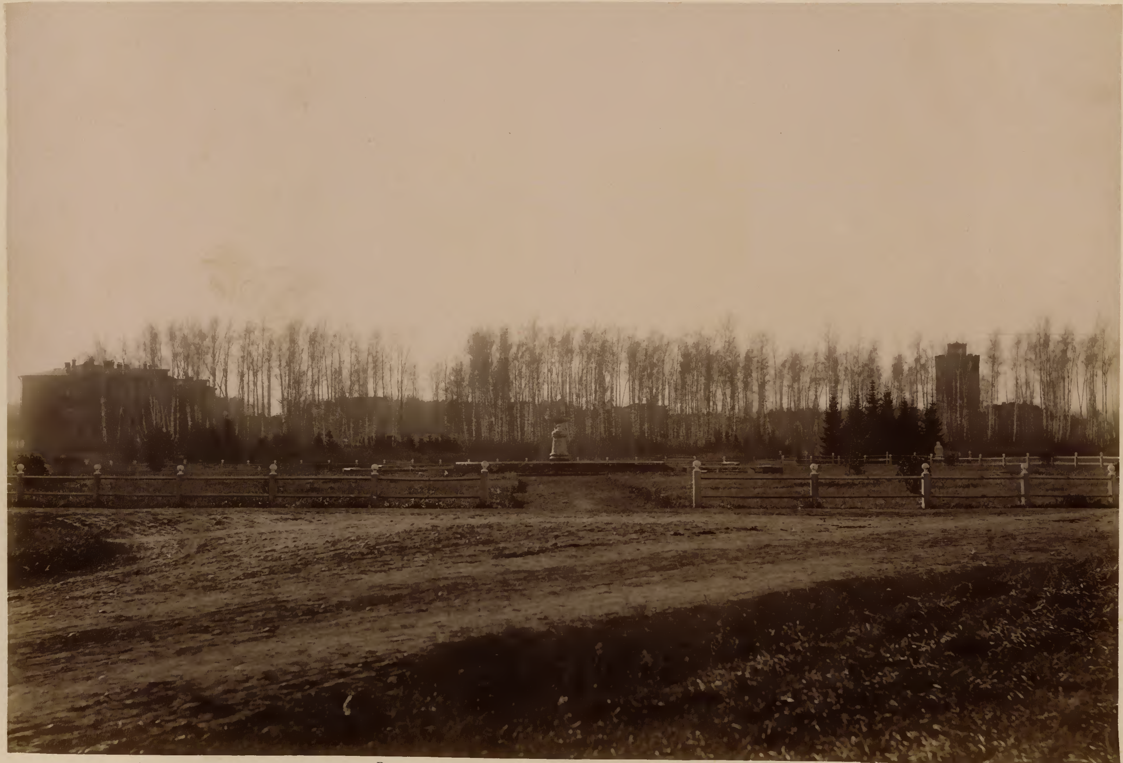
Видъ на ботаническій участокъ отъ университетскаго фонтана.