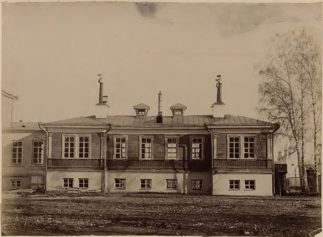
а) Павильонъ терапевтической клиники.