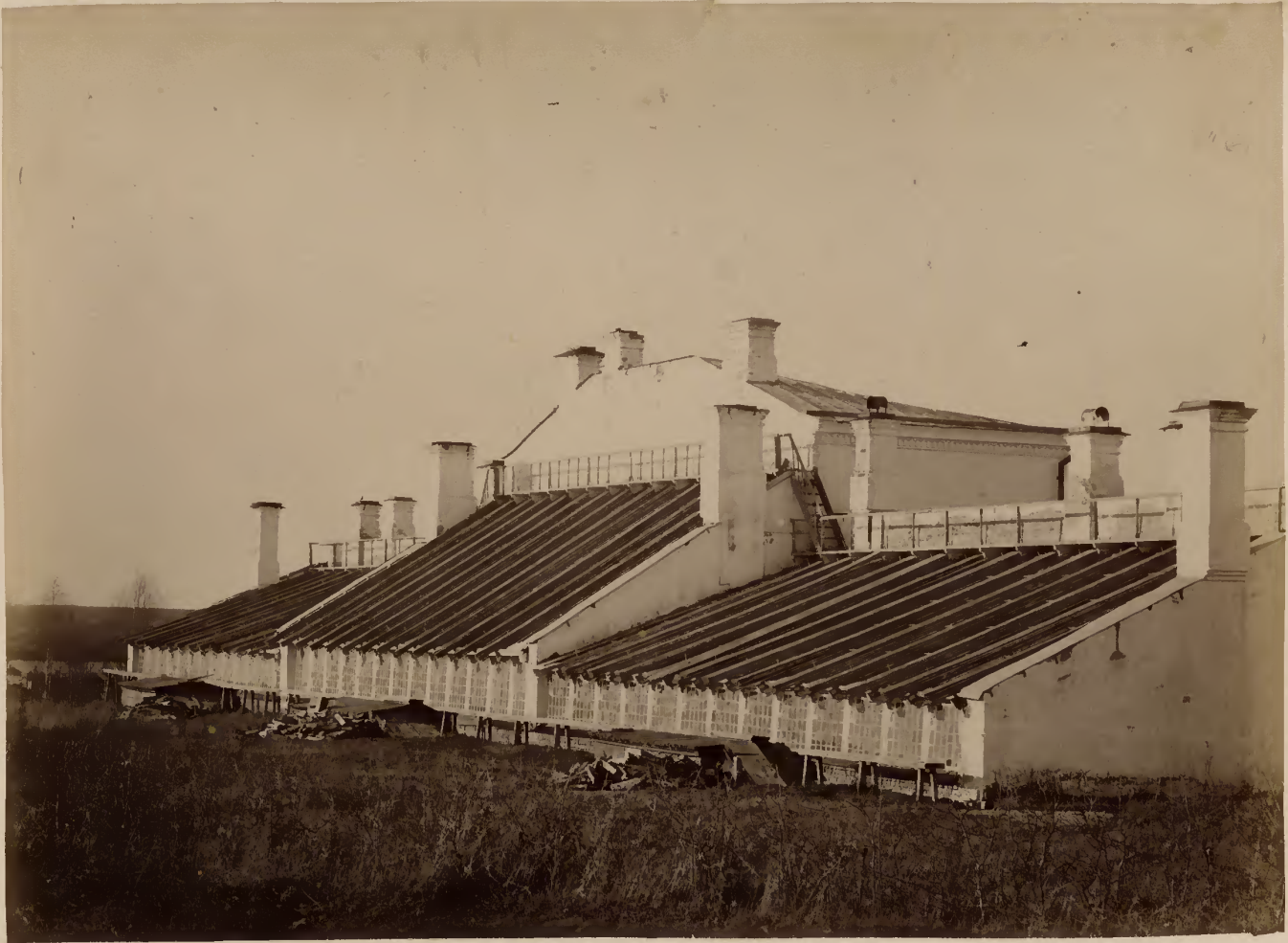
а) Оранжереи съ южной стороны.