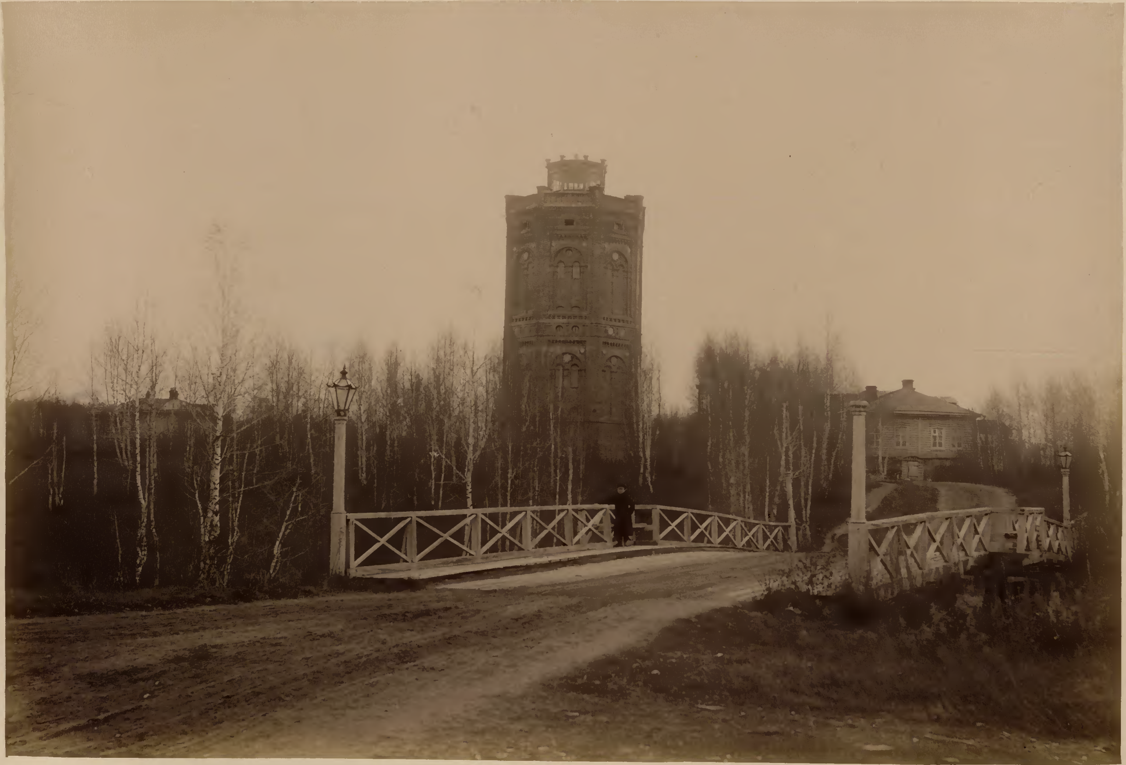
Мостъ черезъ оврагъ на ботаническій участокъ; видъ водонапорной башни и части ботаническаго дома.