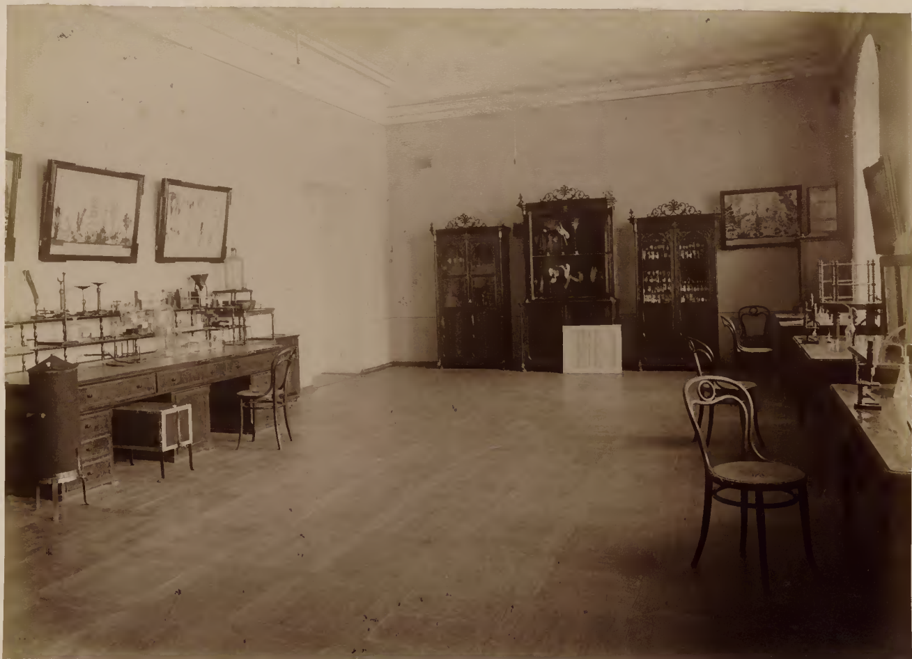
а) Ботаническій кабинетъ.