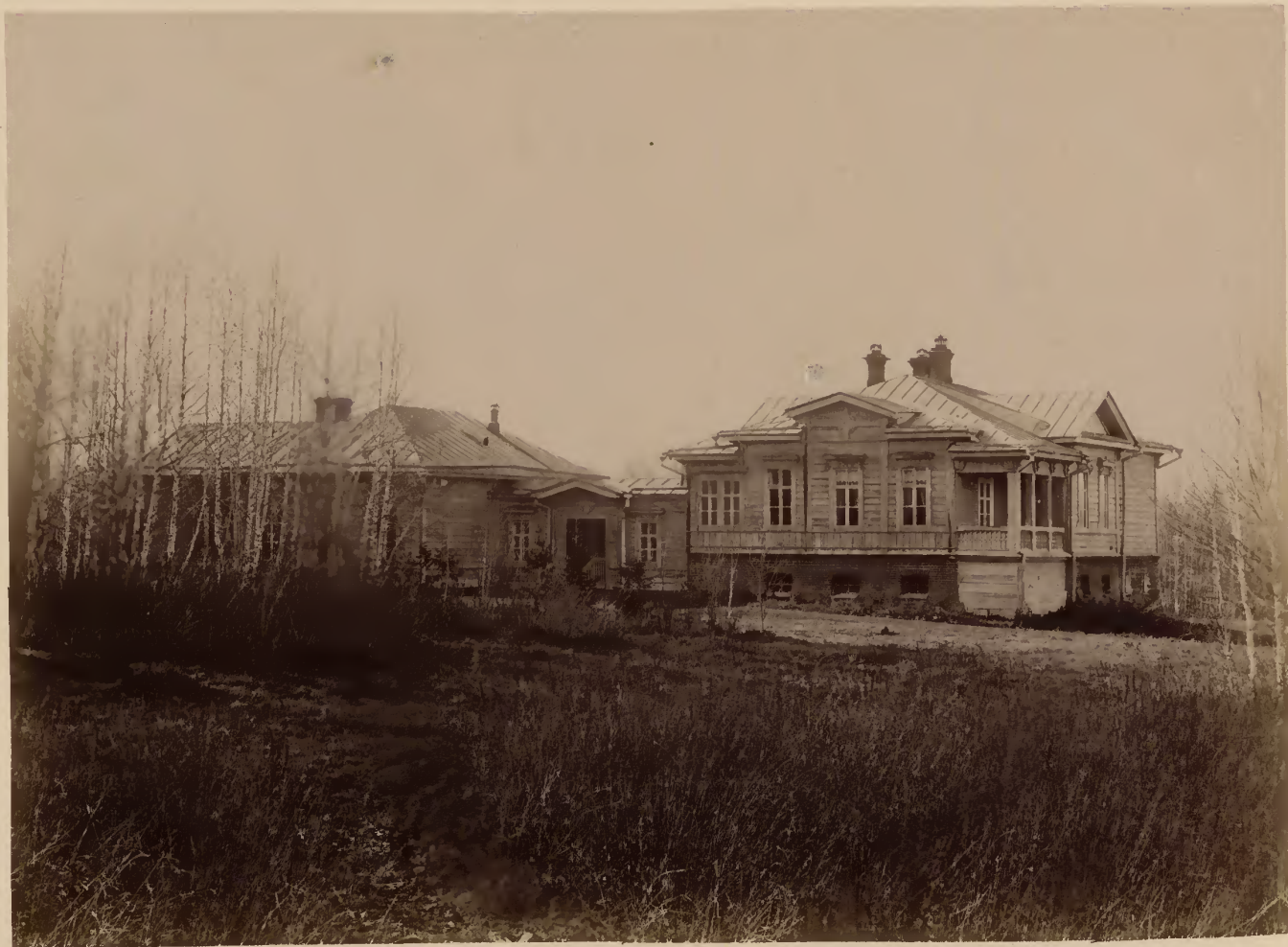
б) Такъ называемый астрономическій домъ.