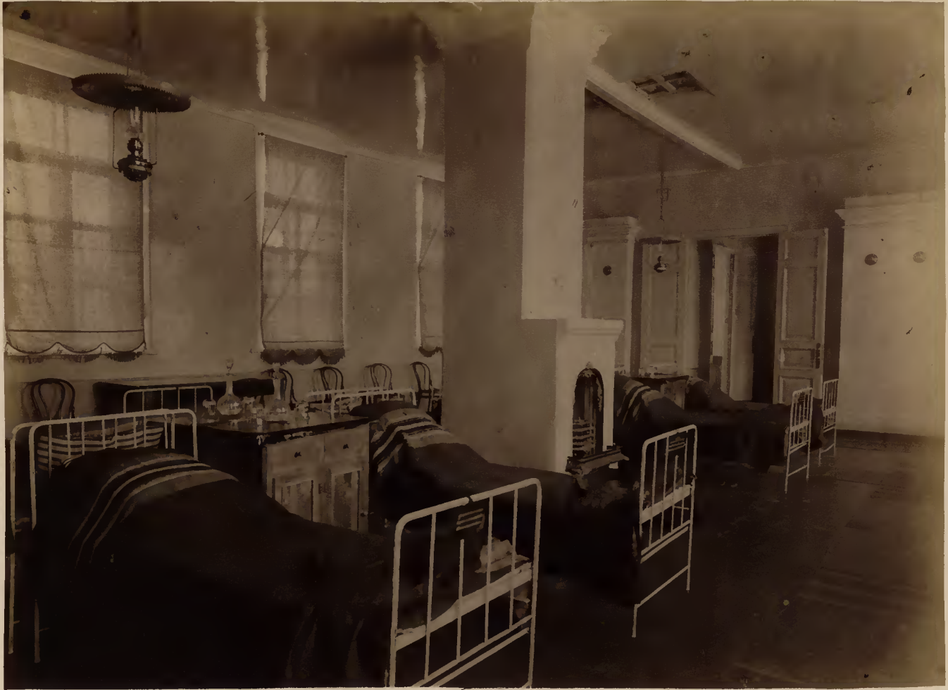
а) Клиническая палата.