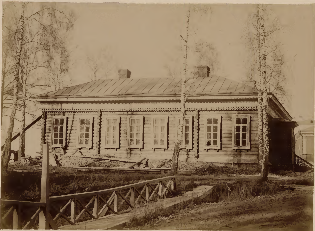
б) Павильонъ для заразныхъ больныхъ.