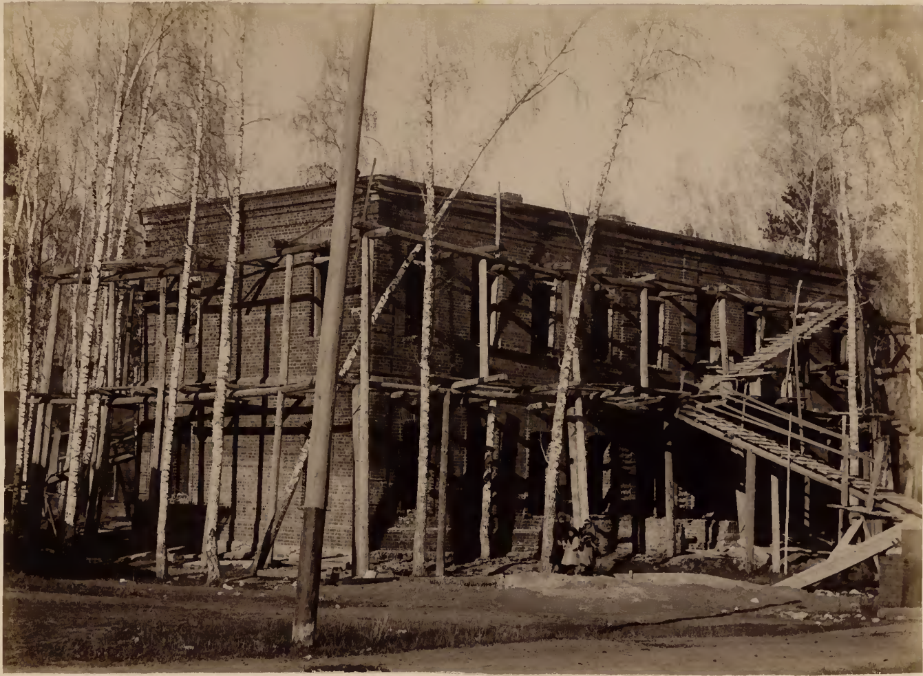
а) Строющийся гигиенический корпусъ съ лицевой стороны.