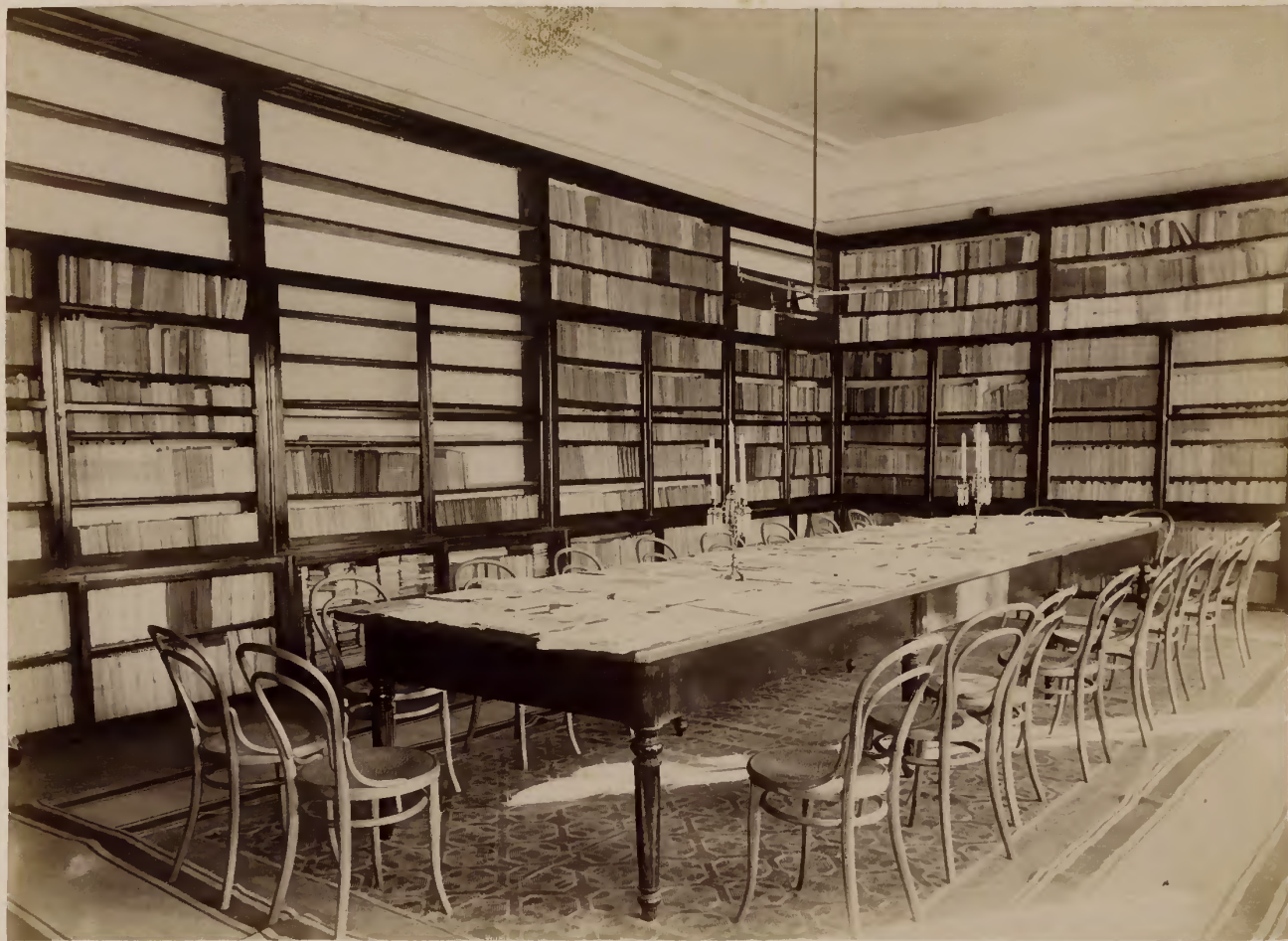
а) Читальная зала библиотеки.