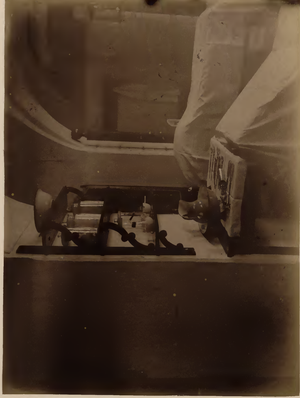
б) Амбулаторія гинекологического отдѣленія.