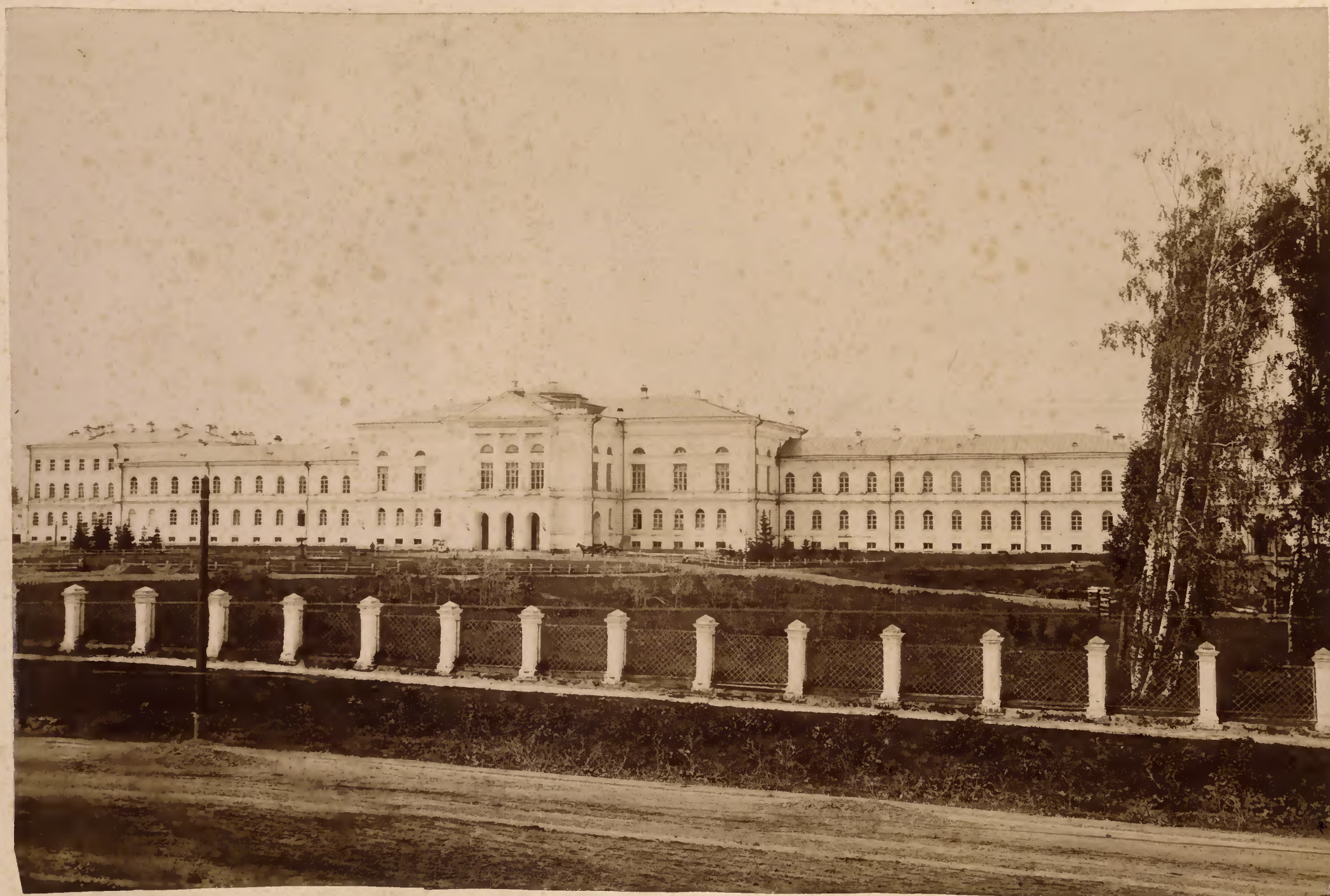
Передній фасадъ главнаго университетскаго корпуса.