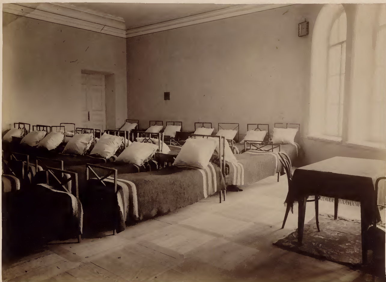
б) Часть дортуаровъ гимназического пансіона.