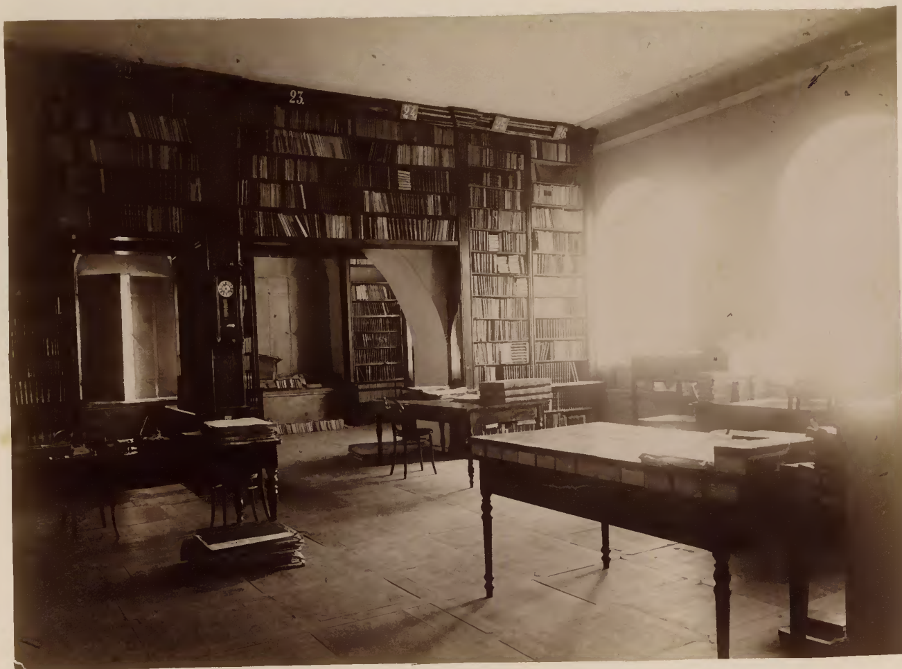
б) Средняя часть залы для медицинского отдѣла библиотеки.