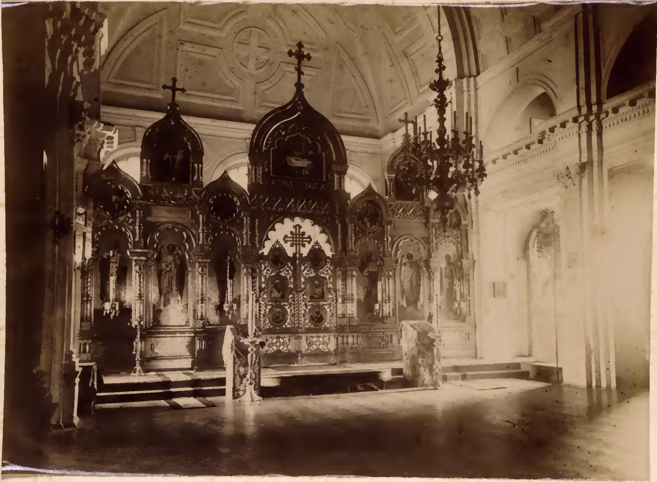
а) Университетская церковь.