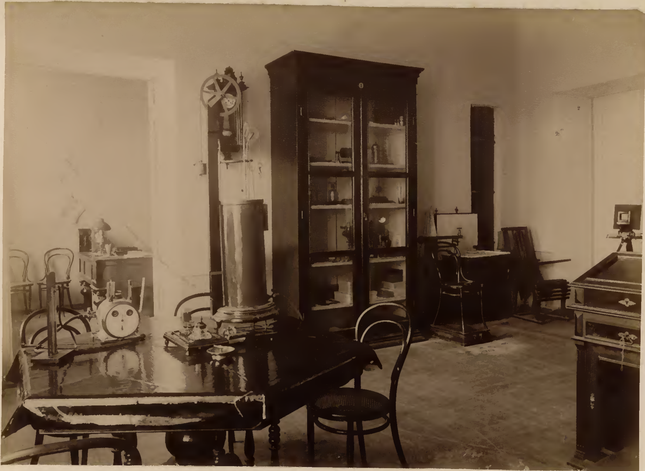
а) Кабинетъ профессора терапевтической клиники.