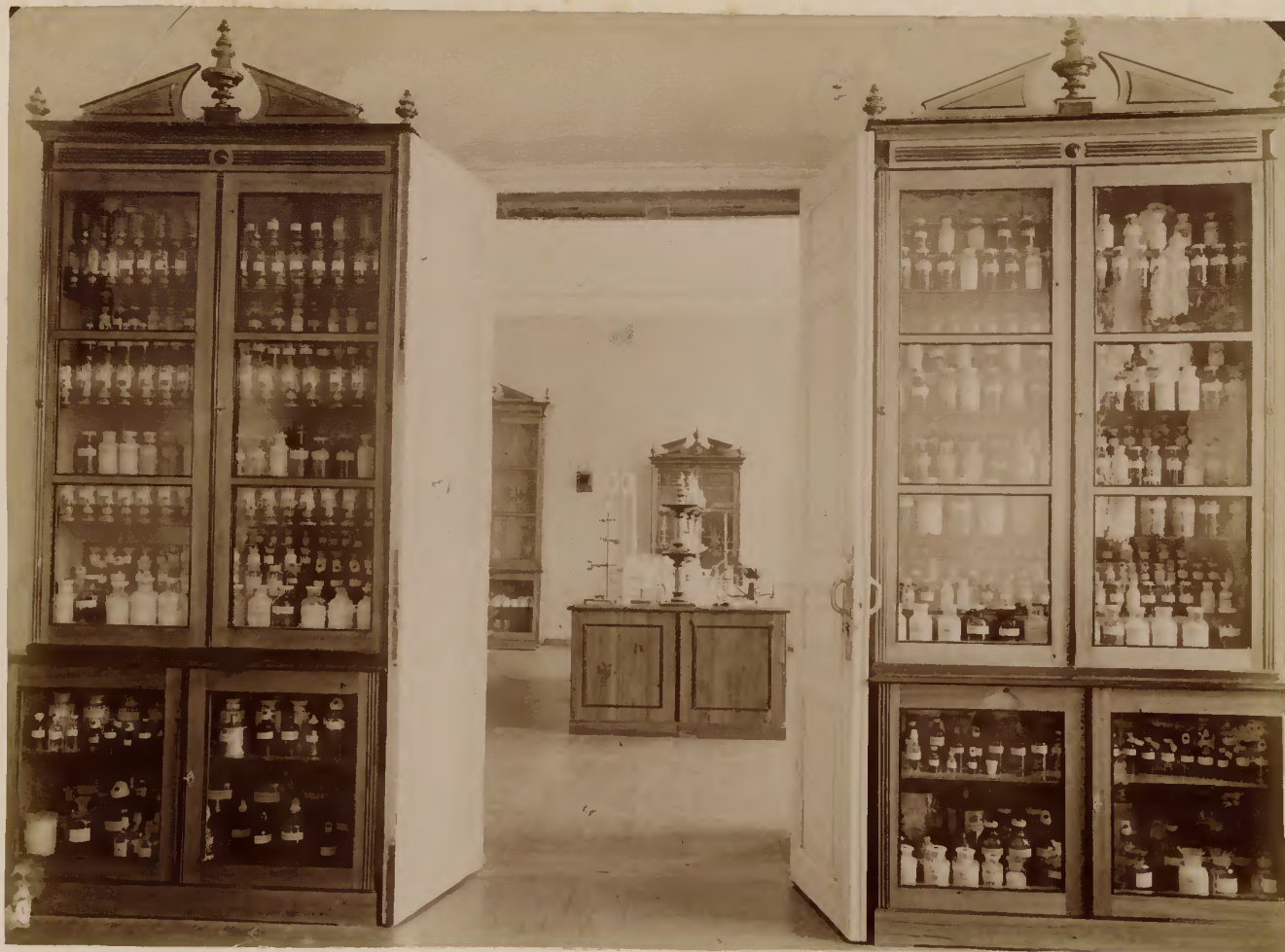
б) Фармацевтический кабинет.