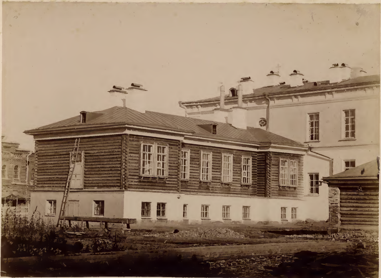
а) Задній фасадъ хирургическаго павильона.