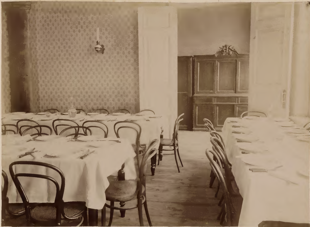
а) Столовая гимназического пансіона.