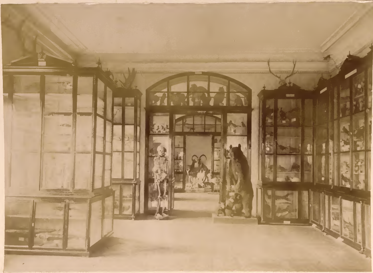
б) Зоологическій музей.