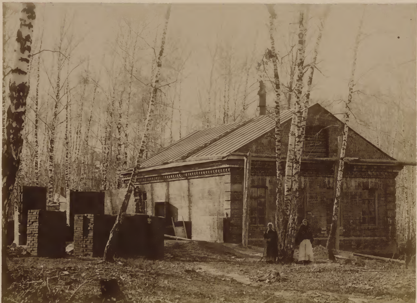
б) Клиническая прачешная съ начатою пристройкою для дезинфекціонной камеры и для машинъ электрическаго освѣщенія.