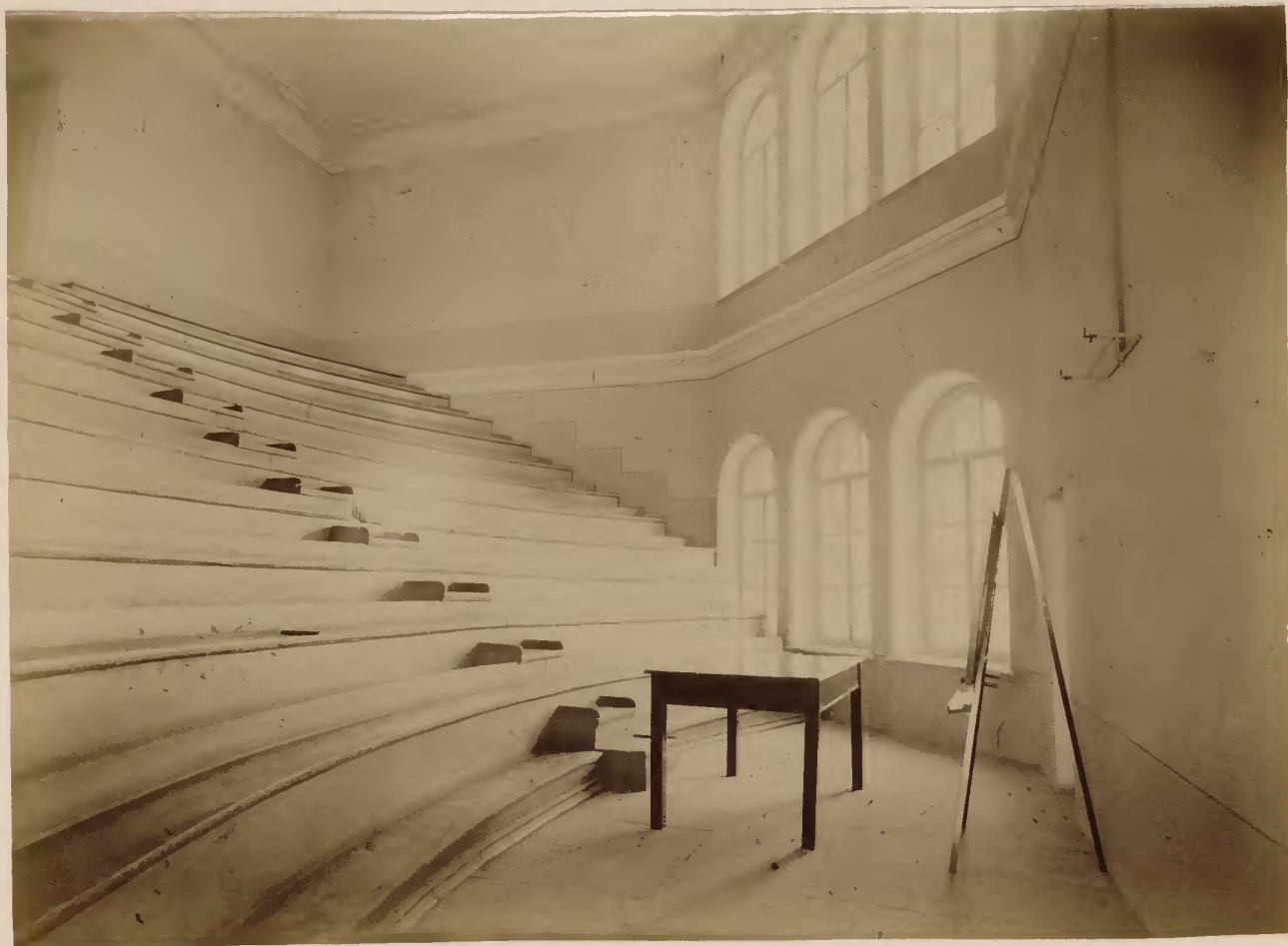
б) Первая (двухсвѣтная) аудиторія.