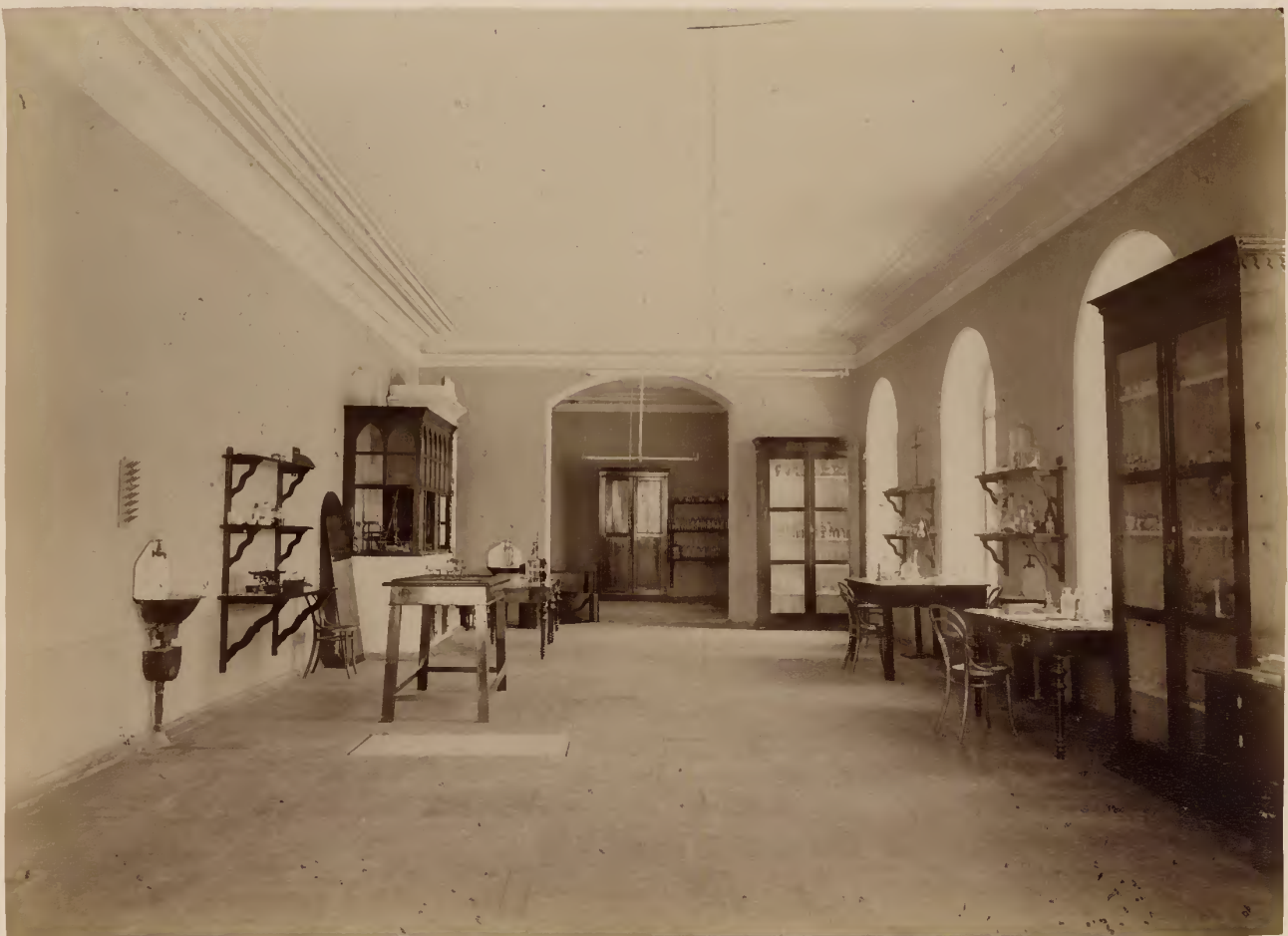
б) Кабинетъ общей патологіи.