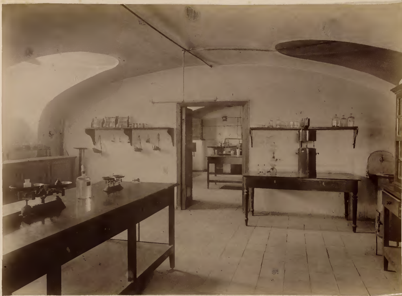
а) Фармацевтическая лабораторія.