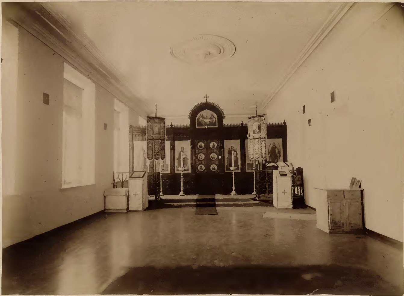
а) Клиническая церковь.