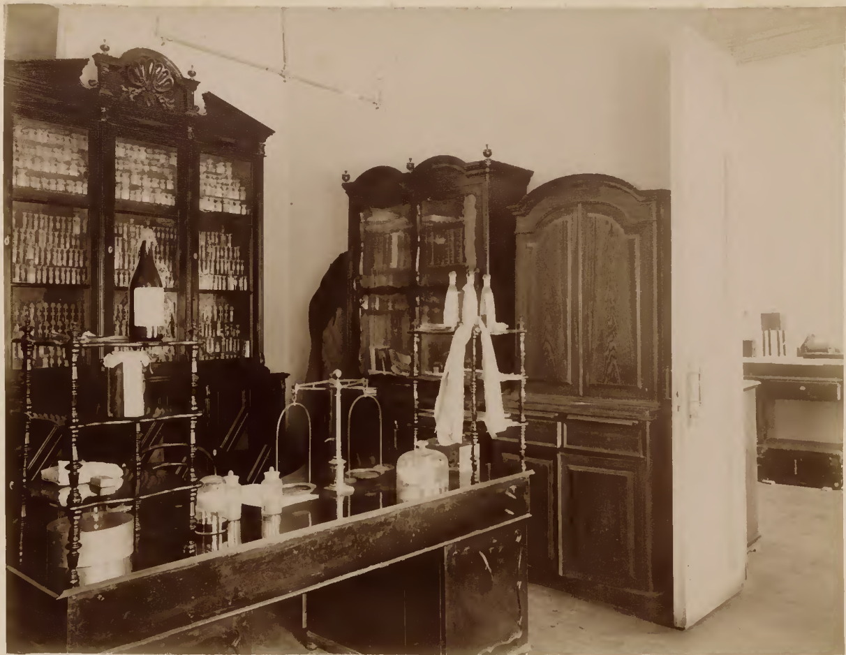
а) Химический кабинетъ.