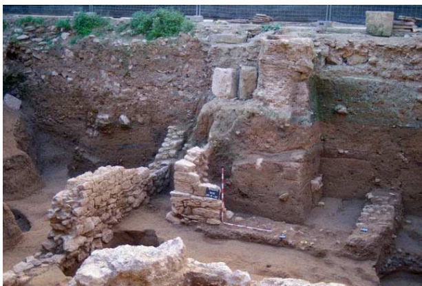
La Torre del solar de la calle Salvador/Viciana, probablemente de la Puerta Norte