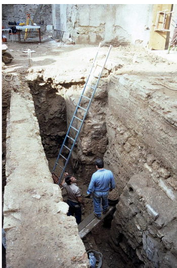
El tramo conservado en la calle Avellanas 14