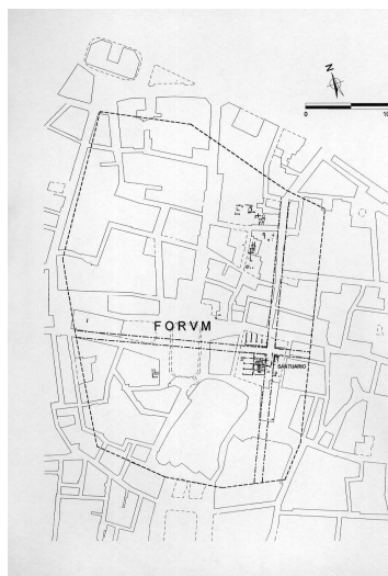
El recinto republicano