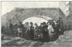
FRANCISCO DE GOYA Y LUCIENTES "LA BODA" Español 1746-1828 Óleo, ancho 0m51, alto 0m345 Propiedad del Jockey Club de Buenos Aires

aprovechado por los amantes del arte del pintor, que supieron por el nieto no pocas cosas de la vida del abuelo. De ello trato en mi "Goya Pintor de Retratos" (páj. 67). Los cuadros eran cuatro que representaban