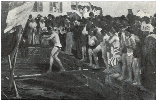
LUCIEN SIMON Francés contemporáneo "LE BEAUPIE" Óleo, ancho 1m315, alto 0m87 Legado Francisco B. Recondo

El señor Recondo tuvo desde su juventud gran afición al arte y llegó a formar una importante galería de cuadros, firmados por conocidos autores extranjeros y nacionales. Su última resolución, digna de servir de ejemplo, demuestra su amor a la cultura artística y a su país.