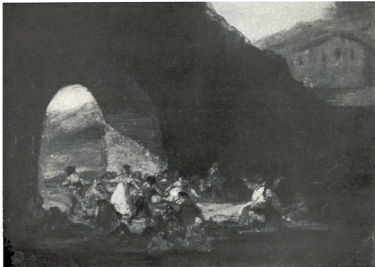
FRANCISCO DE GOYA Y LUCIENTES "FIESTA POPULAR" Óleo, ancho 1m, alto 6m72 Propiedad del Museo Nacional de Bellas Arte

El profesor Augusto L. Mayer, quien, como dice exactamente el Catálogo del Jockey Club hace figurar a "Una Procesión Interrumpida por la Lluvia" ("El Huracán") en la colección de ese Club, afirma también que "La Fiesta Popular" ("Escena Bajo un Arco de Puente") se halla en el Museo de Buenos Aires, y según él es éste también al que se refiere Beruete y Moret, como me lo manifestó en Munich en 1922, cuando preparaba su obra sobre Goya, al agradecerme la