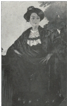
LAUREANO BARRAU Español contemporáneo "REVERIE" Oleo, ancho 0m845, alto 1m325 Legado Francisco B. Recondo

El legador de estas obras nació en San Pedro (provincia de Buenos Aires), el 21 de Mayo de 1865, y falleció en esta Capital, el 22 de Septiembre de 1927. Durante su vida se dedicó al comercio, iniciándose al lado de su padre, en su ciudad natal. Posteriormente se