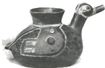
Colección Agustín de Rada Cacharro en forma de pato