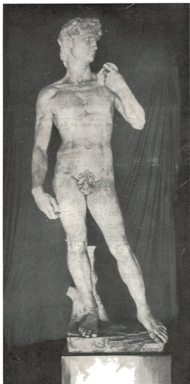
MIGUEL ANGEL BUONARROTI Italiano 1475 - 1564 "DAVID"

El calco ha sido ya instalado en el "hall" de entrada de este Establecimiento.