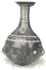
Anfora parecida a las que actualmente se usan para la chicha Colección Agustín de Rada

de "Tiahuanacu" de Antropología y Prehistoria — los más serios elogios, está distribuída en cuatro vitrinas que se exhiben actualmente, junto con el Legado Recondo, en la Sala No. 9 (planta baja).