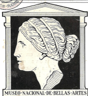
MUSEO NACIONAL DE BELLAS ARTES