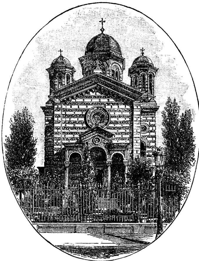
BISERICA DOMNIȚA BALAȘA ÎN BUCUREȘTI.