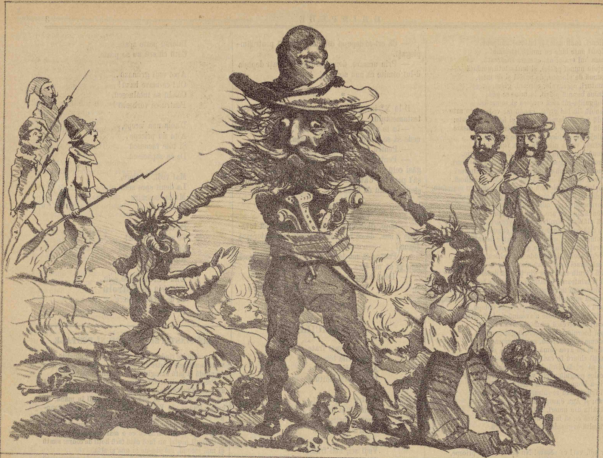
Don Carlos în Spania, Don Carlos în România, unul și același în două extremități ale Europei le ține de păr și le maltratează, pe când instrumentele se ucid, ard și jefnesc. O TEMPORA, O MORES!