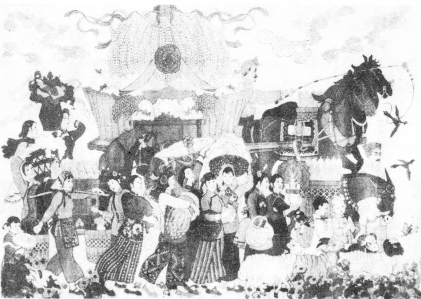
人民公社好 生产步步高