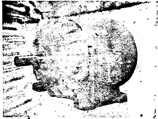
全封閉式感應馬達