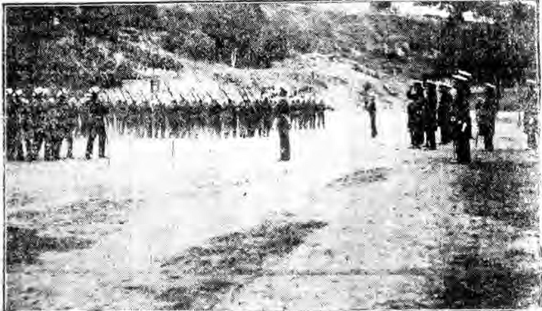
陳委員長閱海軍學校學生教練攝影

磯日測艦，十七日早晚風大，中午勉強測測十海里，十八日風大未能工作，十九日以後，連日天氣欠佳未能測，二十二日寄錨通州附近之蘆港，二十三日測測三十二海里，晚寄錨福山對江，二十四日測測三十六海里，晚寄錨西周附近。 青天測艦，十七日觀測三角點兩處，並量測線十一條，十九日觀測三角點三處，並行扇形測測及安設標石牌六塊，二十日離湖口下駛，晚寄錨汪家場，二十一日航行兩次，觀測三角點三處