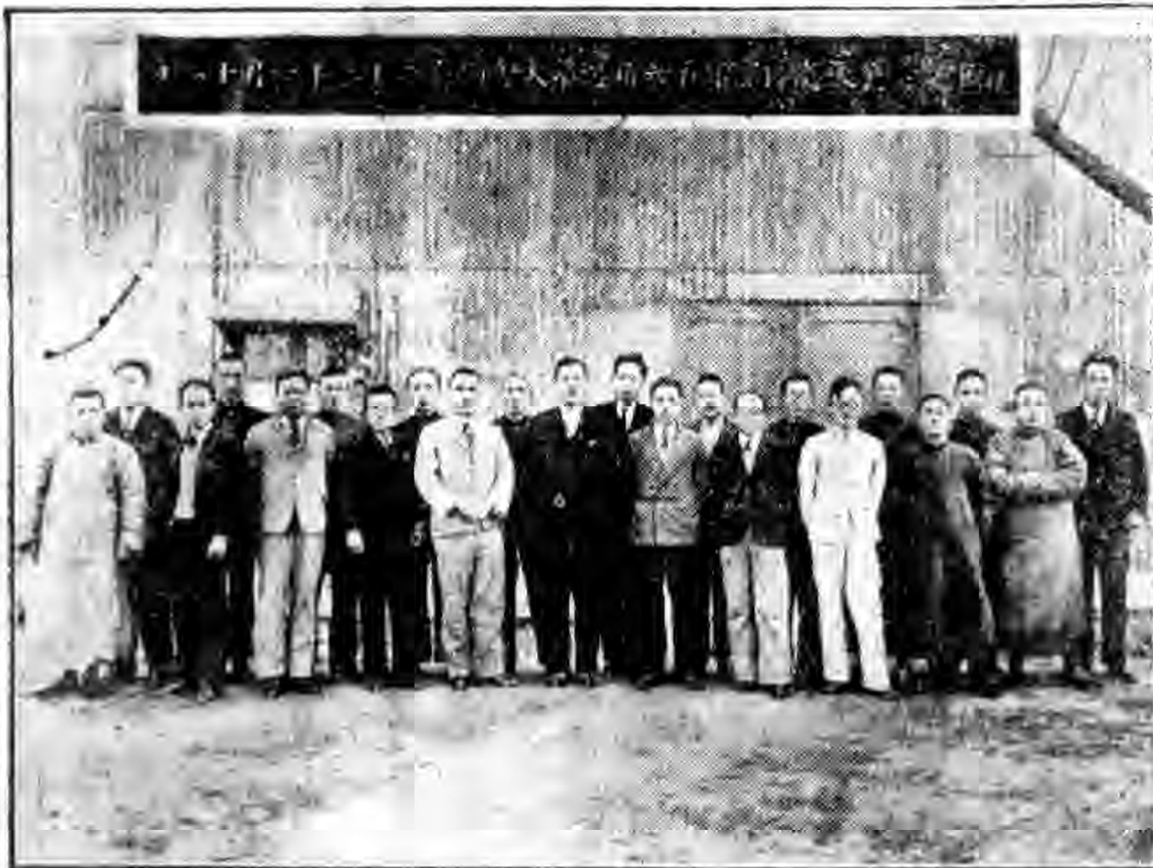
製造飛機處區黨部黨員大會攝影

其次教育的目的原為義，從前儒家學說都離不開仁與義，仁是愛羣之信仰心；義是由愛羣之信仰所發生之責任心，孔子說仁，含義較廣，孟子則說仁義，用意實同，中庸「智仁勇三者天下之達德也，」智所以識仁，勇所以行仁，智是理智的啓發，仁是情性的薰育，勇是因理智與情感之判斷所生之行為，所以凡言智，——智育，必及仁——德育，言智仁——知，必及勇——行，蓋以使「智仁」之「知」進而為「行」以成「義」也，故曰「見義勇為，」仁者必有勇，是故教育而不及義方，是亡國之教育也，讀文天祥之言：「孔曰成仁，孟曰取義，惟其義盡，所以仁至，讀聖賢書，所學何事……更可明教育之最終目的，亦惟在成仁取義而已，由此意義，吾人亦可曰：「觀其義而知其教，」至於國家法律紀綱的作用，在使人守廉，凡有越軌之言行，都有裁制之標準，若紀綱不立，則「上無道揆，下無法守，朝不信道，工不信度，君子犯義，小人犯刑，」人人不盡應盡之義務，期享非分之權利，將何處以求廉之精神之表現耶，是以吾人亦可曰「察其廉而知其法」社會風氣之振飭，必先使人明恥，若任全國報紙刊物日日以邪淫殺掠之消息宣傳于社會而不知禁，亦幾希矣。