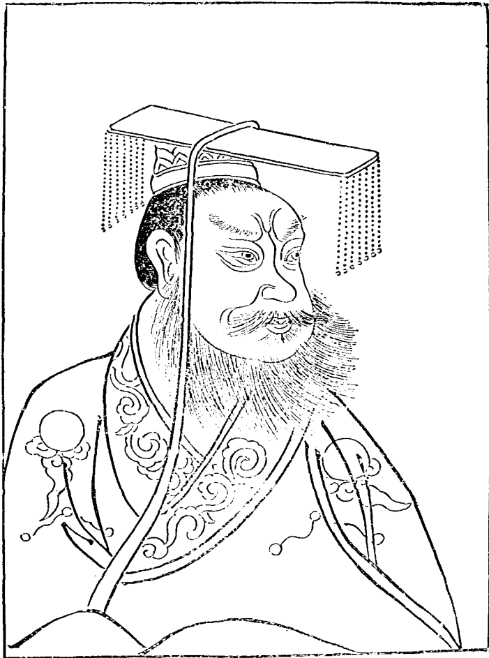
秦 始 皇 像