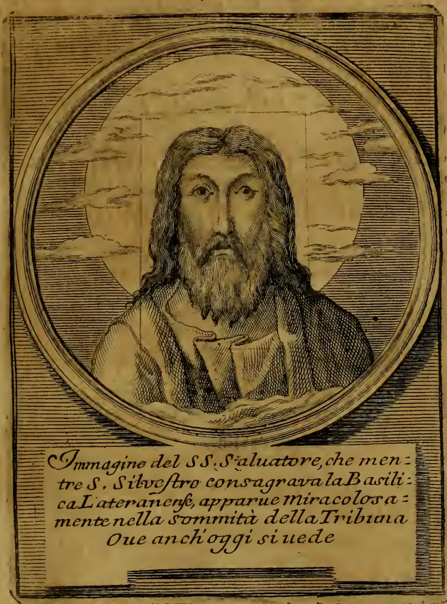
Immagine del S. S. Salvatore, che mentre S. Silvestro consagrava la Basilica Lateranense, apparue miracolosamente nella sommità della Tribuna Ove anch'oggi si uede

in ciascuno de' lati della quale si veggono quattro Cherubini in atto di adorare, e di sopra un Serafino con sei ale; e tutto il resto finge nuvole. Questa Immagine del Salvatore debbe avvertirsi, che non è lavoro dell'Artefice, che d'ordine di Niccolò IV. dipinse il rimanente della Tribuna; ma ben nell'atto, che si consacrava da San Silvestro questa Chiesa, e nel luogo