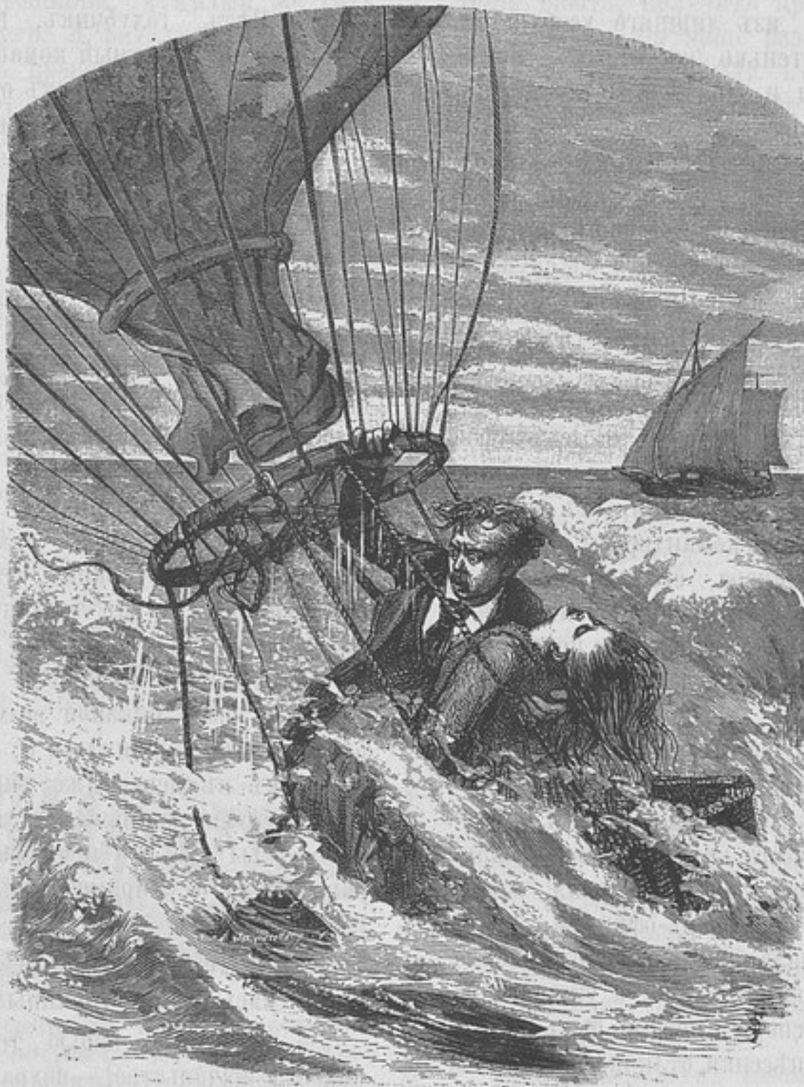
Катастрофа съ супругами Дюрюофъ 31 августа 1874 г. (къ рецензій «Завоеваніе воздуха»).

Трудно сказать, какъ относились къ нему нижніе чины, но самъ-то онъ каждого изъ нихъ представлялъ себѣ не иначе, какъ мазурикомъ, негодяемъ, во всякую минуту способнаго на разныя мерзости и преступленія; въ виду этого, во-первыхъ, онъ никогда ничего не довѣрялъ нижнимъ чинамъ, всегда подозрѣвая ихъ въ обманѣ, а во-вторыхъ, считалъ необходимымъ