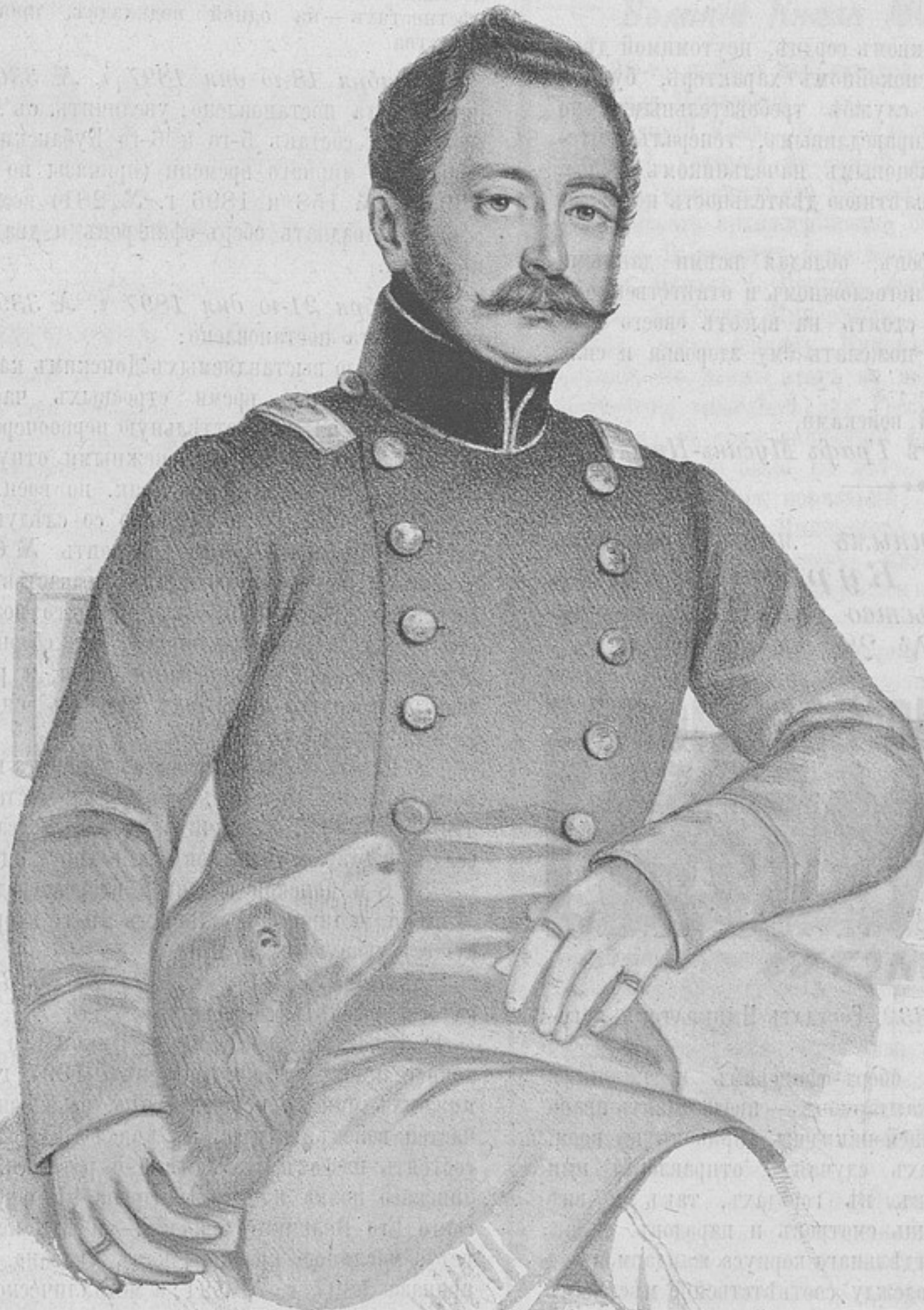
ЕГО ИМПЕРАТОРСКОЕ ВЫСОЧЕСТВО, ВЕЛИКІЙ КНЯЗЬ МИХАИЛЬ ПАВЛОВИЧЪ.