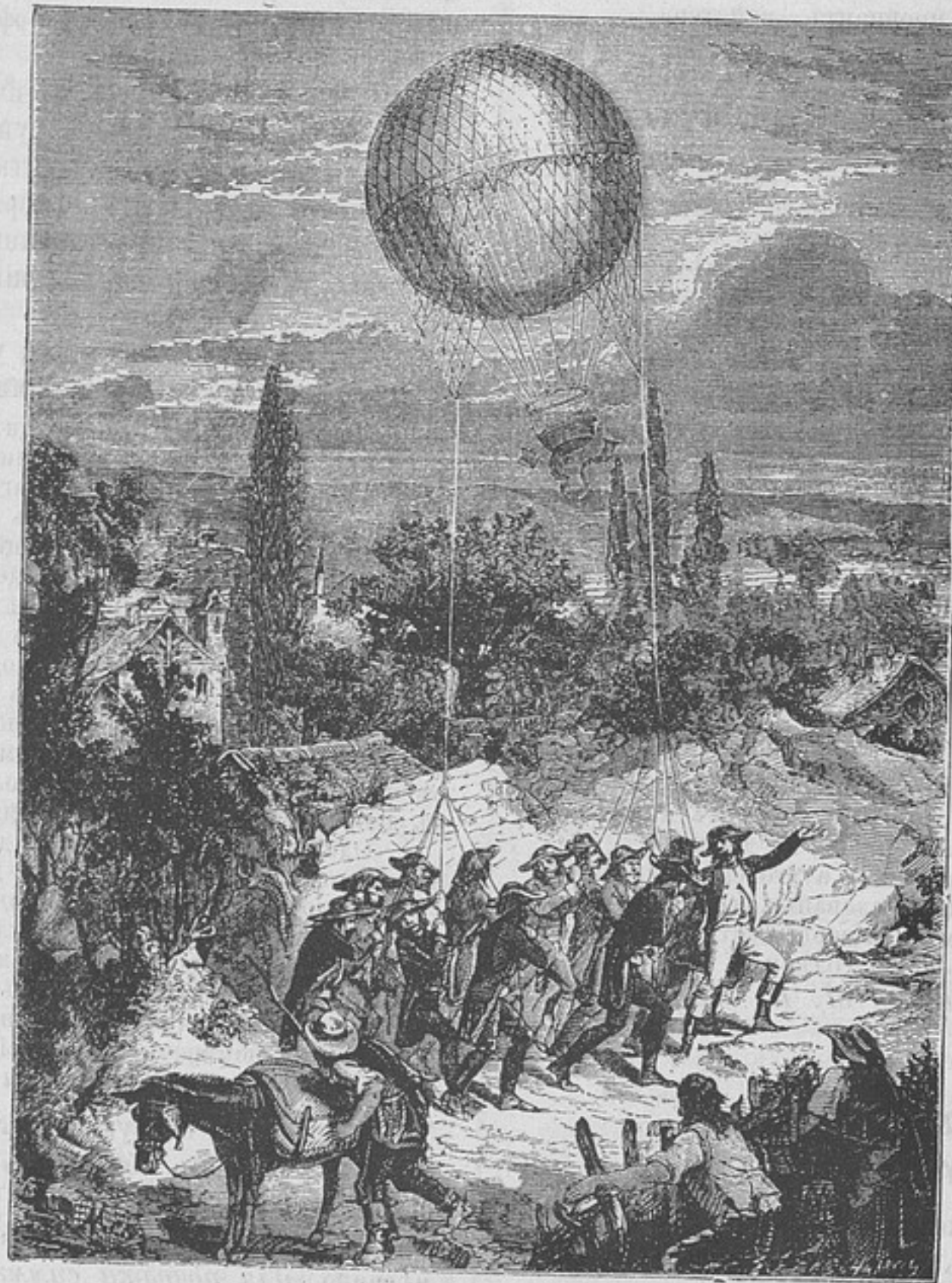
Передвиженіе шара изъ Мобежа въ Шарлеруа (къ рецензій «Завоеваніе воздуха»).