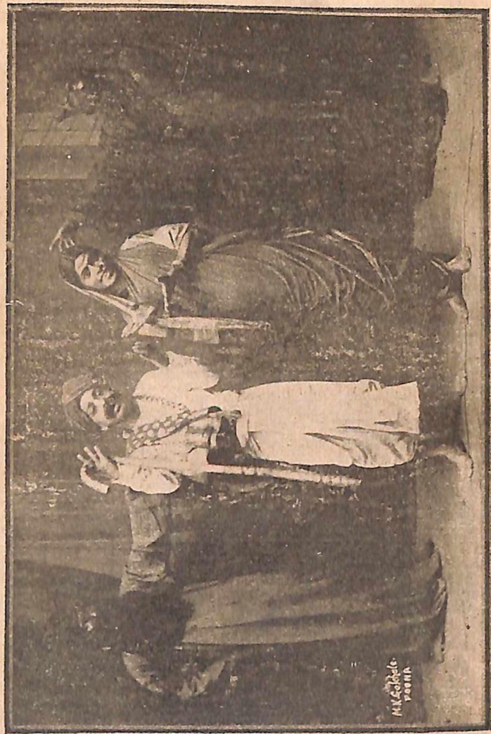
दगडुबुवा०—ना रगि असहूत पाठी उभा.