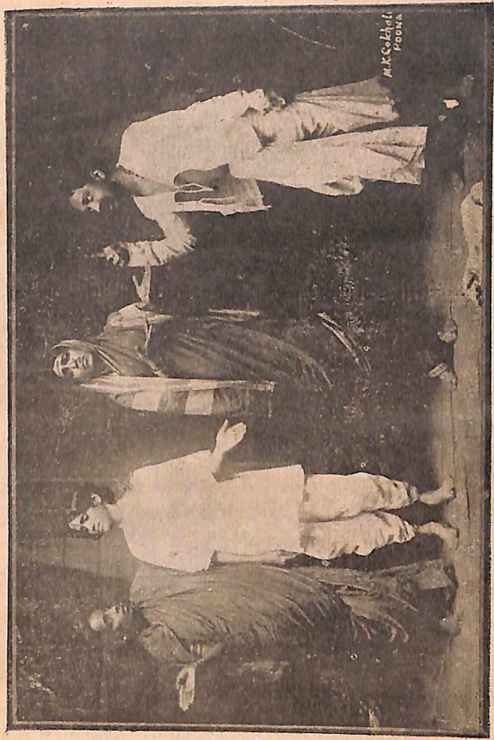
दवाडलवा०—दागिने घालण्याकरितां मी दुसरी बायको करीन बरं.