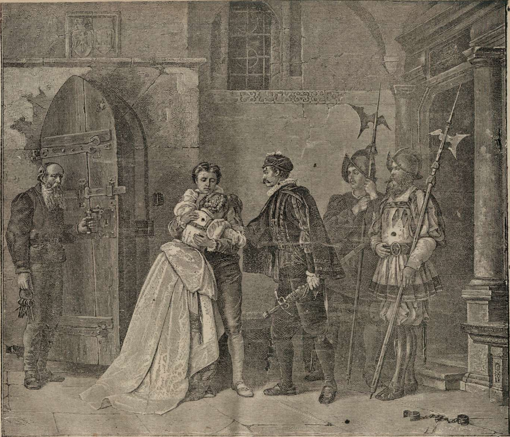
LA USI'A INCHISORII.