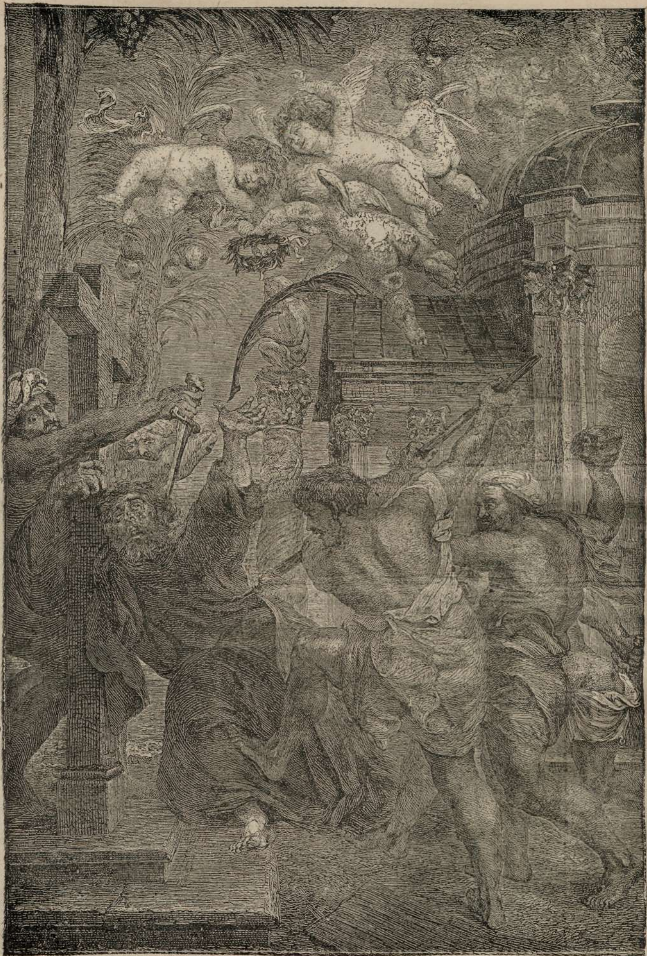
UCIDERA SANTULUI TOM'A.