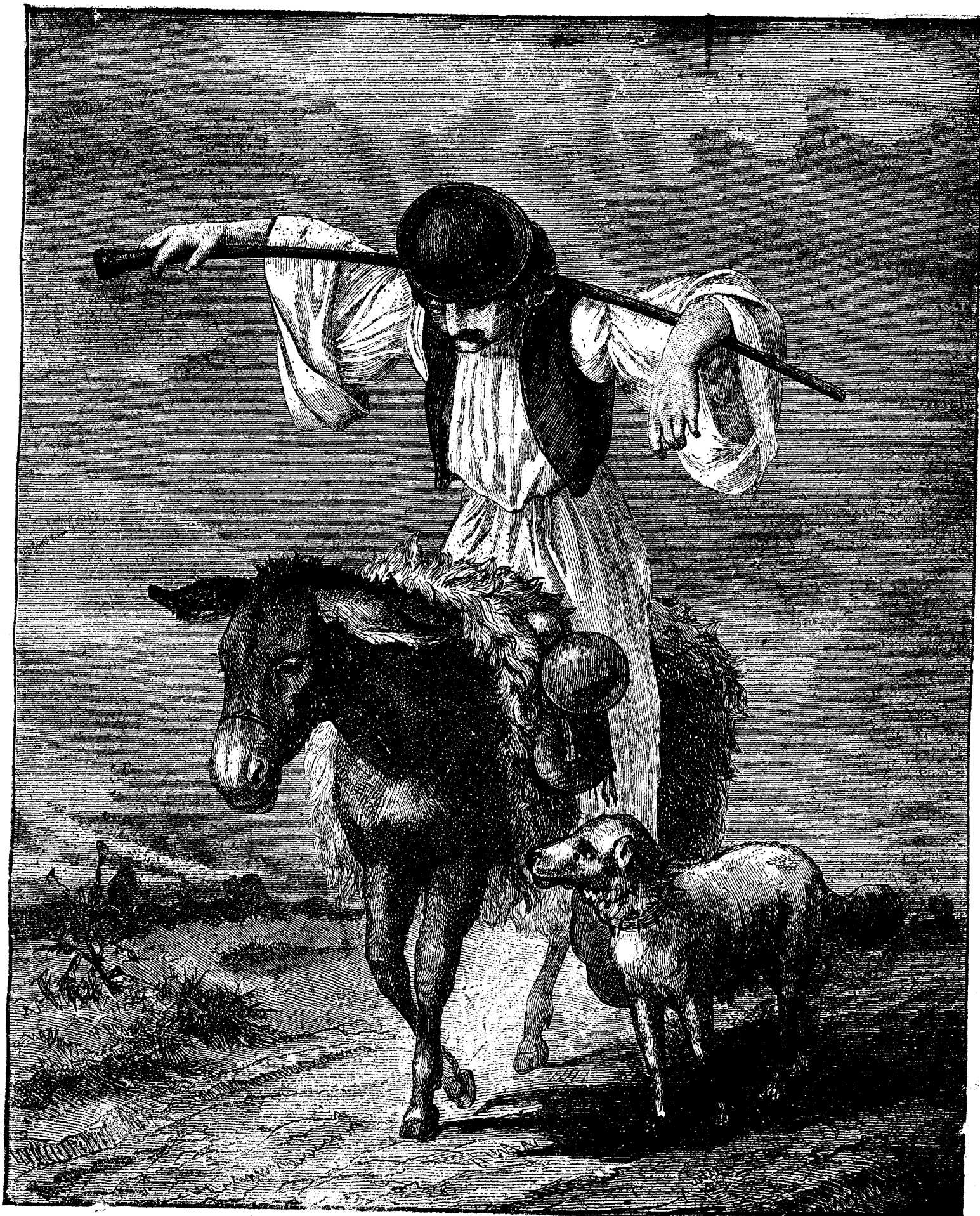
PECURARUL DIN CÂMPIE.