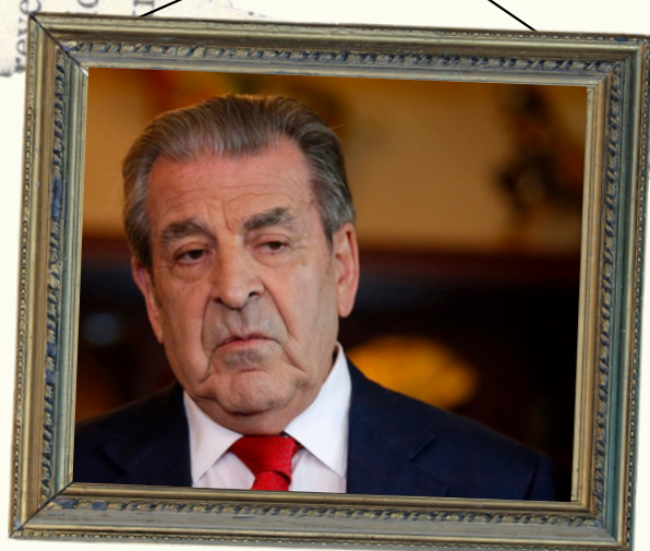
Ex-Presidente Eduardo Frei Ruiz-Tagle (1994-2000)