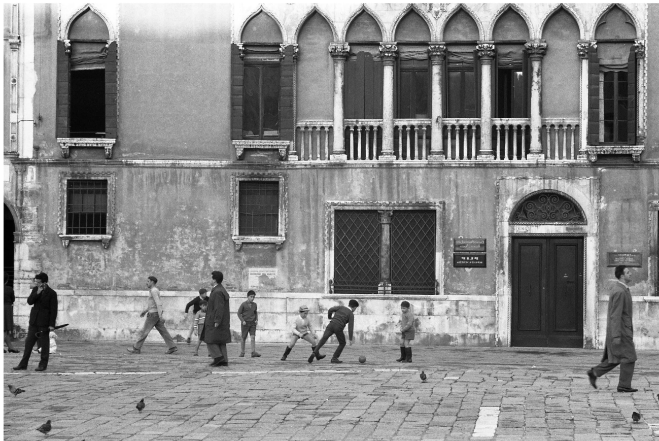
Paolo Monti Serie fotografica : Venezia, 1960