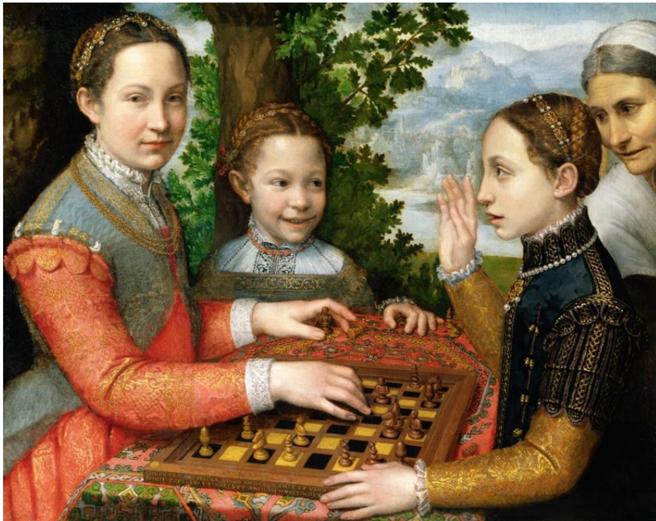
Sofonisba Anguissola Le sorelle della pittrice Lucia, Minerva e Europa Anguissola giocano a scacchi 1555 - Olio su tela. Conservato presso: Muzeum Narodowe, Poznan