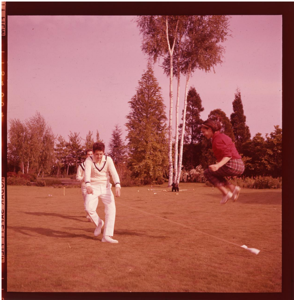
Paolo Monti Servizio fotografico : Italia, 1957