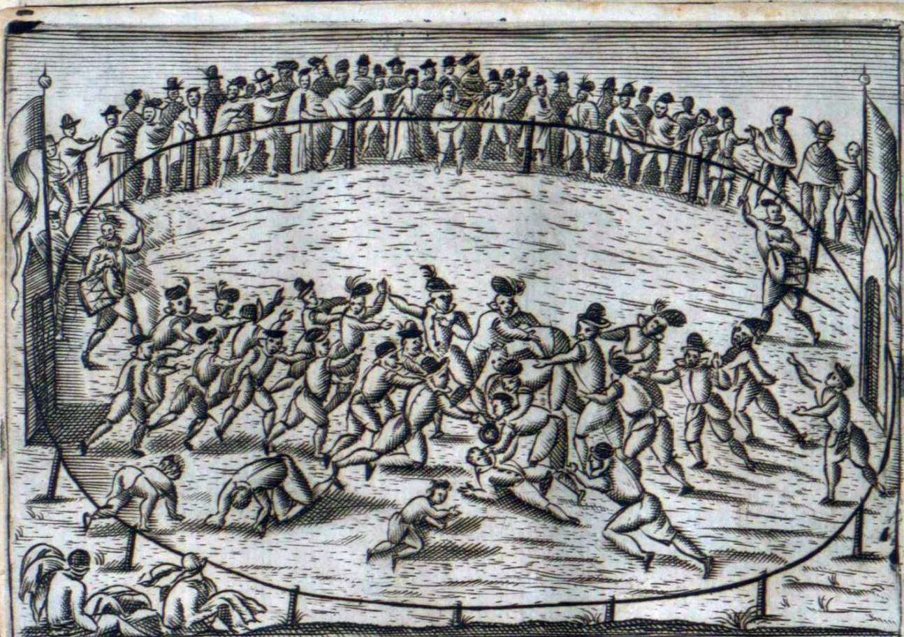
LVDVS QVEM ITALI APPELLANT IL CALCIO