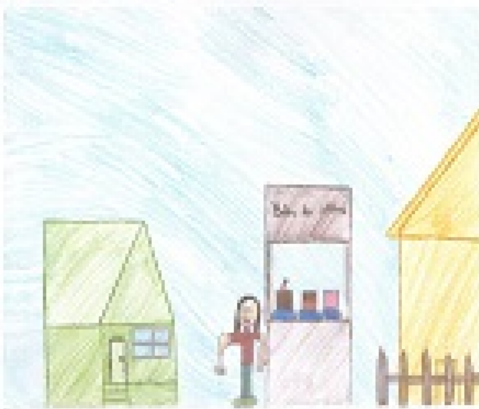
«Dall'idea di un negozio di vendita a un vero negozio online, dalla sua nascita alla realtà»