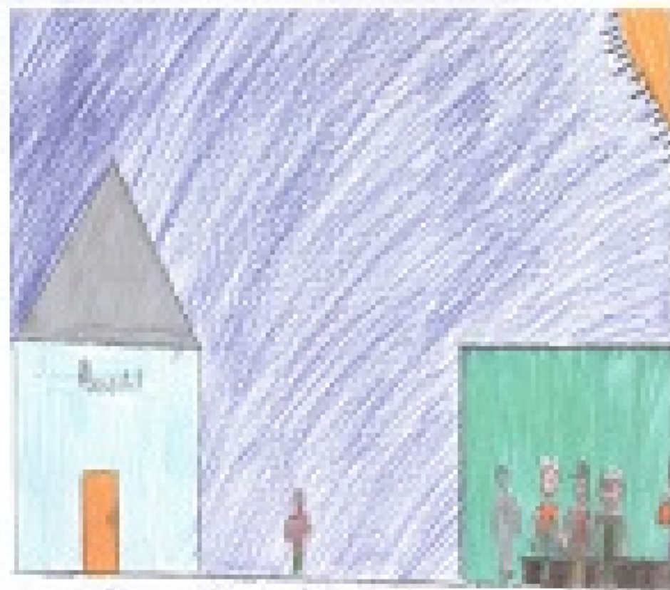
Two houses, one blue and one green, with a person in the middle.