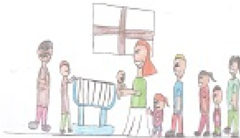
Una famiglia fa un'attività di gruppo.