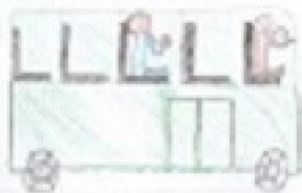
Un bus che vi porta in un posto.