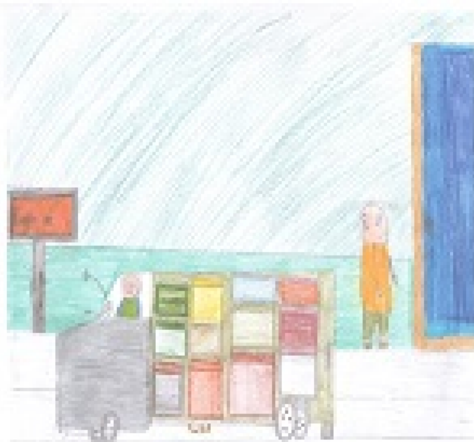
Figure 1. A street scene in a village.