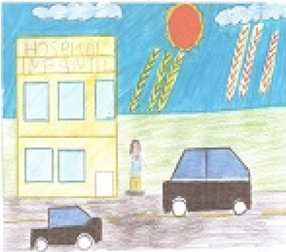
Picture of a hospital building in the city