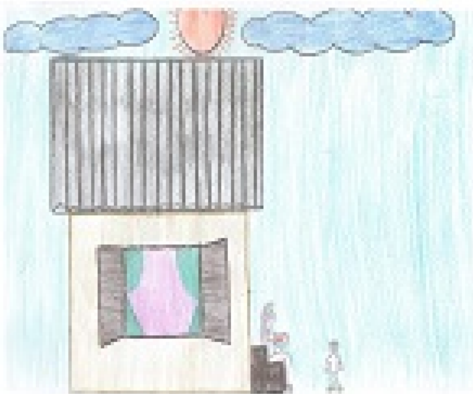
Picture of my house in the city