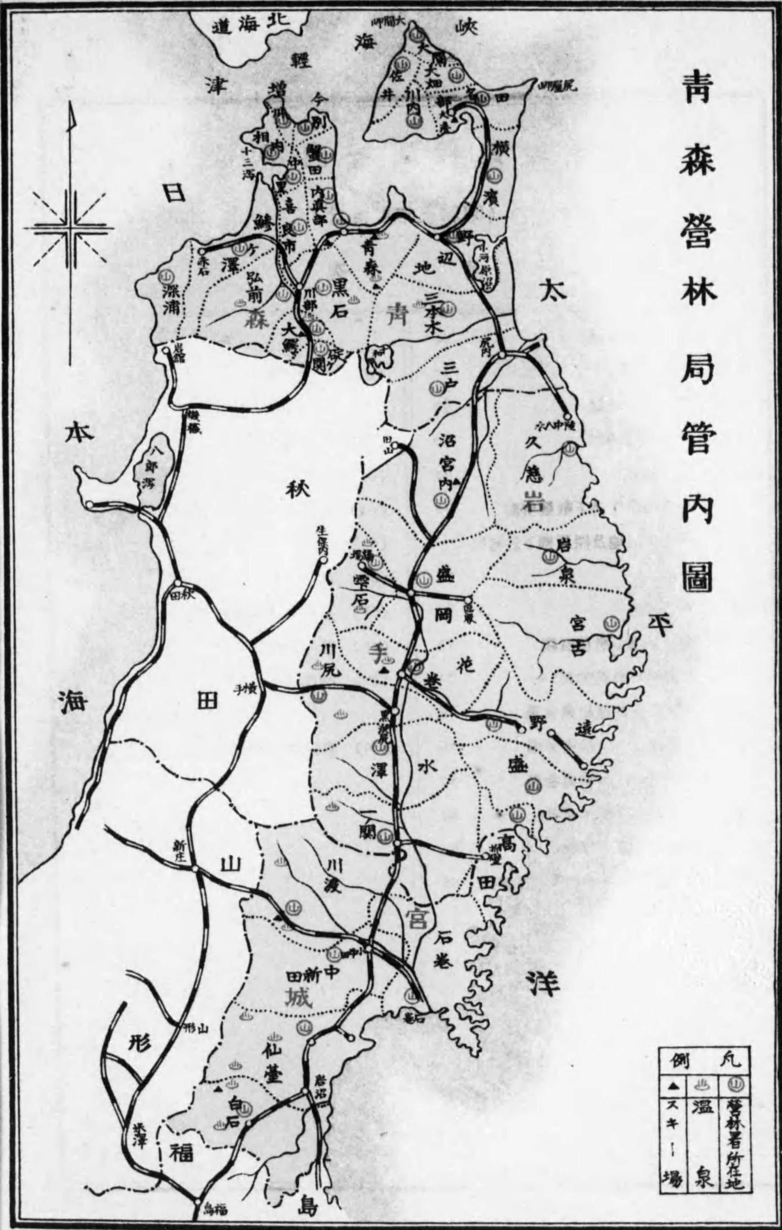
青森營林局管內圖