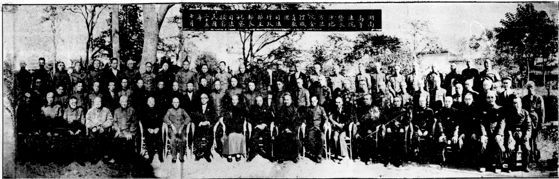
湖南高等法院 沙地方法院 全體職員 迎 司法行政 部長 紀 司法 總長 民國二十五年 十月