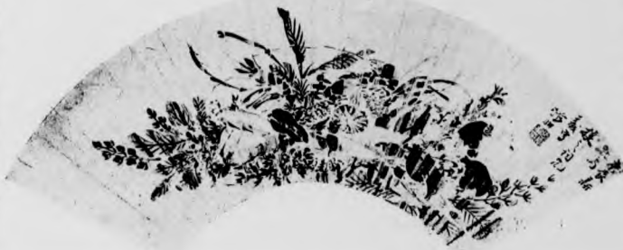
明 張 獅 花 卉 扇

殿前、呈雄武軍進者白鷹、誤認殿上畫雉為生、翼臂數四、蜀主嗟異久之、遂命翰林學士歐陽炯撰畫奇異記以旌之、峯有春山圖、秋山圖、家山晚景圖、山家早景圖、山家雨景圖、山家雪景圖、山居詩意圖、瀟湘圖、八壽圖、今石牛廟畫泚水一塔、