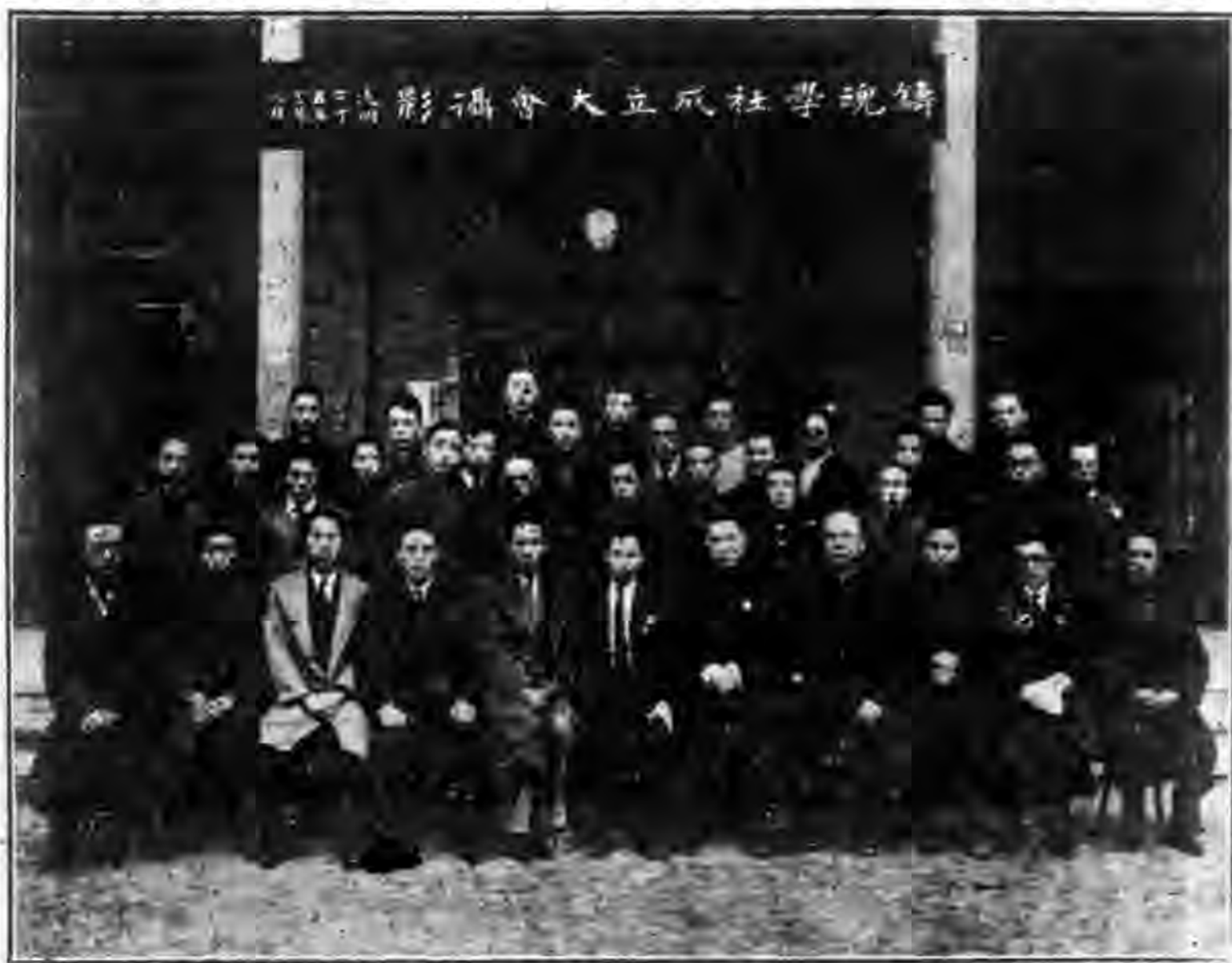
鑄魂學社成立大會攝影紀念