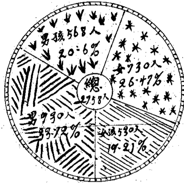
三十六棚人口總計百分比較圖 民國二十年十二月統計