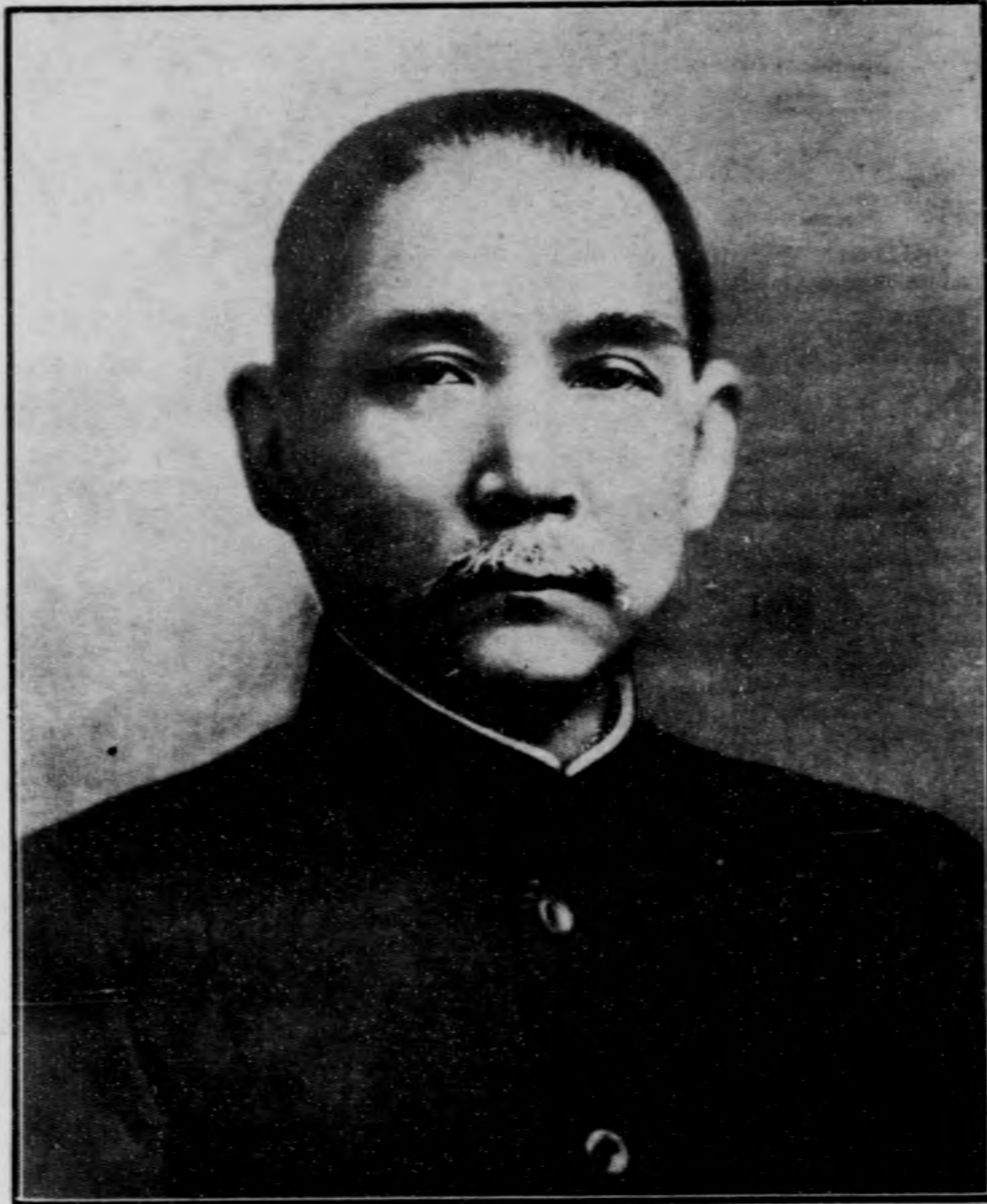
孫 總 理