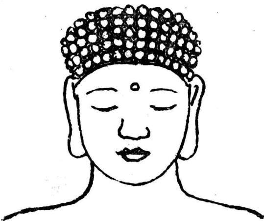
釋 迦 牟 尼 像