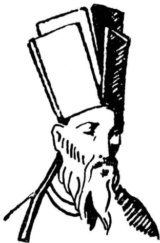
像 竇 瑪 利

利瑪竇 在我國傳教，很費了一片苦心，爲避免引起我國人的反感，極力研究我國文化，把他自己的生活也完全中國化；又極力介紹西洋學術，以交結一般智識階級，果然得到 徐光啓 、 李之藻 等名士的敬仰，吸引了許多名士貴官做教徒，後來的教士，也都師承 利瑪竇 ，