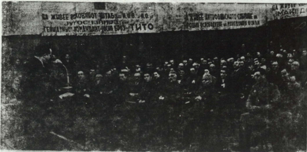
Едвард Кардел зборуе

драни од вие на АСНОМ, при бурни оваци на присутните делегатите — гости: Едвард Кардел, вицепредседател на Националниот комитет на ослободуењето на Југославија; мајор Инков, претставител на СССР; мајор Милер, претставител на англиското правителство; мајор Дженсон, претставител на американското правителство; Благоле Нешковиќ и Михајло Гjurковиќ, членови на АСНОС; генерал-лејтанант Добри Трлешев, претставител на бугарското правителство; генерал Светозар Вукминовиќ — Темпо, член на Врховниот Штаб, Бранко Пешич, член на АСНОС, от Ниш и Тасе Трпковиќ, претставител на НОФ на Македонијата от Ниш.