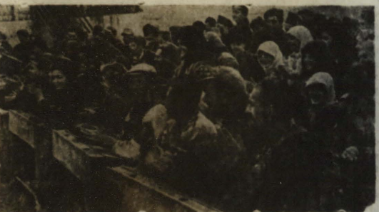
Момент от културно-просветната приредба во село Горно Соопје

Втората задача која се изврши пред нас беше да откриеме аналифетски курсеви по сите катината на Македонија, да ги отвориме нашите училишта, за да премахнеме големата неписменост во нашиот народ. Затоа се изработи и кратки методски напатства. Во тие програми се внесе дух на демократизација и саободата на савеста. Религијата се внесе како факултативен предмет, што значи секој татко или маќка има право да препорача на своето дете да учи или да не учи религија.