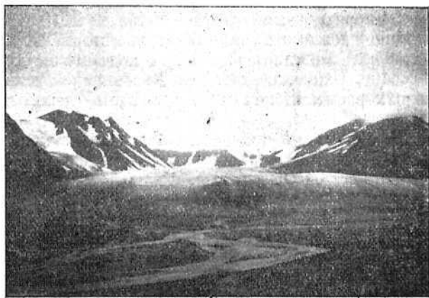
Ледникъ альпійскаго типа въ Южной долинѣ.

Невольно пожалѣешь и со всѣмъ съ другимъ чувствомъ, чѣмъ прежде, смотришь на собакъ во время перехода. Это уже не надоѣдливая псовая команда, въ которую поминутно запускаешь камнемъ, научившись этому искусству у самоѣдовъ,—а милые друзья. Надо ихъ видѣть, когда онѣ съ натугой тянутъ нарту по большой каменной розсыпи или когда съ визгомъ, задыхаясь отъ тяжести, втаскиваютъ нарту на гору. Надо видѣть ихъ каторжный трудъ, а увидавъ, невольно оцѣнишь старанье одиннадцати смысленныхъ собакъ.