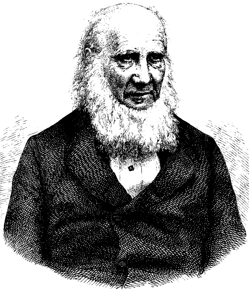
Nikolai Frederik Severin Grundtvig.

Schiller og Dehlenschläger, samt Fichte, Steffens og Schelling“. Her indgik han ogsaa det personlige Venstabs med Willemoes, hvis Sanger han siden blev. Han prædikede desuden jevntlig i Bødstrup Kirke, og i de første Aar prædikede han „saa delig om Fugle og Blomster“, men senere blev hans Prædiken „saa streng og alvorlig“, at hans tidligere Iyriske Tilhørere paa det nærmeste bortsvæmmedes. — 1808 vendte han tilbage til Kjøbenhavn, hvor han indtil 1811 laae paa Valkendorfs Collegium, og traadte her i et inderligt Venstabs til Hersleb og Sibbern, der indførte ham hos N. Treschow, Sverdrup og Brødrene Ørsted. — Men allerede forinden havde han vendt Opmærksomheden paa sig som Forfatter. Saavidt vi vide, er hans første Bidrag til Pressen en Artikel i Politivennen for 1804 („Et Særly i det 19de Aarhundrede“; angaaer „et skoleholderløst Sogn“ paa Falster), men allerede hans første Bidrag til Rahbeks Minerva 1806 („Ridet om Sangene i Edda“) valte i en ualmindelig Grad Nærups og andre Lærdes Opmærksomhed. „Mafferaballet i Danmark 1808“ var en bitter Satire over den letfindige Lyfthighed, hvortil Hovedstadens Beboere midt i Landets Trængselstid endnu havde Sind til at hengive sig; men hans Forfatterieendommelighed fremtræder dog først ret i sin fulde Bestemthed i „Nordens Mythologi eller Udsigt over Eddalæren for dannede Mænd, som ei selv ere Mythologer“ (Kjøbenhavn 1808) samt